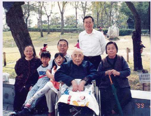
于公（中坐輪椅）全家福檔案（89.2）。

退休後，于公閱覽修習各類書典，擅書解經、文德兼備，經常為地方重大慶典撰題著稿，文采風揚，地方政要爭相競求墨寶，以顯德榮。另于公在宜蘭市地區廣邀熱心人士，定期排表訪視地區單身或住院榮民，遇有需要幫助之榮民弟兄，均不吝予以伸出援手，義行可表且數十年如一日，從未間斷。甚至在晚年時，亦常利用取藥或門診時機，探視長期住院的榮民弟兄，如此胸懷情操及同胞物與之精神，足為我後輩學習之楷模。