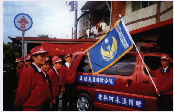
何老先生捐贈消防器材車，消防人員到場致謝(92.2)。