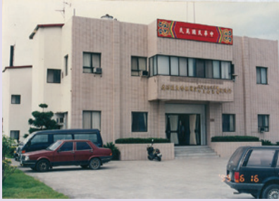
遷移改建後的宜蘭縣榮民服務處 (87.6)。