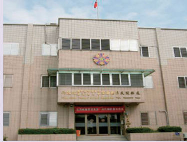
增建3樓之辦公大樓 (95.10)。