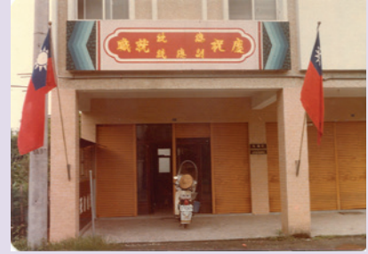
宜蘭縣聯絡中心舊址原貌 (51.3)。

輔導會為收容傷殘榮民及便於偏遠地區之榮民就醫，特於民國47年間陸續於宜蘭縣內成立蘇澳榮民醫院及員山榮民醫院；由於院區周遭榮民日漸增加，自成一處生活機能區塊，對於地區榮民生活的照顧與權益的保障日益需要，為了提供地區榮民相關的服務，49年4月20日輔導會特以（49）輔導字第1801號令當時的員山榮民醫院負責相關服務組織之籌設與規劃；49年6月1日在宜蘭縣各界的祝福下，於宜蘭市和睦路成立「行政院國軍退除役官兵就業輔導委員會宜蘭縣自謀生活榮民聯絡中心」，辦理相關榮民服務照顧工作。51年11月間因醫址與聯絡中心距離過於遙遠，造成行政支援不便，且適「森林開發處」安置大量榮民於木工廠、棲蘭山、太平山等林區工作，經輔導會核定改由「森林開發處」兼辦，並責由「森林開發處」處長彭令豐先生兼任聯絡中心主任，繼續指導辦理聯絡中心相關業務。