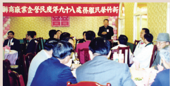
民國89年中秋節，皮處長主持廠商聯誼餐會。

輔導會因應經濟景氣低迷及產業外移的衝擊與變遷，於民國88年10月份秉持「給魚吃，不如給其一釣桿」之理念，特撥專款於各榮服處設置就業服務站，指派專人協助榮民就業服務工作，自辦榮民（眷）生涯輔導與就業媒合活動，開辦就業訓練班次、籌辦多元化座談暨廠商聯