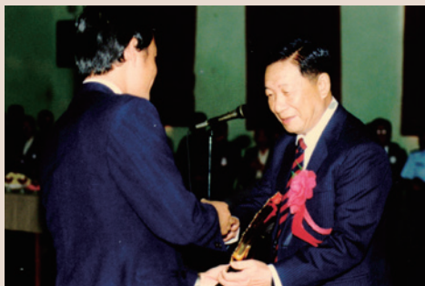
黃處長（右）於民國76年10月份第7屆榮民榮民節慶祝大會中頒贈獎牌感謝地方單位。

黃處長為陸軍政戰少將退伍，曾任國防部政戰部計畫委員，任期內以其多年軍中累積之經驗，對於新竹地方單位組織與運用最為圓融。配合輔導會資訊系統檔案建立，榮民服務處依輔導會發下電腦資料名冊，逐筆核對並存放服務處之紙卡檔案，整建工程完竣後，讓榮民個人資訊輸入電腦，縮短了工時，也為服務工作開創了新紀元。