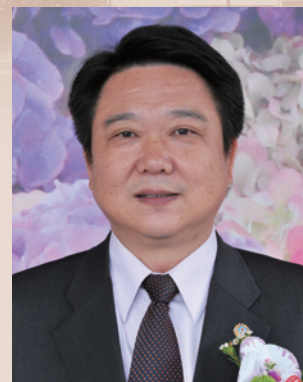
以傳承與關懷為服務工作本旨。

董處長到任後即鼓勵同仁要保持心情愉快，因為服務處以服務為工作主軸，沒有好的態度就沒有好的服務提供給榮民（眷），更以多一點鼓勵、少一分責難的領導方式，帶領全處穩健的成長，竭力整合多方社福資源、建構縝密服務網絡，自我期許要為榮民（眷）爭取最大福利及最好的服務照顧盡棉薄之力。