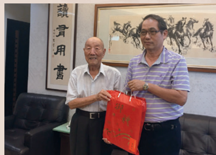
萬處長（右）訪視本處榮民楷模。

萬處長雖任公職但身兼藝術家身分，熱愛攝影創作、充滿人文素養，將這樣的氛圍帶進職場，時刻不忘提醒同仁保持學習熱情，創造自我的人生價值。高瞻遠矚，強調計畫、預劃及規劃，教導同仁事先做好準備必可帶來最佳服務績效。