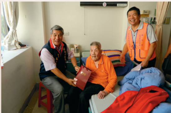
高處長率榮欣志工至臺北榮總新竹分院探視住院榮民。

民國82年初榮服處首次辦理榮民「大專子女自強聯誼活動」專案業務，旨在凝聚榮民第二、三代的力量，將父、兄忠貞、愛國的節操薪火相傳。84年廣續推出「榮欣方案」：由各地區榮民服務處成立「榮欣聯誼會」，本處於86年1月26日再成立「新竹榮欣婦女會」，繼原有架構，讓組織功能健全、蓬勃。遵輔導會指導原則，秉持「施比受更有福、予比取更快樂」的理念，