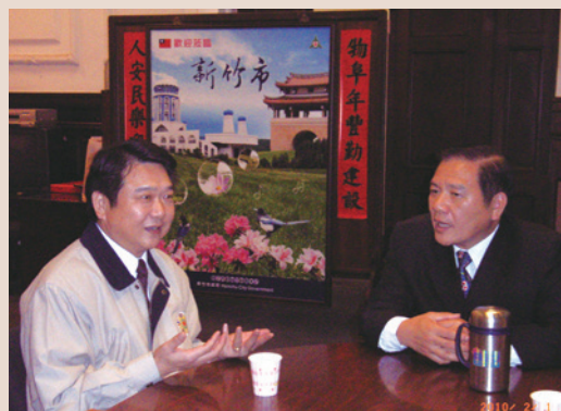
本處與新竹市政府協調說明會。

99年新竹市政府為改善財務缺口擬修改「安老津貼實施計畫」，原將新竹市領取半俸之遺眷改列為排除對象，經本處緊急協調並於市府辦理說明會中，竭力爭取領取半俸遺眷之權益，終獲新竹市政府同意將領取半俸之遺眷繼續列為安老津貼發放對象。