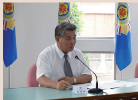
鄭處長指導同仁結合社區資源，辦理遺孤相見歡活動。

高處長希望用一個在地子弟的心懷，以尊老回饋為照護宗旨，於榮民（眷）最需要的時刻，以最殷切的方式，提供最滿意的服務，冀盼「讓我們的心中永遠都住著一位老兵」而永續傳承。