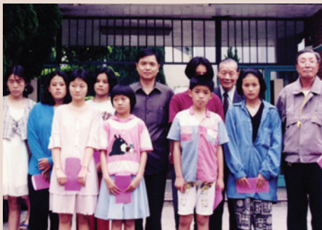
民國84年端節前甄處長（中）慰問袍澤遺孤。

處長陸軍官校37期工兵科畢業，少將退休，任內推動「榮民資料整合與校查」，透過地方政府社福部門、戶政單位、全民健保申請表等多重比對作業，建立了榮民資料的正確性與完整性。運用這些新穎正確的資料，發送一封封的問候信函，宣導輔導會近期的政策、目標；定期寄發生日卡、賀年片、榮民節活動邀請函，傳遞輔導會的關愛。