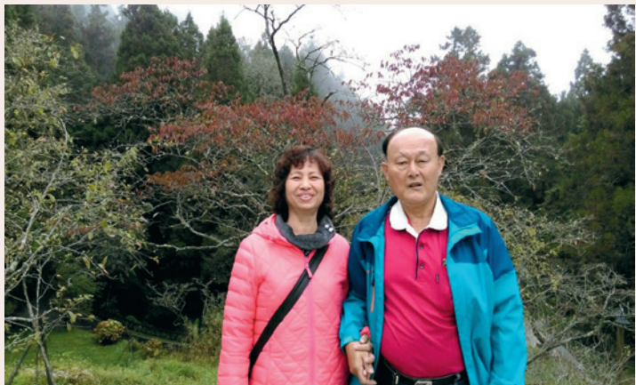
黃先生（右）與妻子鶼鶼情深，常攜手走遍各地。

89年元月榮獲新竹縣春聯書寫比賽成績優良，經評選為社會組之佳作。105年8月參加中華民國書學會第24屆丙申年書法教學研究會，研習成績優異經審核通過為「適任書法教師」，獲頒證書。優異表現，有助於提升榮民形象。為現任新竹縣書畫教育推廣協會、中華書法家協會、新竹縣湖口鄉藝文協會、新竹縣慈信愛心協會、新竹縣慈雲觀世音協會等組織之理事。長年積極推動書畫藝術，研習、交流、展覽等活動且持續不斷，期打造新竹縣成為一個充滿藝文氣息的環境，及溫和而好禮的書香社會。