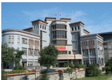
民國88年10月新建新竹榮民服務處辦公大樓。

40年代，由於追隨政府來臺退休老兵日增，遂奉令於民國49年6月1日成立「新竹縣自謀生活官兵聯絡中心」，51年12月改稱「新竹縣聯絡中心」，57年9月修正聯絡中心組織規程，74年2月16日成立「新竹縣市聯絡中心」縣市業務聯合辦理，76年8月6日更名為「新竹縣、市榮民服務處」，至84年縣市合併為「新竹榮民服務處」。88年5月本處辦公大樓竣工，10月21日自中央路搬遷至現址，「新竹榮車中心」同時進駐，為榮民袍澤啟動全方位的服務。因應組織改造，自102年11月1日起，本處更銜為「國軍退除役官兵輔導委員會新竹榮民服務處」。