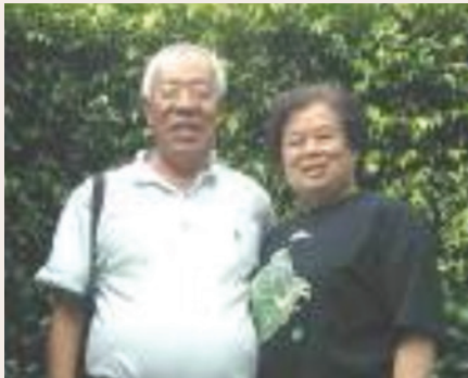
祿總幹事退休後家庭幸福美滿(94.9)。

先生早年自政工幹校畢業，後服務青年日報社多年，自軍中退休後轉行經營織布廠、經商多年，頗有所獲，後結束事業，於民國76年轉入輔導會第一處服務，負責亡故榮民善後處理工作，清查檔案，整理亡故榮民遺產，歷時三載，併研定管理辦法，績效優良。83年調任南投榮民服務處總幹事，86年調派本處服務，迄89年1月屆齡退休。