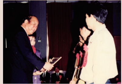
王處長（左）主持第15屆榮民節慶典活動。

長達3年6個月期間，跑遍了新竹縣、市大小鄉鎮、各地眷村、榮民居處，訪問及協助榮民不計其數，無論颱風、大雨、任何時間，只要榮民有需要幫助之處，必然有處長身形在該處出現。