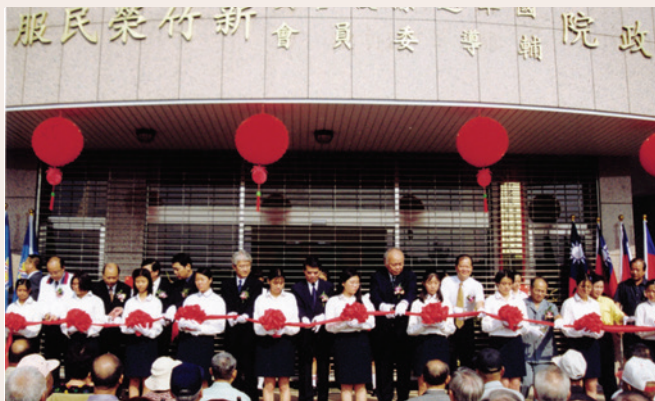
民國88年10月21日辦公大樓啓用典禮，輔導會馬副秘書長（中央）、新竹縣長鄭永金（右6）、市長蔡仁堅（右12）蒞臨共同主持剪綵。

舉辦各種懇（座）談會，加強照顧外住就養獨居榮民及遺眷、榮民防騙宣導、適時辦理榮民及遺眷急難救助紓解困境，於竹東榮民醫院設置服務台、榮民遺孤認養、贊助榮民子女就學、大陸配偶輔導照顧、榮欣志工服務隊加強輔導照顧榮民（眷）、單身亡故榮民善後服務、善盡遺產管理工作、榮民榮譽基金會適時服務，以嘉惠榮民（眷）等，竭智盡忠、努力以赴。