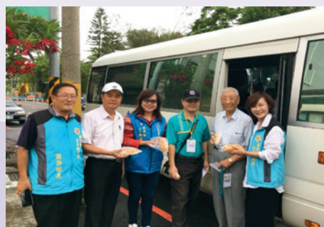
民國107年7月4日就診專車提供餐點。