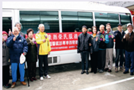
民國105年2月3日就診專車首發。

本項服務係採租賃中型巴士辦理，扣除司機與隨車服務人員外，可提供18人搭乘，路線採單向往返方式辦理，行駛路線行經後龍鎮、苗栗市、公館鄉、銅鑼鄉、三義鄉等鄉鎮8處候車處，最後載達臺中榮民總醫院。另為強化與提升本項服務之品質，募集資源自107年7月4日起於車上提供營養餐點，讓榮民眷就診前後能適時補充營養，養足精神安心就診。