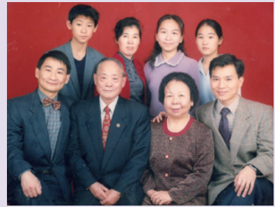
吳主任（前排左2）全家福照片（83.3）。

70年3月軍職外調任職苗栗縣聯絡中心主任，此期間經綿密查訪，榮民驟增3,000人；為改善舊有辦公大樓，將核定興建之2層樓房，商請苗栗縣謝金汀縣長支助158萬元，增建為3樓，始得以解決職員及榮民住宿問題。主任個性耿直，自奉廉潔，生活規律，嚴以律已，誠厚待人，行事認真，以「誠信、盡責、謙和、堅定」為準則，深獲長官同仁部屬之敬愛及好評。