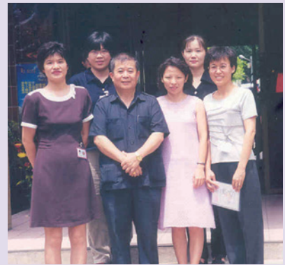
馬處長（前排左2）與榮服處員工合影（88.6）。

87年5月1日至87年6月30日任職苗栗縣榮民服務處處長期間，除積極訪視全縣榮民（眷）及遺眷，主動拜訪地方首長、民意代表以增進聯誼，並親自主持榮民座談，藉發掘問題，主動協助解決問題，每月更是利用公餘親撰上月服務工作成效檢討、未來努力方向及近期工作指示，分發全服務處同仁，以利工作知所遵循。在職期間敦親睦鄰，急公好義；尤對協助榮民（眷）就業，更是戮力以赴，深獲榮民（眷）好評。