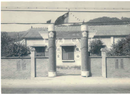
民國59年苗栗縣聯絡中心（59.8）。

苗栗縣榮民服務處於民國47年10月1日成立之初名為「行政院國軍退除役官兵就業輔導委員會中部地區自謀生活榮民輔導小組」，下轄苗栗、臺中、彰化、雲林、南投、嘉義、澎湖等7縣及臺中市，隸屬臺灣省社會處，由「雲林榮譽國民之家」主任兼任組長，業務由「行政院國軍退除役官兵輔導委員會」督導。