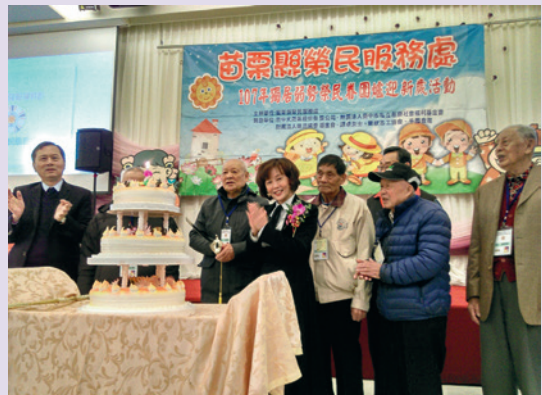
陳處長主持107年獨居弱勢榮民眷圍爐迎新歲活動。

就任後勉勵同仁追求卓越，服務猶親，積極推動以下工作策略，期能持續精進、創造多元與全方位的服務：一、建置合作平臺，精進就業服務。二、架接醫養資源，提升醫養照護。三、提升專業知能，協助長照推動。四、掌握內外資源，發展整合網絡。五、落實服務照顧，彰顯榮民價值。六、運用社群媒體及影音力量行銷榮服處，彰顯存在價值。