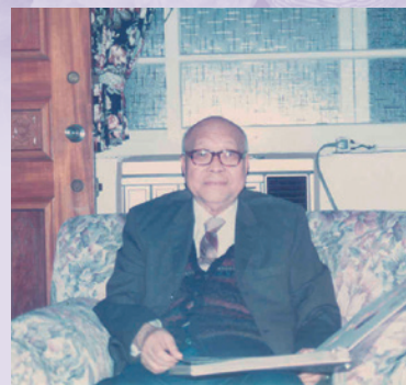
胡主任居家生活情形（85.3）。

胡主任民國3年6月26日生，江西省泰和縣人，自幼勤奮堅毅，好學不倦，及長聞日軍侵華之實，乃將原名開英改為甲裏，以遂馬革裹屍報國捐軀之志。17歲考入陸軍黃埔軍校第8期就讀，畢業後，歷任軍中各基層職務後，再考入陸軍大學16期進修，隨後任教陸軍大學，並參加抗日及剿匪戰役，先後歷任科長、處長、副師長及師長等職。退役後先後任職於臺東東河農場場長及臺中、苗栗聯絡中心主任，服務期間急公好義，濟危扶困，協助榮民就業不遺餘力。主任一生清廉自持，嚴已寬人，學生部屬受惠者不計其數，公職退休後讀書寫作，含飴弄孫甚得其樂。