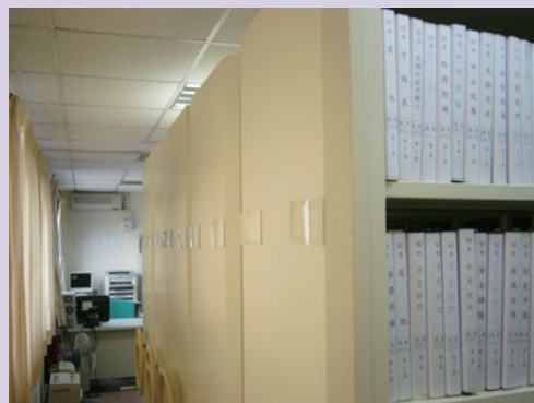
民國91年1月1日整建之檔案室。

為使所有文件及單身榮民亡故檔案均能符合檔管局之要求，積極規劃設置檔案典藏場所與應用環境及其相關設施，諸如防潮箱、滅火器、遮陽設施、控溫裝置、溫溼度計、低輻射日光燈、滅火器、庫房設置改善、閱覽空間規劃及配置設備（電腦周邊設備、冷氣、傳真機、檔案櫃），於民國92年1月1日完成3樓檔案室整建，使本處檔案管制儲存得以達到現代化、整體化之標準，成為最完善的檔案管理設施，使檔案管理人員能有舒適、溫馨的工作環境，更提升了工作效率與有效檔案管理的目標。