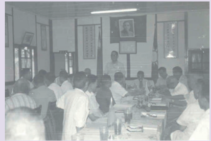
廖主任（中立）主持榮民座談會議（65.8）。

60年11月1日退伍，自65年7月1日至66年9月1日任職苗栗縣榮民連絡中心主任，任職期間以前瞻性、整體性、根本性為著眼，服務照顧榮民，提升服務照顧品質，著有成效。