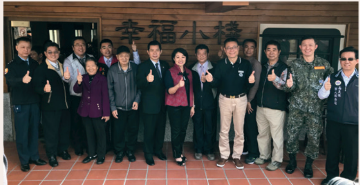
幸福小棧—活力據點揭牌儀式。

置專人提供專業醫療技術以外之各項服務及諮詢，主動發掘榮民問題與需求，提供及時性服務，以多元化管道提升服務之效能與品質，自94年以來每年服務人次均達6千人次以上。為實踐「走向榮民，服務榮民」之便民理念，提升服務品質，本處檢討各服務網榮民（眷）集居