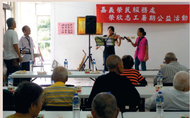
榮欣志工公益表演。

為善用志工人力以提供更多元化之服務，特建立榮欣志工人才資料庫，依專長區分水電、理髮、烹飪、美工、單車修護、表演及書法等7大類，依不同活動及榮民需要前往表演或服務，每年志工服務總人次均達3萬餘人次。