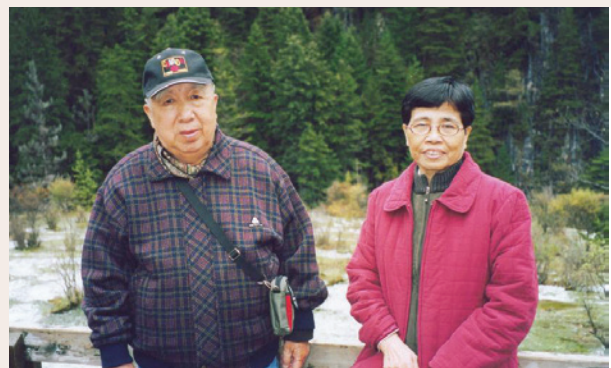
蘇先生（左1）伉儷情深踏青怡情（79.6）。