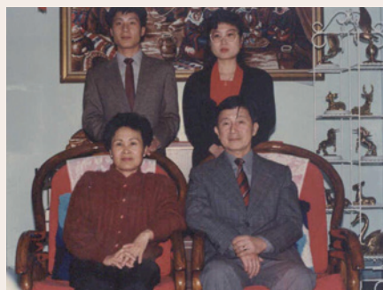
杜先生（右1）早年全家福（86.8）。

面對自己的工作，即使遭遇困難挫折也堅持到底。相處時我們看到了他對生命的執著，也分享他因付出而獲得的心靈滿足和愉悅。