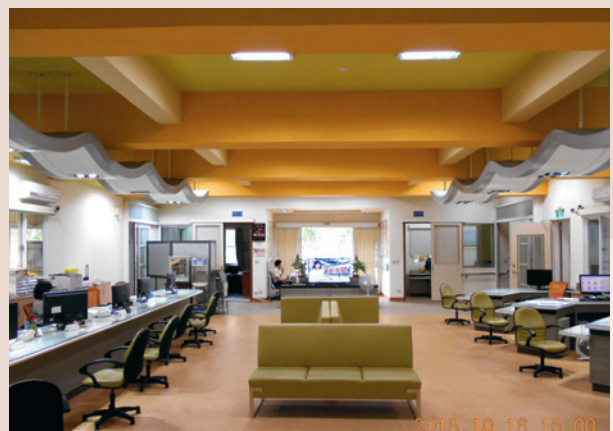
整修後1樓辦公櫃檯。

101年5月28日辦理辦公廳舍整修，將原本封閉式辦公環境，改為開放式，並設置民眾等候休息區，讓洽公民眾有賓至如歸的感受，同時設立全功能櫃台，一處收件全程服務，改變以往辦理不同業務需至不同櫃台之困擾，每年均服務超過3,000餘人次。