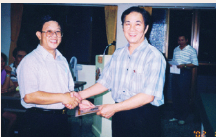
王副處長（右1）頒獎表揚專長訓練績優榮民（91.8）。

在嘉義榮服處副處長服務期間，襄助首長，戮力提升員工本職學能，精進服務態度，建立可長可久的制度，指導建構服務體系網絡，規劃單身亡故榮民善後作業，完成地區第一個共同供應契約招標作業，落實服務幹部評比制度，延伸服務據點於嘉義及灣橋榮院，分別設置「聯合服中心」、聯繫嘉義基督教醫院等社福單位提供單身獨居榮民送餐服務；另身負媒體發言人角色，對媒體報導相關榮民問題，總是謙虛、誠懇以對，保持良好互動關係。