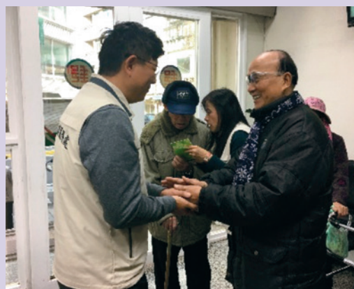
本處與郵局建立榮民防詐騙聯防工作。

社會形態改變、子女外出工作、形成雙老或獨老家庭，詐騙猖獗，榮民受騙案例時有所聞。為保護榮民（眷）財物安全，本處平日運用聯絡體系幹部與榮欣志工勤訪榮民（眷）說明防騙要訣，加強宣導防騙措施，並於領俸榮民退俸金發放時間，將服務延伸至郵局及金融單位，現場親切說明，並協助年長榮民辦理退俸入帳作業本處與榮民（眷）緊密互動、問候，無形間亦杜絕有心人士不法覬覦。