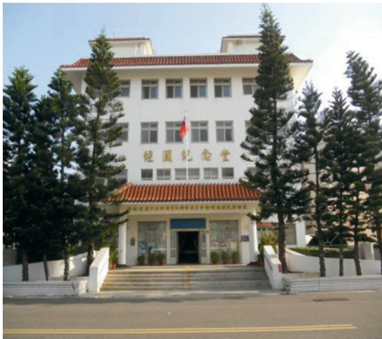
新建「榮民服務處」於民國80年落成。

山里經國路111號籌建「經國紀念館」暨「行政院國軍退除役官兵輔導委員會澎湖縣榮民服務處」，結合地方資源，提供舒適及便捷服務，贏得輔導會光榮形象與政府關懷榮民之德澤。102年11月，輔導會配合行政院組織改造，本處配合變更全銜為「國軍退除役官兵輔導委員會澎湖縣榮民服務處」。103年8月29日，承接國防部退除給付經費編列及發放業務，核心工作整合為服務照顧、就學、就業、就醫、就養及退除給付六大層面，提升服務之精度與廣度。