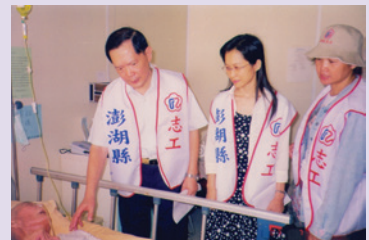
假日時探訪住院榮民 (93.7)。