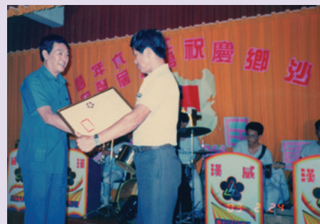
榮民節頒發績優服務人員（79.10）。