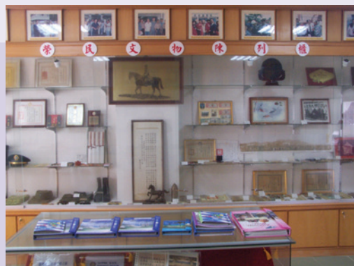
榮服處籌設榮民文物陳列館剪影。

為蒐集縣轄榮民（眷）暨單身亡故榮民具有紀念價值之典藏品及遺物，本處於民國92年11月間成立榮民文物陳列室，彙蒐陳列榮民紀念性文物、軍飾服裝、書籍、雅石等，以展現榮民個人豐功偉績暨歷史傳承見證。