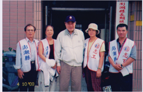
假日時偕榮欣志工探視榮民（92.4）。

二、民國92年間適逢SARS在各地蔓延肆虐，在輔導會防疫指導下，高副處長承擔起本縣防疫工作指揮官，立即成立「防疫應變小組」，對大陸探親返臺者居家隔離，散居榮民及集居榮民陸續編組防疫及消毒小組，並運用聯絡體系幹部偕同親訪榮民，宣導防疫事項，發放口罩、消毒用品提供應急之需，掌握榮民健康情形或提供生活必需品。另主動電洽輔導會，爭取專案經費，結合本縣各大醫療院所，建立防治聯絡網，及時陳報及掌握疫情，嚴格控管。此期間經常親率小組成員，分赴轄區內眷村、單身宿舍、榮民集居地或應榮民要求，展開全面性消毒作業，勞心勞力，犧牲奉獻，全力投入防SARS工作，其大無畏精神深植榮民（眷）心中，「凡走過必留痕跡」，防疫作為可圈可點。由於高副處長的躬親以身作則，為其有生之年留下美好而具挑戰性的回憶，不僅為公務部門建立優異執行績效，亦留給本縣榮民（眷）由衷感激與佩服；然因任務需要，高副處長於94年10月奉調金門縣榮服處副處長，延續服務照顧榮民（眷）工作，於民國98年7月16日退休。