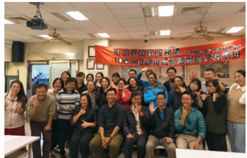
咖啡經營微型創業培訓班結訓典禮。