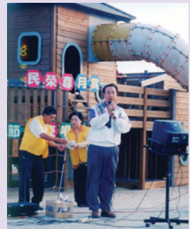
邀請單身榮民秋節聯誼 (89.9)。