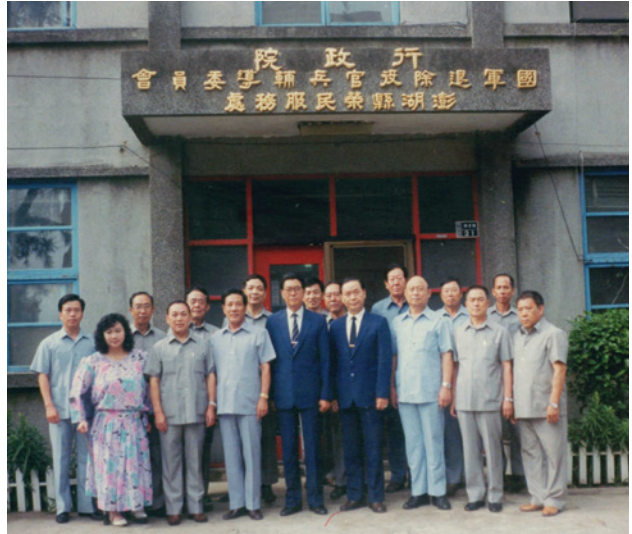
「榮民聯絡中心」原址。

「澎湖」一個星羅棋佈，由64個島嶼串連而成的海上明珠，是守護臺、金跳板，在地理位置上亟具軍事價值的島嶼。民國38年國軍隨政府播遷來臺，部分戍衛澎湖，當年青壯國軍袍澤多已習慣澎湖生活，落地生根，成家立業，輔導會有感當年捍衛疆土、為國盡忠，一生戎馬沙場的榮民先進，亟需政府關懷照顧，於51年8月16日於馬公市樹德路31號成立「榮民聯絡中心」。初期以辦理退除役官兵輔導就業與職業訓練為輔導措施，並參與澎湖地方建設、發展經濟；歷經多年，青壯榮民、子女紛紛踏入社會，榮服處為擴大服務照顧榮民（眷），強化榮民就醫、就養、就業、就學服務功能，80年5月15日輔導會與澎湖縣縣長歐堅壯先生協調爭取資源，於馬公市案