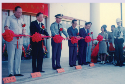
新建「榮民服務處」落成剪彩（80.9）。