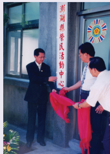
於聯絡中心舊址設置活動中心，服務榮民。

民國88年9月份由澎湖縣議會贊助經費，將舊址服務處整飭為「榮民活動中心」，提供榮民平日休閒場所，內部配佈棋桌、健身器材、報章雜誌、服務文宣等休閒用品提供娛樂。另設諮詢服務台，每日派遣輔導員負責收辦證件服務及榮欣志工輪值擔任服務工作，提供便捷申辦各項業務需要。