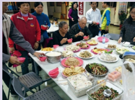
志工發起一人一道拿手菜，邀請年長榮民（眷）共享。

舉辦榮欣志工關懷榮民聯誼餐會，由榮欣志工主動發起一人一道拿手菜，邀請年長榮民（眷）一起用餐，話家常。美食佳餚伴隨著歌唱聲與談笑聲，聯誼會餐溫馨熱鬧，歡樂聲不斷，在寒冷的冬夜傳遞愛與溫暖。也希望藉此次活動拋磚引玉，讓更多熱心人士投入服務，幫助獨居榮民長者及遺眷，增加人際間互動，感受志工熱情關懷的溫度。