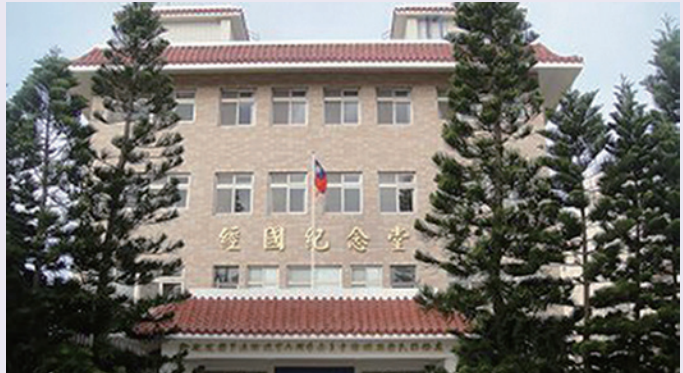
本處整修後之外觀（正面）。

自100年起，由輔導會挹注經費，陸續進行辦公大樓外觀整修、2樓大禮堂部分天花板更新、辦公廳舍冷氣機裝設、辦公室OA系統設施更新、檔案室移動式檔案櫃添置、電子看板（跑馬燈）等軟、硬體之設置。增強辦公廳舍環境安全，並增加業務宣傳、推廣之功能。