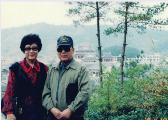
賢伉儷攝於橫店「清明上河圖」內（90.10）。