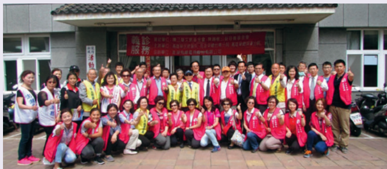
本處與高雄榮總義診團隊於龍行新城合影。

助場地安排及行程規劃等行政支援。輔導會所屬就醫和服務機構深入離島服務鄉親，深受好評。