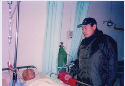
探訪住院榮民，視病如親（93.12）。