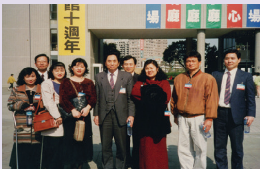
帶領榮欣聯誼會赴臺觀摩（86.11）。