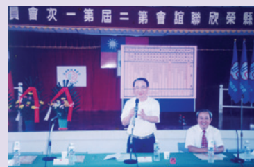
主持榮欣聯誼會第2次會員大會（93.9）。