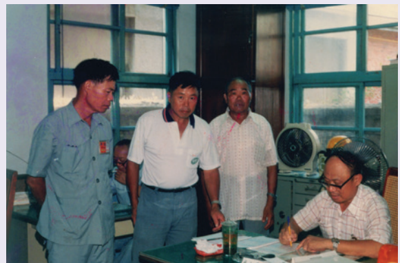
辦公室處理公務留念（78.8）。