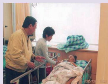
張處長關懷榮民病況與慰問。