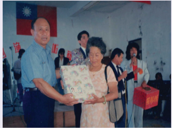
呂總幹事於榮民節活動頒獎剪影（78.9）。