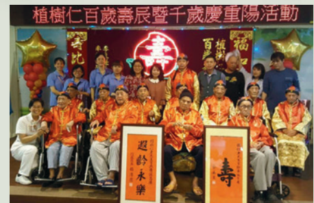
家主任（最後排右5）主持本家住民植樹仁伯伯百歲壽辰暨千歲慶重陽活動。