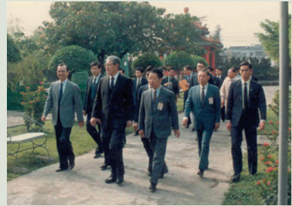
民國77年2月13日李前總統登輝先生蒞家訪慰榮民何主任（前排右1）引導參訪。