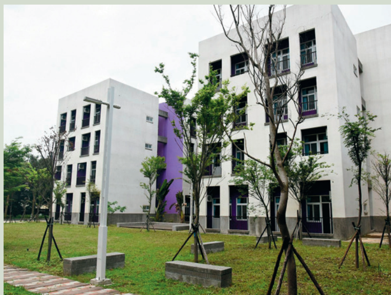
板橋榮家新建家區。