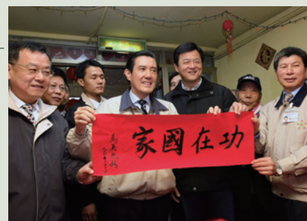
99年春節馬總統蒞家訪慰榮民。