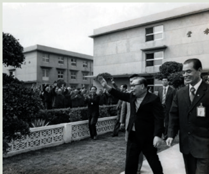
民國67年蔣故總統經國先生在忠孝堂前向榮民揮手致意。

蔣故總統經國先生於67年春節行政院院長任內蒞臨本榮家訪問榮民，李前總統登輝先生68年端節、69年春節，於臺北市長任內蒞家訪慰榮民，77年2月