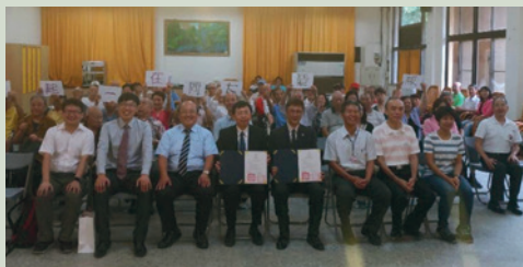
榮家住民（後排）與大同大學MOU簽約儀式合照。

為本家照護需求結合學術資源，發展「結盟產學合作夥伴關係」，創新全人照護服務模式及雙贏合作契機。107年6月11日板橋榮家與大同大學設計系MOU簽約儀式，也