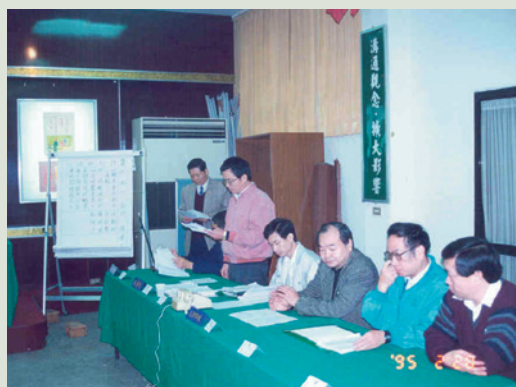
防災演習狀況演練（右立者）。