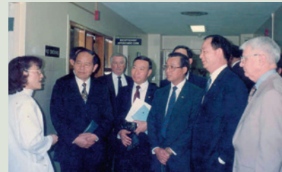
民國80年伍主任（左2）赴美訪問退伍軍人安養中心。