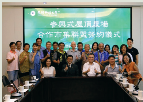
板橋榮家與致理科技大學MOU簽約儀式。

為讓本家長輩投入植栽，建置樂齡開心農場，經由融入、體驗、共鳴及分享園藝的活動，啟動家區長輩們的五官六感，覺察自然及發覺植物生命的美好與感動，讓參與者產生身體、心理及社會互動等三面向的健康促進，特別於107年8月21日與致理科大（學術知識）及復興里（在地力量）正式簽約，使我們能擁抱綠色療癒力，一起打造可食地景，共同打造高齡友善的樂齡生活。