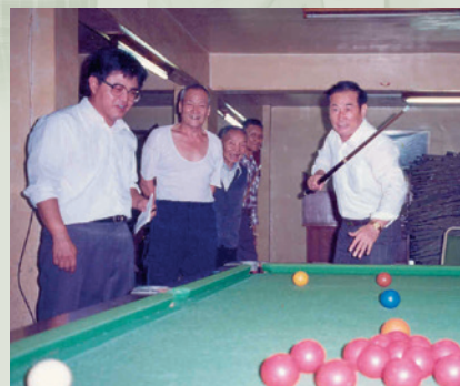
榮民節撞球比賽于主任示範表演。