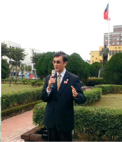
厲家主任於元旦升旗典禮致詞。