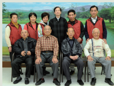
家主任與榮民伯伯話家常後合影。