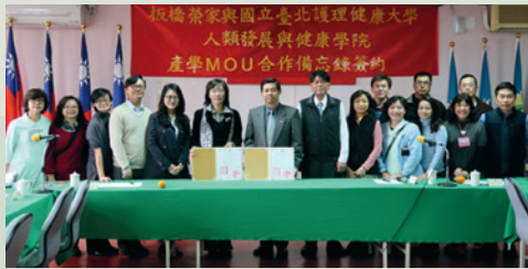
106年1月19日板橋榮家與國立臺北健康大學MOU簽約儀式。

為本家照護需求結合學術資源，發展「結盟產學合作夥伴關係」，創新全人照護服務模式及雙贏合作契機。106年1月19日板橋榮家與國立臺北健康大學人類發展與健康學院產學MOU簽約儀式，亦是外展服務工作的