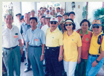
歐陽主任及夫人（前排左3、4）參與榮民自強活動。