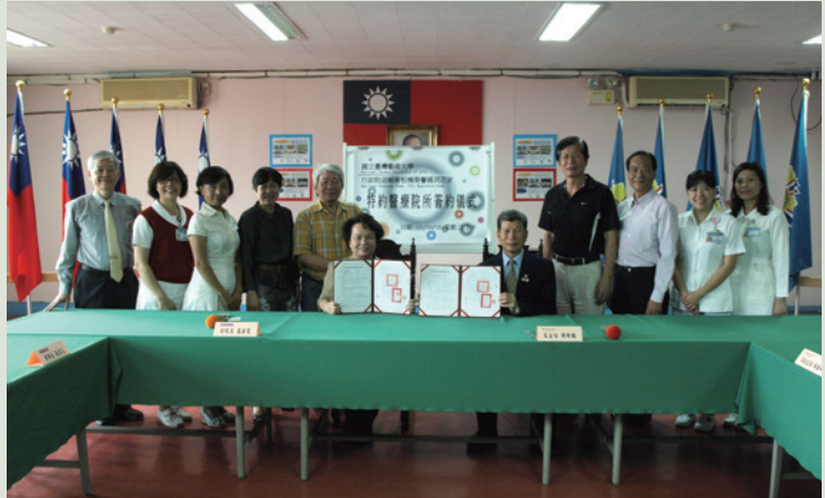
101年10月16日本家與國立臺灣藝術大學簽訂特約醫療院所協定。

101年10月16日與國立臺灣藝術大學正式簽訂特約醫療院所優惠協定書，提供該校師生優質之醫療服務，本家保健組為基層醫療院所，能與國立大學簽訂合作特約醫療院所優惠協定是本家成立數十年來的創舉，亦是外展服務工作的明顯成果。至今已服務該校師生數百人次，深獲師生好評。