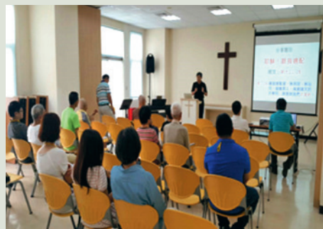
新建置共用之基督教堂與天主堂。