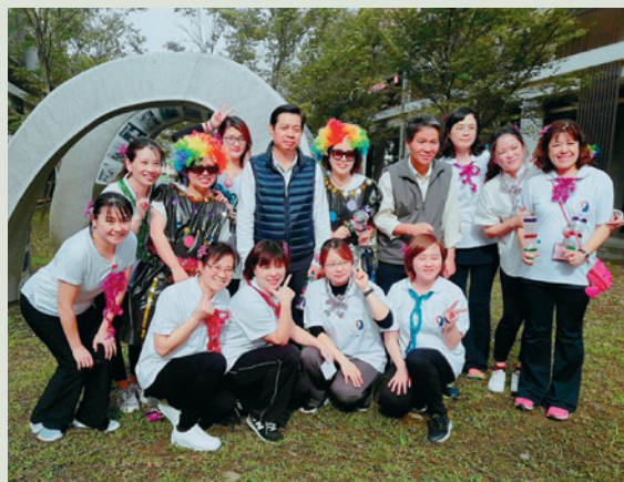
帶領組內同仁帶動唱娛樂住民。