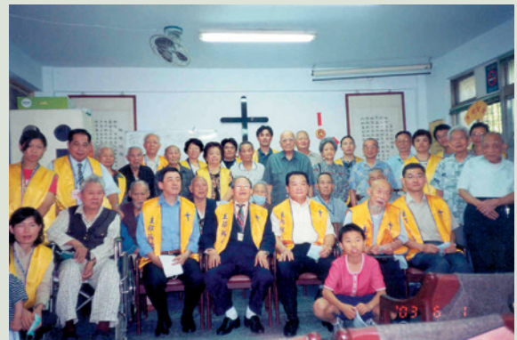
秦主任（前排右3）與榮民基督教友聚會活動。