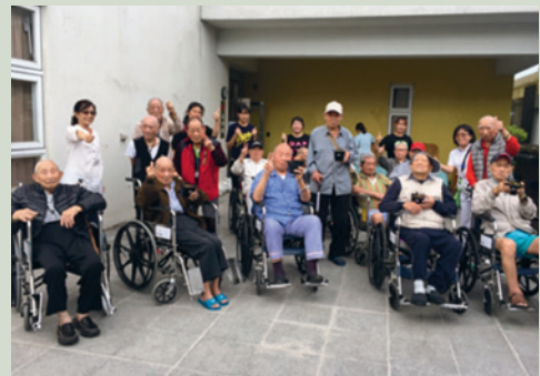
長樂農場讓住民透過種菜看見生命的希望。

費為主，主要在於實踐輔導會照顧經濟相對弱勢之榮民族群的理念。照顧內容除了生理滿足外，更強調心理、社會以及靈性的全人服務。照顧團隊除了醫師、護理師、社工師、復健師、營養師及照顧服務員等，也包含各宗教團體志工，更引介大專院校學生實習及服務學習方案，提供全面的服務，以達照顧理念。