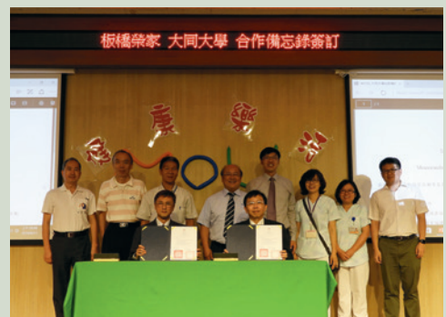
榮家屬以剛主任（前排左）與大同大學何明果校長（前排右）簽約MOU。