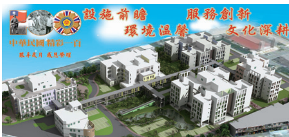
102年興建完成後家區鳥瞰圖。