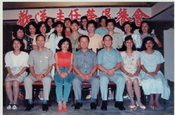
侯主任（前左2）退休時與員工合影。