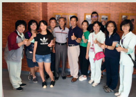
106年7月27日喜迎第1位一般民眾失智長者入住。