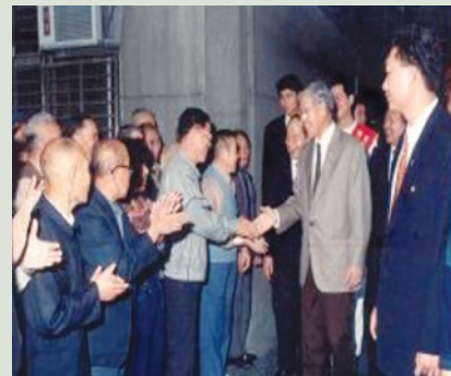
民國83年李前總統登輝先生蒞家訪慰榮民。

13日及83年11月25日以總統身份蒞家視導、垂詢，瞭解榮家對榮民服務照顧情形，連前副總統戰先生於87年2月4日蒞家訪慰榮民。