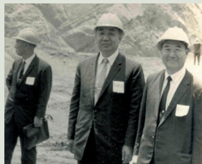
民國61年黃主任（中立者）督導榮家建家榮舍工程。