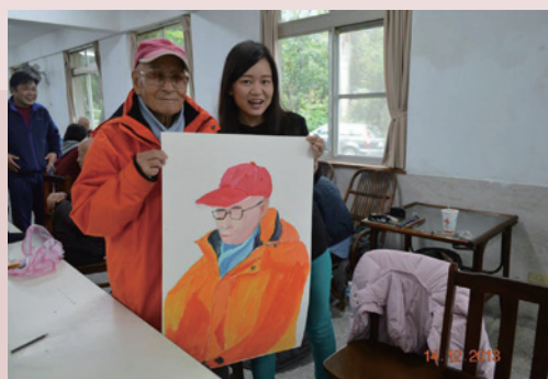
臺北藝術大學師生為義士們義畫。

臺北藝術大學的師生們經過與義士們的互動後，親自為每一位韓戰義士義畫，榮民伯伯們訴說著自己在韓戰中的艱辛，最後來到臺灣展開新的生活，帶著滿心歡喜參與活動，過程中充滿著愛、歡笑與祝福。