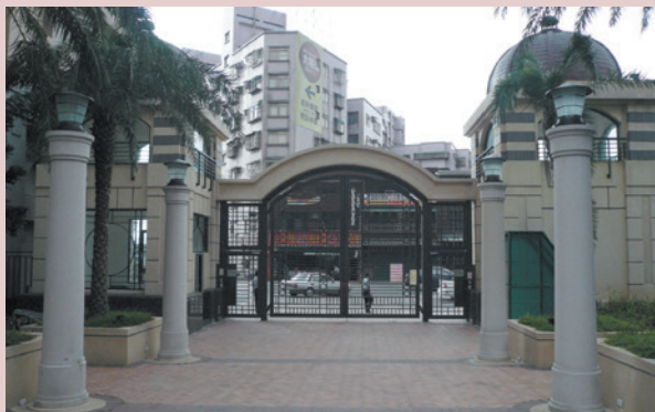
改建後之眷舍（更名為太陽城）大門。