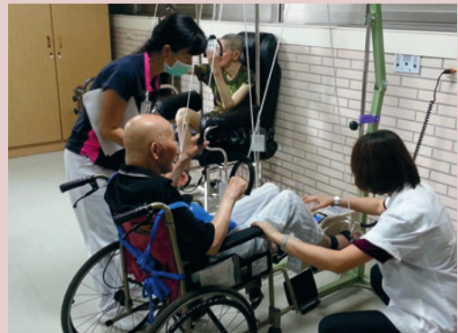
同仁醫院復健治療至本家駐診服務。

因應本家行動不便之榮民，外出復健不易，嗣經輔導會、相關醫療機構、專業團體及立委的協助下，引進同仁醫院復健資源至