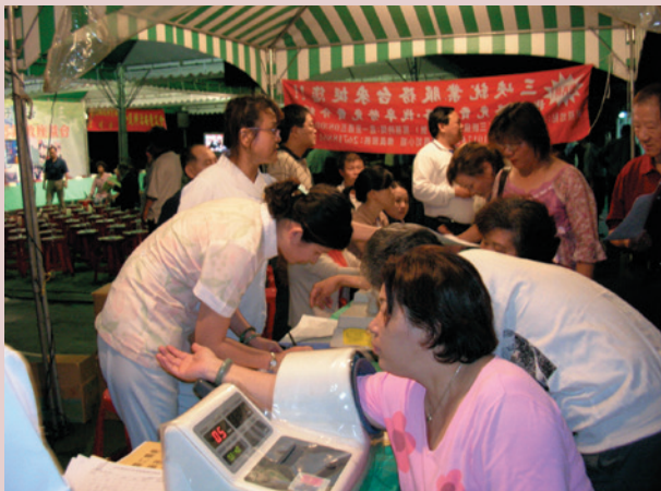
提供民眾健康諮詢、衛教宣導。