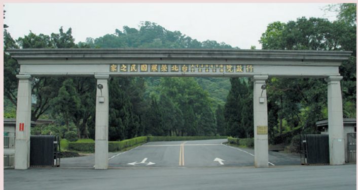
三峽白雞臺北榮家大門全景。