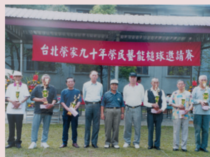
周主任（右5）頒發槌球賽優勝單位獎杯並合影。

任內完成養護榮舍一區工程，經行政院公共工程委員會評鑑，列為89年公共工程金質獎入圍單位，為本會爭光；另積極改善榮民生活設施，完成污水處理廠、衛生下水道、屋頂防熱板、新建槌球場等重大工程，績效卓著；91年1月16日退休，任期8年3個月。