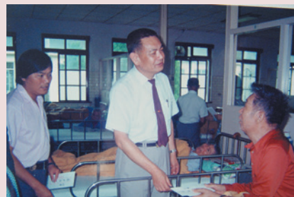
孫副主任（中立者）慰問住院榮民病患。

綜上所述，實可顯示他的為人處世，以及對榮家的貢獻，迄今仍令人懷念不已，在榮民的心目中，他不僅是副主任，也是他們真誠的朋友；談到服務榮民的心得，孫副主任指出，與榮民相處，沒有別的竅門，你只要付出愛心、耐心和誠心，經常的去關懷他、照顧他、尊重他，把他們當做是你的兄弟、長輩，則一切問題皆可迎刃而解，無往不利，定會達到團結和諧的境地。此外，在處理榮民問題的過程中，難免會碰到一些棘手的問題，心理上或多或少總會受到些影響，但是，你千萬不要灰心，下定決心，大公無私，全心全意，定會克服困難，圓滿達成任務。