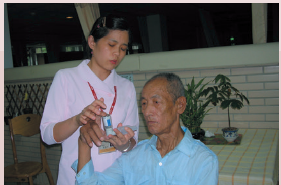
衛教師教導榮民定量吸入器之使用。

本榮家除關心榮民身心狀況，亦十分重視社區民眾之健康，乃擴大社區服務，與三峽鎮衛生所合作，辦理社區整合式健康篩檢、大腸癌篩檢，並參與社區活動，如臺北縣2007年三峽藍染節、龍舟錦標賽與綠茶、綠竹筍文化季等活動，提供民眾健康諮詢、衛教宣導，深獲民眾好評。