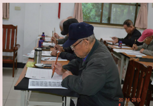
松年大學書法班榮民伯伯們聚精會神的練習書法字。