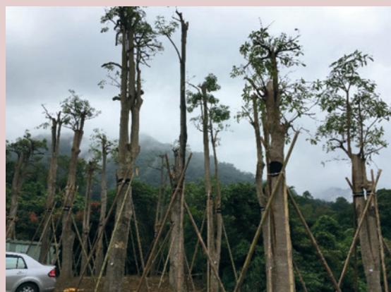
臺北捷運局南區工程處移植本家樹木實景。

107年3月由臺北市捷運局南區工程處至本家進行第一期移植6棵茄苳樹，107年9月12日第二期陸續移植江某、香楠等42種樹木，總計531株，植株面積達8,000平方米，另於植栽主要地點舊養鹿場規劃簡易公園，將增加榮民與員工休憩空間。