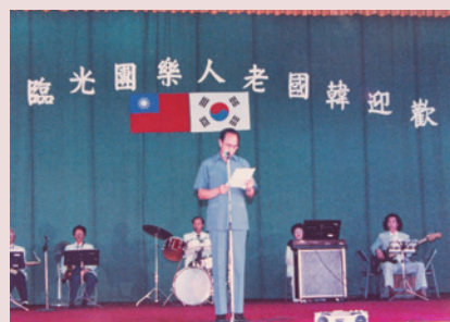
范主任（中立者）介紹韓國老人樂團蒞家演出致詞。

任內不斷改善供水設施，引接山泉，使水源充裕，千餘員工義士飲用無虞，另修建河堤北岸行人登山階梯及扶手，以方便義士登山散步，由於中心員工均外住臺北、板橋、桃園等地區，每日派交通車接送上、下班；為強化義士身體，構置復健器材計按摩機等20餘種，分於保健組及第四區設置，以利理療；另為尊重民俗，除建立榮靈祠外，並於每一輔導區設置佛堂1座，奉祀義士宗親神位，另於第四輔導區設置宗教活動中心，充實義士精神生活，使心靈有所慰藉；77年10月1日退休，任期5年1個月。