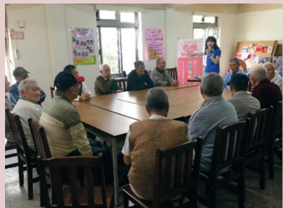
本家社區關懷據點健康促進與珍愛生命課程。

檢討運用本家現有空間，分階段規劃恢復原社區關懷據點功能、完善服務照顧並對外開放，以據點為橋樑，增加社會參與機會、健全社區福利服務照顧網絡，增進資源交流，並使高齡長輩健康、樂活。