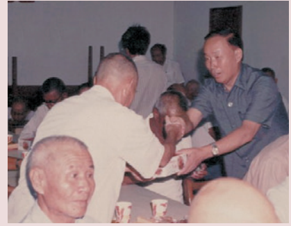
黃主任（右立者）主持慶生會並致贈榮民生日禮品。

任內為美化環境，於北家區內修建方角亭一座，南家區內自由人像附近增建水泥鋼筋花架一座，另培植一串紅、萬壽菊等花卉，以陶冶義士生活情趣；為有效利用農地，避免荒蕪，以達地盡其用，種植木瓜1萬餘棵，並鼓勵各堂自行種植蔬菜，由中心派人技術指導，能有效改善義士生活；79年2月1日調任花蓮榮家主任，任期6個半月。