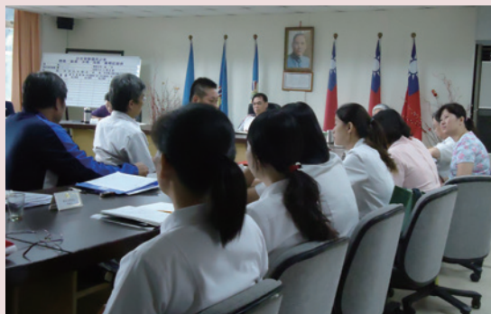
每週召開服務品質管制會議，研討實質內容及制定標準作業流程。