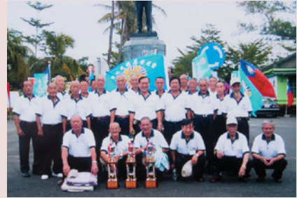
林主任（2排右4）與參加藝能競賽榮民合影。

任內除接受輔導會3年1次的評鑑外，並完成失智榮民養護專區的規劃及建設，為配合失智專區成立，先後完成監視系統工程、大門圍牆整修、房舍加設欄杆、鋪設止滑磚、水溝加蓋、坡度減緩、加裝遮雨棚、餐桌椅及會議室桌椅採購等；又奉輔導會指示，於95年10月，將榮靈祠骨灰罈1,094罈，順利遷厝至臺東縣軍人公墓；為建立榮家品質管理系統，自94年11月起，委託民間企管顧問公司，實施為期3個半月之ISO 9001榮民安養照顧及醫療救護服務之輔導訓練，95年2月16日通過國際品質認證，獲頒正式證書；任期內先後完成美國、韓國等國家外賓蒞家參訪接待任務，對敦睦邦誼，具有貢獻；95年7月15日退休，任期1年。