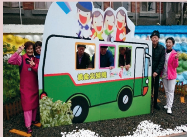
失智區懷舊時光隧道。

本家於失智區建置懷舊時光隧道，藉由懷舊看板及圖片，喚起失智榮民記憶，穩定情緒，隨時提供陪伴關懷，使忘我榮民參與活動，重拾自信，減緩退化、享受歡樂。