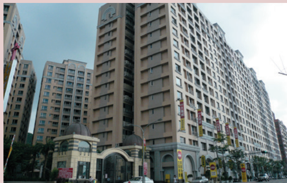
改建後之眷舍（更名為太陽城）外觀。