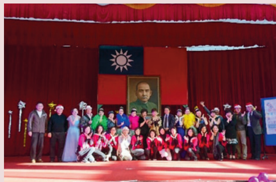
中正堂耐震補強工程竣工後，幸福久久姊妹會蒞家舉辦表演活動。

106年6月1日本家中正紀念堂耐震補強工程以650萬元決標，並於該年6月30日開工，10月3日竣工。此外，本家積極爭取並獲得輔導會專款補助辦理「中正堂地板及舞台地毯汰換」工程，於106年7月竣工，使中正堂煥然一新，提供住民及社區民眾安全舒適與多功能互動之活動中心。