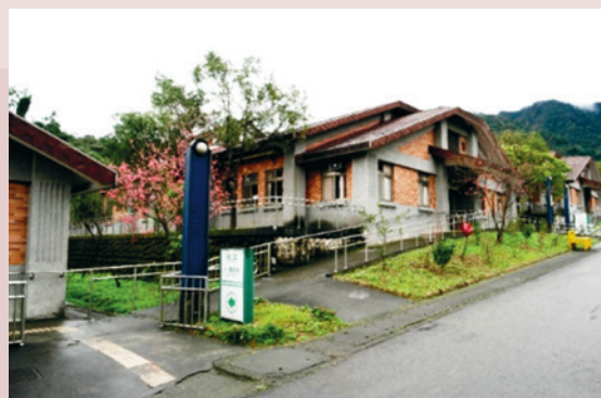
養護二區2、3棟長照專區整建工程建物外觀。

依核定預算1,911萬元辦理養護二區2、3棟長照專區整建，於106年6月1日決標，6月30日開工，107年1月10日竣工。規劃每幢床位數為27床（4人房3間、2人房7間、單人自主健康管理室1間），可提供符合長照機構設立標準之養護床位計54床。