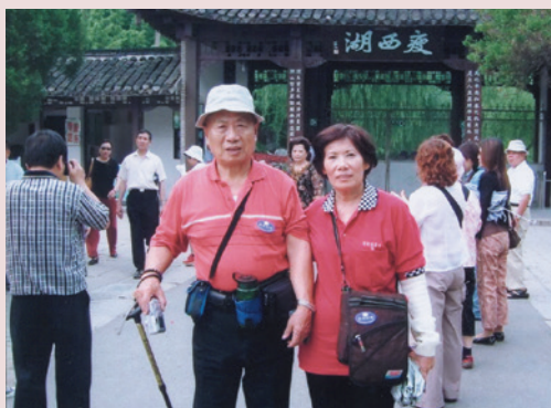
葉主任夫婦旅遊合影。

86年7月1日退休後，為不閒散無事，曾任大樓管理員及鶯歌高職警衛工作，70歲起才未工作，每週登山健行2~3次，最具代表性的一次是94年10月22日，以74高齡登上玉山主峰，目前生活悠閒，身體健康，家庭和樂幸福。