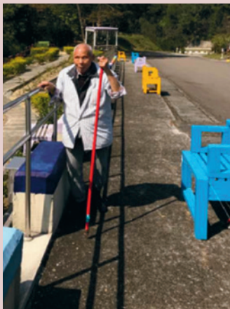
友善愛盲服務設施。

本家於養護二區1棟成立愛盲視障專區，引進愛盲發展中心定向師，協助盲胞一對一訓練，並增設友善觸覺標示及愛盲步道，藉由視障長者觸覺敏感度，增加定向感與肌力訓練。