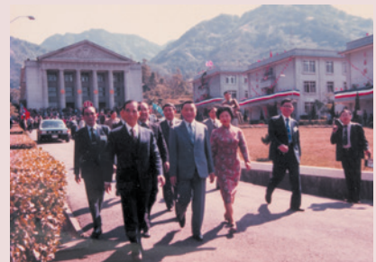
鄭主任（右4）陪同鄭前主任委員為元巡視中心。