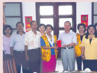
張主任（右4）接待民意代表蒞家慰問並賀佳節。

任內致力於改善榮民生活設施，如：增建榮舍殘障電梯、文康中心及家史館裝修、建立餐廳殘障坡道、榮舍生活設施改善、完成養護二區工程，闢建正義公園，舉辦「一二三自由日五十週年」慶祝活動，帶領義士返韓懷舊之旅，將伙食改成自助餐式供應等，績效卓著；94年7月16日奉調白河榮家主任，任期3年6個月。