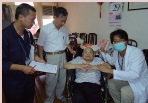
新進住民入住前做家庭訪問。

新進住民入住前，均由社工及醫護人員先期家訪，除評估入住類別（安養、養護、失智）並溝通入住後照顧（護）作法，與家屬簽訂「有眷榮民進住協同照護須知」建立照顧共識，協議照護作法。