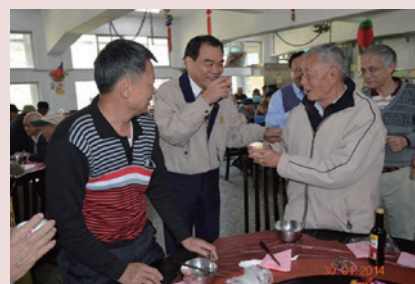
熊主任（中立者）除夕與榮民圍爐吃年夜飯。

然榮家之經營非僅止於文康、療護的規劃，更須投諸硬體設施的營建，任內致力改善榮民生活設施，針對榮家之評鑑缺失，規劃103-106年家區整體設施整修（建）案，俾使此規模宏偉、歷史悠久的榮家，塑造成為本會優質服務、永續經營的標竿；任期4年，106年7月16日退休。