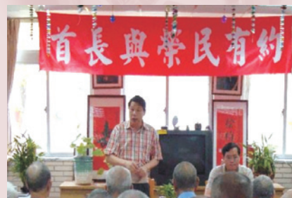
秦主任主持首長與榮民有約。

秦主任重視榮民生活，到任後，即積極開拓水資源運用，將淤積停用之過濾池、蓄水槽等重新整理啟用，另建構深水井乙座，除可有效解決枯水期用水不足問題，並可節約公帑。為貫徹政府「節能減碳」政策，除製訂有效的節能措施，要求各級貫徹執行外，另於各種集會時間反覆宣導，以使榮民員工均能深切體會及實施。