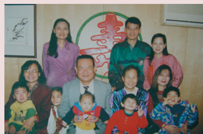
孫副主任（前排左2）全家福合照。