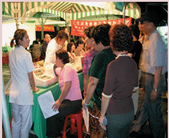
關心民眾健康由協助量血壓開始。