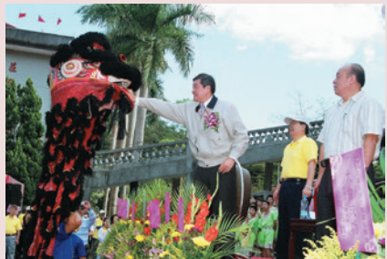
高前主任委員華柱主持民國95年北區榮民才藝嘉年華會文康表演活動。

任內完成本榮家土城「榮胞新村」與土城市公所之合建，原眷戶130戶各分配1戶30坪公寓，澈底改善其生活環境品質；97年1月16日退休，任期1年6個月。