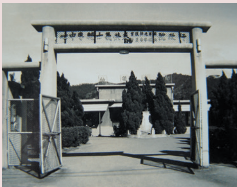
桃園虎頭山反共義士輔導中心大門全景。

83年8月31日輔導會輔人字第15440號函頒榮譽國民之家組織規程及編制表一「行政院國軍退除役官兵輔導委員會臺北榮譽國民之家」自83年9月1日正式成立。102年11月1日行政院組織改造，更名為「國軍退除役官兵輔導委員會臺北榮譽國民之家」，組織編制亦隨之調整為輔導組、保健組、秘書室、人事室、主計室、政風室。