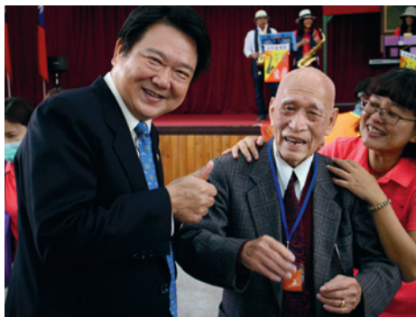
董主任（左1）與榮民親切互動。