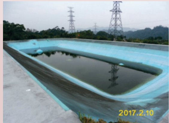
臺北榮家山泉水蓄水池。

本家山泉水蓄水池第3池（蓄水量7000公噸），因池底防水膜破損，致無法蓄水，獲輔導會專款補助辦理整修，總工程費390萬元，於106年1月25日開工，5月22日竣工。完工後恢復蓄水，可供25天家區清潔用水使用，有效摺節用水成本支出。