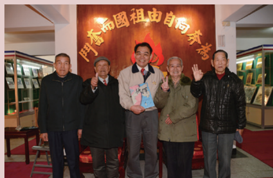
熊主任（中）展示紀念韓戰反共義士返臺60週年紀念專書「抉擇」。

韓戰反共義士返臺60週年紀念，熊主任特別發起舉辦慶祝活動，編輯紀念專冊「抉擇」。臺北市立景美女中儀隊、樂旗隊由校長親自帶隊到臺北榮家，以壯盛與整齊的陣容表演，臺北藝術大學師生也用畫筆為反共義士繪製了60多幅肖像，他們共同向1954年回臺的反共義士們致敬。