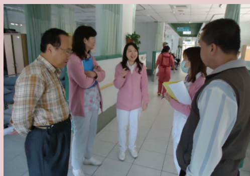
每日上午實施巡堂，瞭解堂隊狀況及需求。

依據自主檢查表，每日上午由輔導組組長、保健組組長、堂長，實施巡堂，瞭解堂隊服務人員與榮民之間互動狀況及需求。每月召開跨專業整合會議或個案討論會，針對特需個案專案輔導或提供各別化照顧（護）服務以改善其身心狀況。