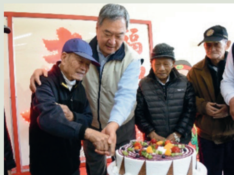
徐主任與住民共度慶生會。

徐主任民國41年9月18日出生，陸軍官校專修班58年班畢業，服務軍旅期間擔任營、旅長等重要軍職，84年國軍上校以上軍官外職停役轉任公務人員檢覈及格，至輔導會服務期間先後任馬蘭、桃園榮家、訓練中心人事室主任、臺東農場副場長、臺中縣榮服處副處長、佳里榮家副主任、基隆市榮服處處長等職務，於105年1月18日調任本榮家主任，107年1月16日退休。重要政績：