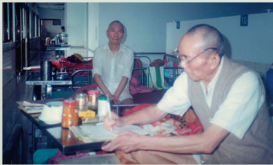
整修後養護堂之病房新貌。

本榮家於民國79年10月成立養護堂，養護床位84床。87年整建房舍，增加為102床，為增加養護榮民活動空間，規劃完成中庭設計，佈置並種植各類花草植物，提供養護榮民每日健身活動、休閒娛樂及辦理各項大型聯誼活動使用。92年又擴增為目前之130床，使本榮家養護服務更為周全。在歷任首長的支持及所有工作同仁的努力下，本榮家盡心盡力提供輕、中度失能榮民養護照顧服務。並於91年12月28日完成養護堂「護士呼叫及監視系統」，以加強養護榮民安全管理，提升照護品質。