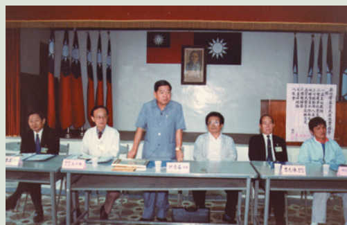
民國80年石主任（中立者）主持榮民座談會。