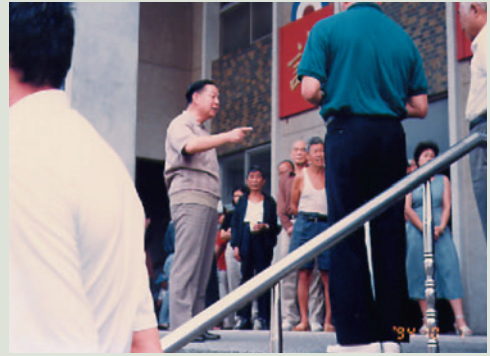
民國83年沈主任（中立者）主持消防演練。