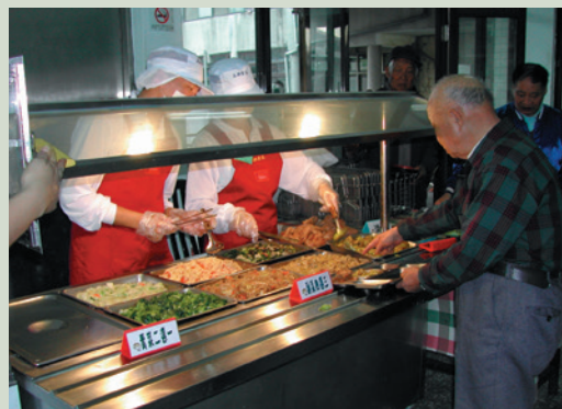
自助餐供餐時榮民自由選擇菜色情形。

早期為聯繫榮民袍澤如同家人的感情，用餐方式採用傳統桌餐，然而隨著年歲增長及衛生考量，老人不適宜再以桌餐方式用餐，本家排除萬難配合輔導會政策，於民國93年8月起改以自助餐方式用餐，菜餚均採8菜自選5菜，榮民在用餐的時候，可以自由選擇葷菜或素菜及自己喜愛的菜餚，打破以往單調的用餐方式，並能充份滿足榮民用餐的需求。