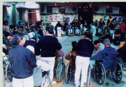
慈濟志工來家舉辦團康活動。