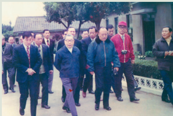
民國69年11月蔣故總統經國先生蒞臨訪慰榮民，王主任（右前3）引導陪同。