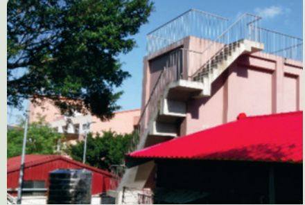
新建儲水槽改善家區供水問題。

本榮家辦理「家區儲水槽整修暨新建工程」（項目：地下水沉砂池及氧化池整修、自來水儲水槽整修及新建地下水塔），總計金額新台幣467萬8,000元，於104年6月5日開工，並於105年1月15日竣工，2月5日驗收合格，5月25日取得使用執照，具體改善家區儲水設施，提升水資源管理成效。