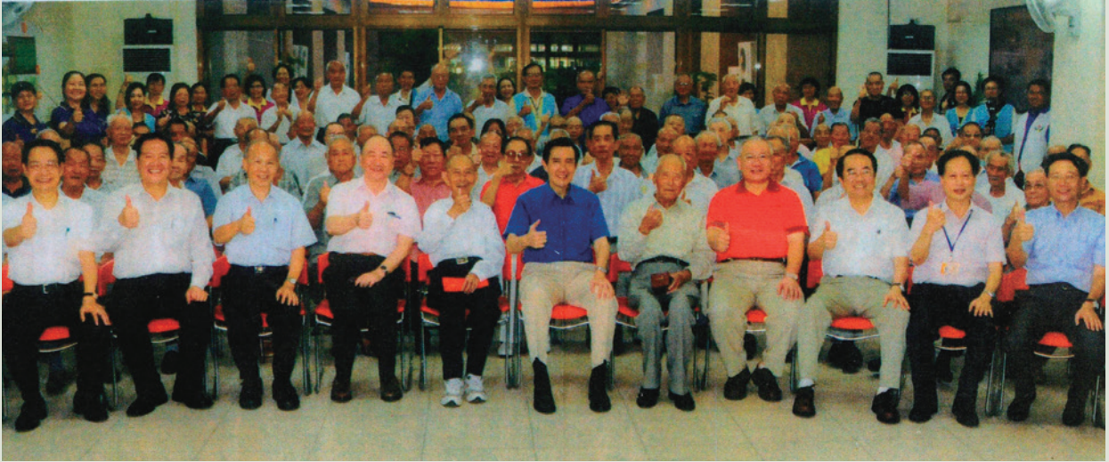
民國101年7月14日馬總統英九先生（中間）蒞家巡視與榮民大合照。