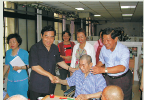
94年安養評鑑張主任（右1）陪同評鑑委員實況訪問。