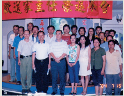
歡送韓主任（左前3）榮退茶會。