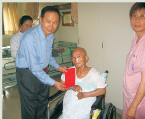
陳主任於端節前慰問住榮民並致贈慰問金。