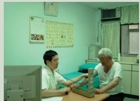
保健組醫師為榮民看診情形。

本榮家針對罹患憂鬱、失眠等症狀之榮民，於民國95年初採取最新光療機照射設備，使用照射治療法減緩榮民憂鬱、失眠等症狀，為輔導會安養機構之首創，迄今施作已超過40餘例，經評估監測，執行成效良好，深獲榮民好評。本榮家現有內科、眼科、精神科、復健科等四科門診醫療服務；其中精神科係由竹東榮民醫院精神科醫師定期來家開設門診，復健科與新竹市和平醫院簽訂支援協定為榮民實施復健治療，所有門診皆對內外住榮民及社區民眾提供醫療服務，並配合榮服處及新竹市曲溪里辦理相關醫療外展服務工作，以落實輔導會醫療外展服務政策。