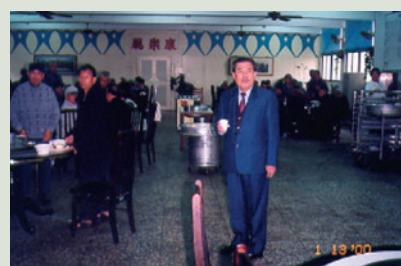
韓主任（右立者）主持榮民餐會。