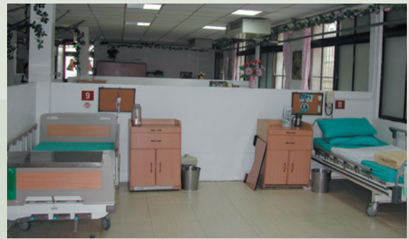
舊有之養護堂病房原貌。