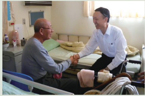
雷主任訪視養護堂榮民。