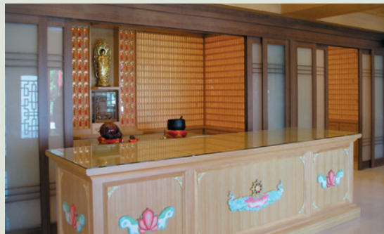
整建後莊嚴寬敞之榮靈祠