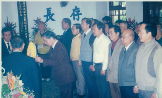
舊有之家祠公祭情形。