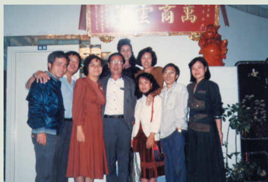
袁主任（左4）離職後與員工相聚。