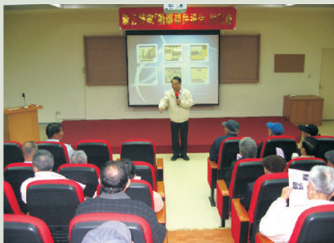
林主任主持勸導返家內住說明會。