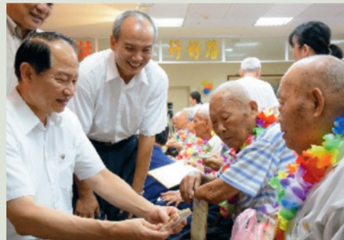
林主任陪同主委頒抗戰勝利紀念章給榮民。