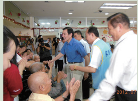
101年7月14日馬總統英九先生至養護堂關懷榮民。

民國101年07月14日馬總統英九先生蒞臨本家視察，慰問安養護住民，致贈百歲人瑞馮振星及模範榮民胡壽宏賀禮，並諭示：政府在「崇功報勳」的政策指導原則下，為使一生戎馬之榮民，在晚年孤苦無依時，有更良好的安養護生活品質，以回報榮民半生戎馬貢獻心力，政府必須持續不變支持照顧榮民。