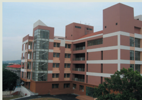
中正紀念堂拆除改建成安養大樓。