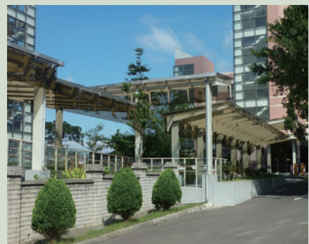
嵩德樓至嵩瑞樓間風雨走廊。

曾前主任委員金陵先生蒞家訪視榮民，體恤本榮家榮民於天雨時，影響行走安全及活動空間減少，提出建置風雨走廊，於100年9月1日開工，100年12月31日完成含嵩瑞樓大門風除室及嵩陽樓三樓陽臺遮雨工程驗收啟用，造福榮民。