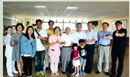
一般民眾快樂自費入住。

106年2月15日擴大資源共享-開放一般民眾自費入住，開放安養30床（安養一堂五樓），提供65歲以上生活自理一般民眾申請進住。