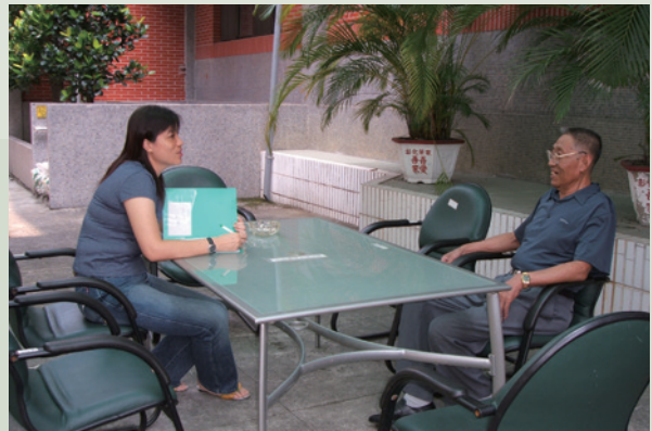
員工對榮民實施訪談，傾聽榮民心聲。