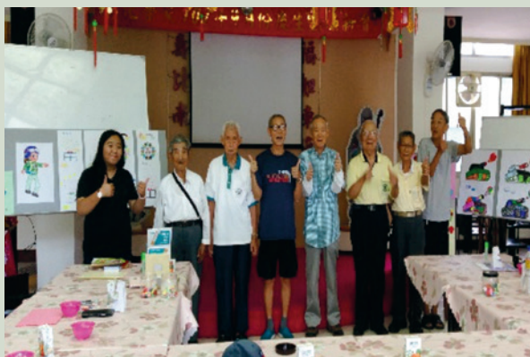
參與藝術療癒住民歡喜比「讚」！

為提供長者心理支持與健康的休閒生活，辦理「藝術療癒」團體，讓長者透過藝術創作活動，說出自己的想望、表達心情與擔憂，適時紓壓、解決困擾。每次活動都設計不同的主題，例如：畫我的願望、紙印畫、天燈祝福卡片等，塗鴉創作自己喜歡的作品，並藉由領導者與同儕給予回饋，獲得正向鼓勵與成就感。