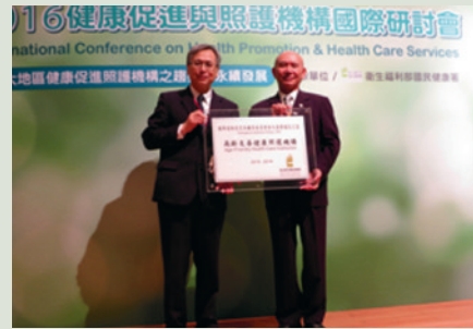
105年11月27日獲衛生福利部國民健康署授頒「高齡友善健康照護機構認證」證書。

另成立「彰榮樂活藝工隊」，散撥歡笑、散播愛，活化榮民展現才藝的自信心，增進自我價值及效能，豐富生命經驗。106年12月14日成立「社區照顧關懷據點」，與社區居民資源共享。