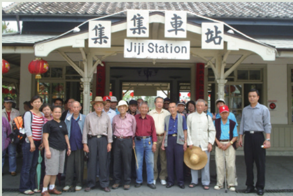
員工陪同訪談榮民參加集集懷舊知性之旅。

多年來本榮家全體員工秉持一貫之服務精神，全心全力投入份內工作，為榮民提供各項服務，諸如：定期辦理自強活動、慶生會、康樂活動、球類聯誼及宗教活動等，自民國88年10月起為加強對榮民服務照顧，實施全面認養訪談，全體員工編組訪談榮民，建立彼此融洽關係，並將悲觀厭世榮民列為特需照顧對象，每日由服務人員訪慰；另對住院榮民，每月排定首長、各組室主管、堂隊長分赴各醫院探視關懷。