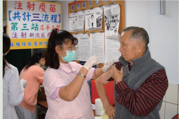
護理人員幫助榮民伯伯注射流感疫苗。