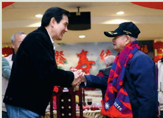
馬前總統致贈紀念圍巾予李奮香伯伯。

適逢抗日勝利70周年，馬前總統英九先生於民國104年1月24日，蒞臨本榮家探視榮民，並致贈加菜金提早過春節，推崇榮民功在國家、關懷社會，走過許多戰火，為捍衛中華民國貢獻一生。總統和200多名榮民共進午餐外，並頒發善心義舉獎狀、紀念手錶、敬老紅包、紀念圍巾，現場充滿濃濃的年節歡慶氣氛。