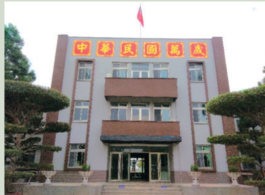
行政大樓完工後照片。