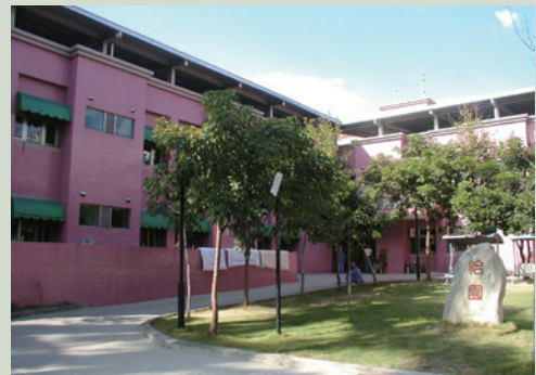
美輪美奐設備新穎之「怡園」，提供失智榮民舒適之頤養環境。

為使中度以上失智榮民能有更妥善之服務照顧，本榮家於民國89年10月設置「怡園」計100床，除安置失智榮民外，更收容各榮家、榮服處轉介之失智榮民，以落實服務照顧，94年12月完成失能榮民照顧專區，計144床，由本榮家及委外照顧服務員採1：5人力照料失能榮民日常生活起居及職能活動等等。