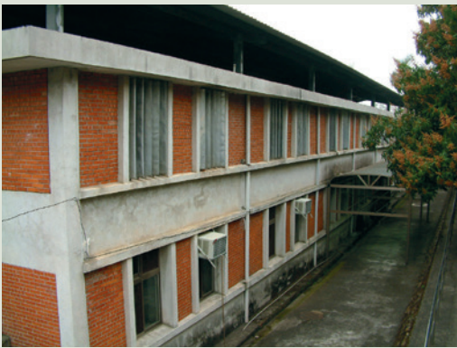
民國62年榮家甫成立時所建之榮民房舍。

本榮家前身為嘉義榮民醫院田中分院（隸屬行政院國軍退除役官兵輔導委員會），原以收療肺結核病患為主，後來由於醫藥發達，結核病患逐漸減少，乃於民國61年8月迄62年10月代管臺北市第一榮民之家榮民，迨62年11月1日奉准改制為彰化榮譽國民之家，隸屬於臺灣省政府。