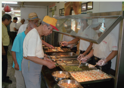
榮民依序排隊挑選自己喜歡吃的菜。

本榮家自民國90年起將榮民伙食採行委外辦理方式經營，三餐均把握「質精量足」、「營養衛生」及「熱食供應」之原則，每日菜單由承商營養師調配設計，再經本家伙食委員會討論通過並公布，每季辦理問卷調查，以瞭解榮民之需求，另自94年起全面採取自助餐方式供餐，午、晚餐6菜自選4菜，並有飯、麵食及水果等多樣化供榮民選擇。