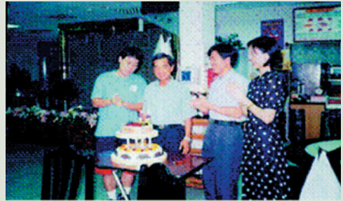
吳先生（左2）歡度60歲生日，同仁為其慶生。

他的勇於任事，熱心公益的態度，待人處事與認真學習的精神，更是我們學習的榜樣，他常秉持著一顆熱忱的心，去幫助他人，從不要求回報，他時時帶著滿臉的微笑去接近眾人，他更三不五時的主動捐獻，尤其自辦公室全面推動自動化時更是憑著毅力靠「一指神功」來操作電腦，從生疏的注音符號一字一字敲打到一分鐘高達30個字的境界，這些都是他努力的成果，戲曲總有結束停止的時候，人生的舞臺亦有下臺的時刻，92年7月16日以年滿60歲，且在榮家服務屆滿35年資歷的他，毅然跳脫公務員的生涯，又再度回歸接近大自然務農的日子，他的離開雖是本榮家的一項損失，但何嘗不是社會另一大收穫呢？「豬爸爸」我們永遠懷念著您！