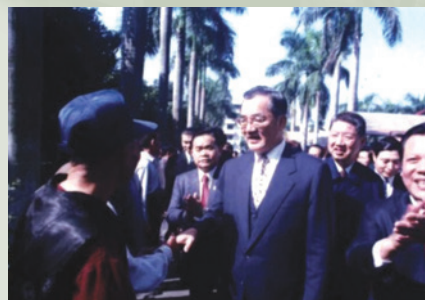
民國84年連前副總統戰蒞臨訪視，歐陽主任（左1繫紅領帶）陪同。

84年連前副總統戰先生蒞臨本榮家訪視，對歐陽主任在本榮家之用心付出予以肯定讚許。歐陽主任對榮民周全的照顧，亦深獲榮民之愛戴。