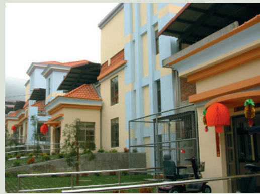
民國94年完成第1期修建之養護堂榮舍。

70年7月1日正式改隸行政院國軍退除役官兵輔導委員會管轄，定名「行政院國軍退除役官兵輔導委員會彰化榮譽國民之家」，主要任務為安置因戰（公）傷殘或年老無依之退除役官兵。