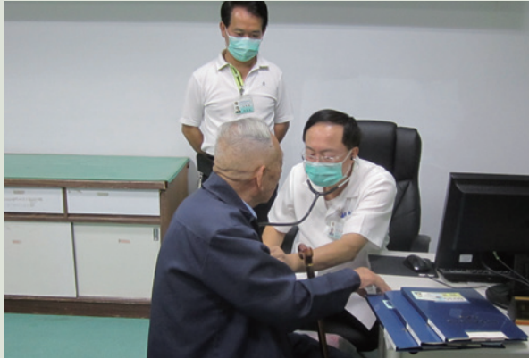
桑醫師耐心為榮民看診。