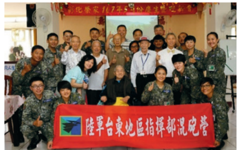
陸軍臺東地區指揮部混合砲兵營官兵利用基地訓練空暇時間，至本家進行長者生命回顧。