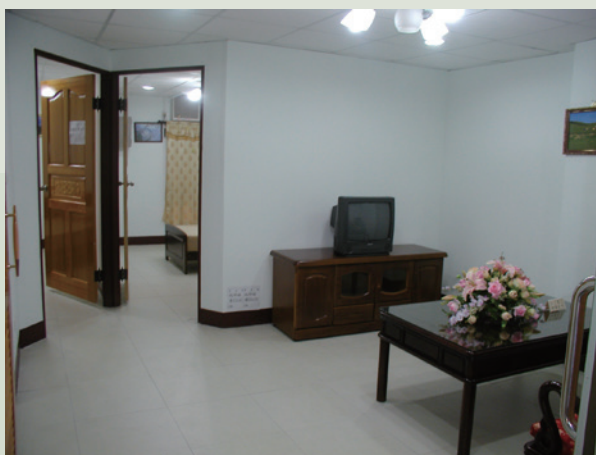
民國95年新修建完成之安養堂內部陳設一隅。

本榮家為提升榮民生活品質，並營造溫馨祥和有尊嚴的頤養環境，每年均編列預算，逐次改善及充實房舍建築及設施（備），歷年來完成興建榮民房舍、保健大樓、失智榮舍及天然氣埋設管線等重大工程，自民國94年起執行家區環境總體營造中程計畫工程，依施政計畫區分3個年度3期推動，持續改善榮民居住之環境及品質，工程於96年10月15日全面完工，本榮家闢建為安養、養護、醫療、景觀等4個專區，容納580床（失智100、失能144、安養336）。