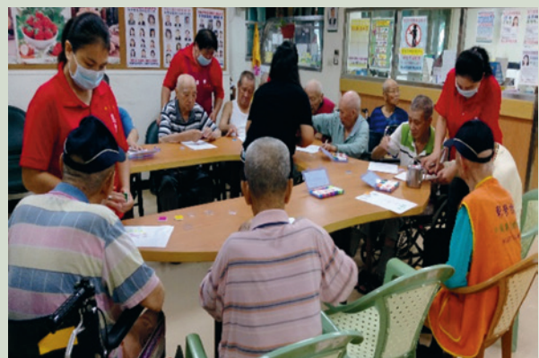
住民塗鴉創作自己喜歡的作品。