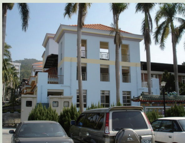
民國94年新修建完成之養護堂外觀。