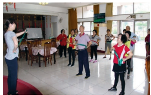
衛生福利部彰化醫院物理治療師教導社區長者及住民體適能活動。