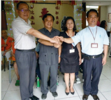
民國104年與地區醫院簽定醫療協議記者會。

本家為使住民獲得良好的醫療照顧，與鄰近衛福部彰化醫院、宏仁、員榮、員生、東華、卓醫院、聯明醫事檢驗所等簽訂醫療協議，共同維護榮民健康。公立機構現況無復健醫師及物理治療師編制，榮民復健均由周邊宏仁、員榮、東華、建元等地區醫院支援派車免費接送需