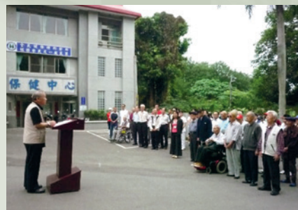
家主任主持榮家組改揭牌儀式後對榮民、員工訓勉。

黃主任到任後戮力從公，以榮家為家，每晚訪慰榮民，傾聽心聲，協助解決問題。為精進伙食及提升用膳環境、品質，於102年11月參訪桃園榮家觀摩學習，另不定期召集廚師研討，使榮民享受營養、健康、多樣性、家鄉味菜餚，並於104年農曆年前啟用新餐廳，提供優質膳食供應。為提升榮民照護品質，並依評鑑指標逐項增修設備、醫療、榮舍，同步綠美化榮家環境成為一座花海，讓榮民休憩、生活在大自然環境中，營造「溫馨、祥和、有尊嚴的頤養環境」。