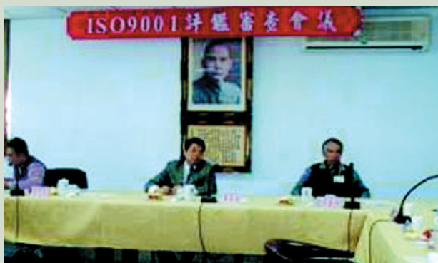
民國95年2月17日ISO 9001首次審核評鑑會議。

本榮家自民國94年10月開始規劃輔導、認證，並於95年2月17日進行首次評鑑，同年3月1日正式通過英國UKAS認證審核，並核發「彰化榮民之家安養照顧及醫療救護服務」ISO 9001正式認證證書。