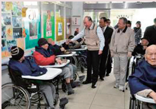
曾主任委員來家探視自費養護住民。

83年3月1日以「部分供給制」方式開辦支領退休俸榮民，自費養護的服務，初期於忠孝堂舊有榮舍改建192床養護床位，87年9月配合行政院「擴大內需方案」於仁愛堂榮舍及舊保健組現址規劃新建3棟3層（400床）身心障礙榮舍，一切生活設施，空間規劃均依老人福利法規定建置並以老人安全與身心障礙者便捷舒適為首要考量。