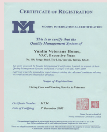
ISO 9001國際品質管理認證證書

持續精進環境設施改善與照顧服務，榮獲衛生福利部國民健康署高齡友善健康照護機構認證。