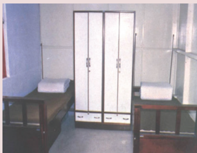
舊榮舍榮民寢室內部景況。