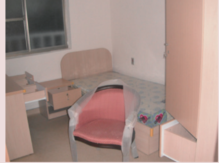
和平堂房舍內部設施。

為精神。設施使用與操作簡單、易於維護為原則。重要地點與緊急救護出入口及動線，設有監控設備及辨別設計。