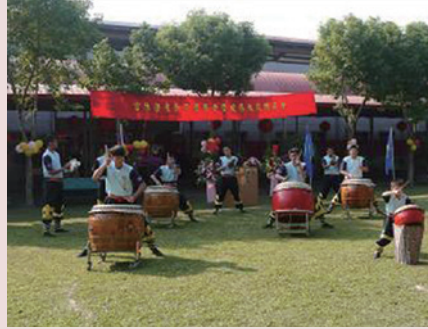
和平堂房舍啓用典禮。

設計上以符合安養老人體能狀況；注意各種設置、地坪及緊急求救裝置之安全。空間以無障礙設施、動線流暢、避免妨礙行動作規劃，講求私密性，並兼顧服務人員之照護便利性