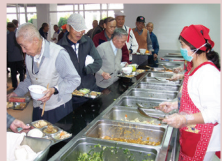
自助餐方式供應菜餚。