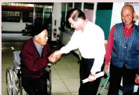
張主任（中）巡視家區探視榮民。

不論以榮民需求、安全、舒適的生活設施改善及與社區資源結合，強化醫療保健與多元豐富的文康活動以提升榮民身心協助與服務。