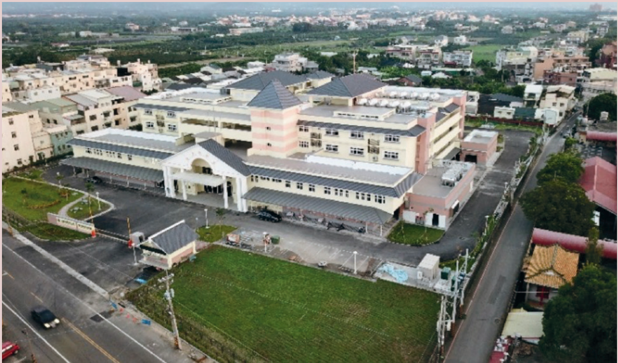
雲林榮家養護園區。