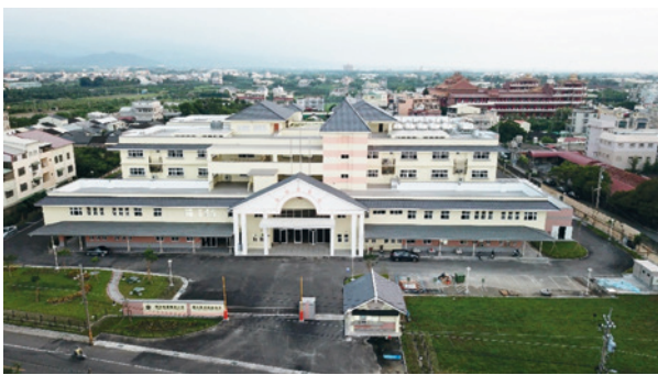
103-106年榮家環境設施總體營造中程計畫新建養護園區

75年至79年間分別增建松柏樓、復健中心及保健大樓，開設牙、眼、及家醫科門診以加強榮民醫療保（復）健作業及身心障礙榮民服務照顧，83年3月1日以「部分供給制」的方式，開辦支領退休俸榮民自費安養與養護的服務，87年9月配合行政院「擴大內需方案」辦理整建構置榮民養護設施（備）及生活設施改善計10項重大工程，拆除舊有保健組及仁愛堂榮民宿舍，規劃改建3棟3層（400床）身心障礙榮舍，家區概分行政區、休閒區、醫療養護區及生活區，各項安養設施齊全、環境清幽，榮民生活期間安祥而恬適。