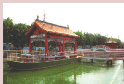
龍鳳池亭榭舟楫，觀賞休憩。