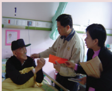
民國95年端節楊主任慰問住院榮民。