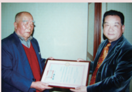
秦主任（右立者）頒獎模範榮民。