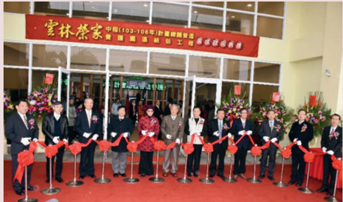
雲林榮家中程（103-106年）計畫總體營造落成啟用典禮。

為提升住民居住環境，自103年起執行中程計畫，興建400床符合長照法規及無障礙之養護園區，於106年8月31日竣工，107年2月7日舉行落成啟用典禮，使住民得以居住在安全無虞，行動無礙、生活自立的頤養環境。