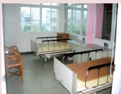
新建養護大樓榮舍2人1房現況。