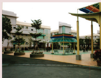
新建養護大樓及休閒廣場。