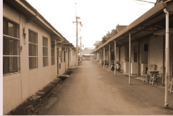
46年榮家成立初興建榮舍

本榮家係由行政院國軍退除役官兵輔導委員會運用美援經費依據「國軍退除役官兵輔導條例」第十六、十七條規定設置，目的在安置照顧功在國家年老無依榮民，提供榮民食、衣、住、行、育、樂、醫療保健、心理輔導與善後處理暨遺產繼承之服務，於民國45年7月17日開始興建，46年4月完成，5月2日舉行落成典禮，46年7月起隸屬臺灣省政府社會處，受輔導會督導，70年7月1日改隸行政院國軍退除役官兵輔導委員會，102年11月1日配合行政院組織改造更名為國軍退除役官兵輔導委員會雲林榮譽國民之家。