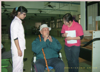
營養師辦理營養諮詢門診。