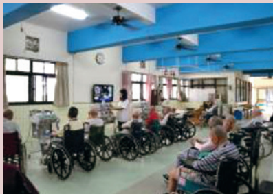
每週一至五上午復健理療服務。