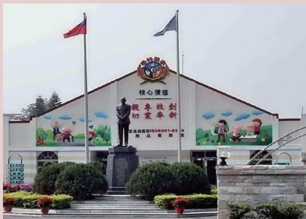
西區家區—安養園區。

本家在歷任家主任秉持永續經營理念及全方位服務照顧榮民宗旨下，榮獲94、97、100、103年度輔導會安養機構評鑑優等單位。