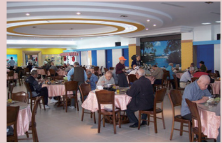
溫馨祥和、健康營養。