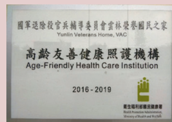
高齡友善健康照護機構證書