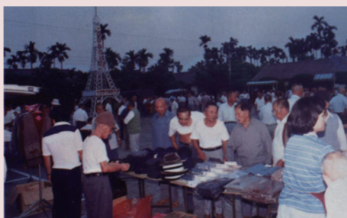
休閒廣場開放夜市榮民購物情形。