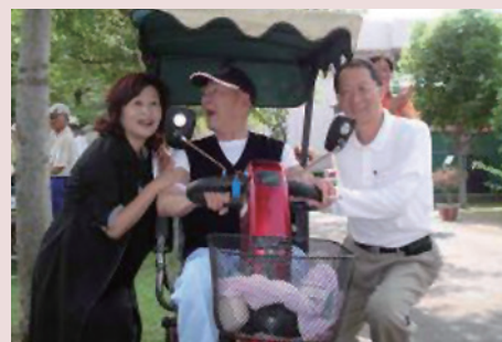
辦理99年度雲林縣長青槌球聯誼賽與縣長蘇治芬合影。