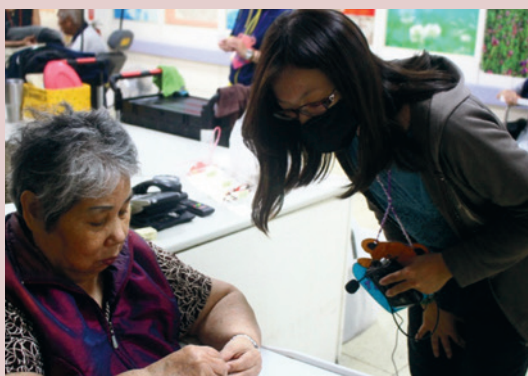
一般民眾參與團康活動。

106年2月15日起配合輔導會擴大政府資源共享政策及呼應民眾需求，開放本家餘裕床位，提供65歲以上榮眷、遺眷及民眾自費安養及養護照顧的機構住宿式服務。本家環境寬廣優美，且編制專業醫護、社工人員提供全方位身心服務，吸引許多一般民眾入住，未來本家持續提供優質及可近性的長照服務，營造榮民、榮眷與一般民眾頤養天年的溫馨環境。