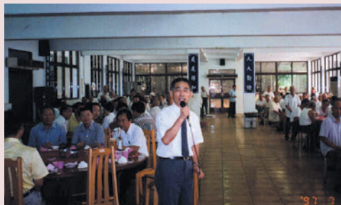
程主任（中）辦理員工榮民三節餐會聯誼。

「苦口婆心」是程主任的特性，雖然有些榮民老大哥在生活上有些不好的生活習慣，例如抽煙或酗酒，有些成了習慣會影響健康，或是造成危害，程主任經常不厭其煩的勸說這些榮民前輩，有些榮民被程主任的關懷與關心所感動，有些戒除了這些不良習慣，對身體有所幫助，榮民非常感謝與懷念程主任，其個人之生活自我要求非常嚴謹，做事亦非常持之以恆，是行政人員學習的好模範，非常值得推崇。