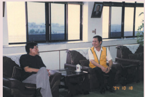
王副主任（左1）會晤慈濟功德會協調服務榮民事宜。