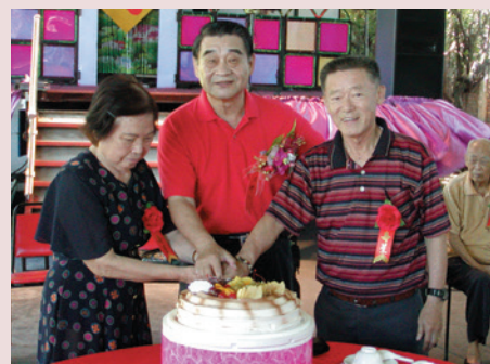
張主任（中）與榮民切蛋糕共渡慶生會。