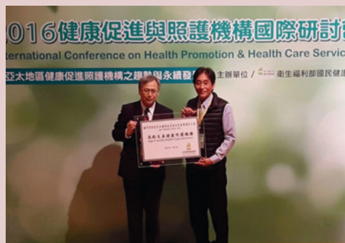
史主任接受高齡友善健康照護機構授證。