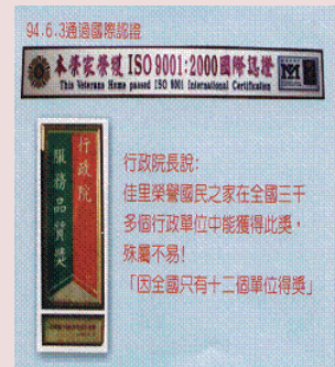
榮獲行政院服務品質獎暨通過ISO認證。

本榮家另闢社區關懷中心，結合社區7個村里各類藝文活動到「本榮家」關懷榮民，其中有歌唱、插花、繪畫、棋藝等多種活動，這不僅可聯繫社區情感，更可運用社區資源做整合，此一為民服務工作，獲得地區與縣政府之好評。