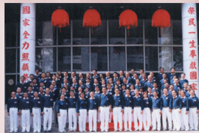
佛教慈濟慈善基金會佳里榮家志工隊全體人員合影。