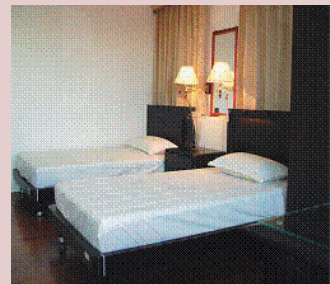
清靜優雅的榮民夫妻雙人套房。