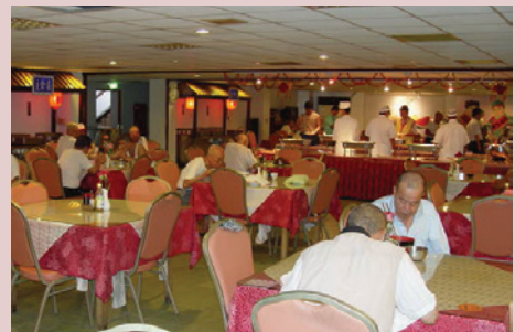
自助餐廳榮民用餐情形。