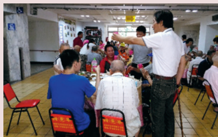
史主任親切與住民歡慶佳節。