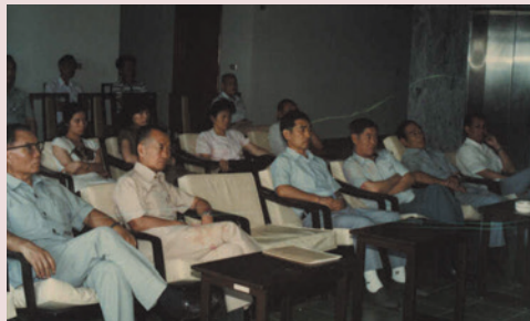
程主任（左3）參加榮民伙食與生活改善會議專注情形。