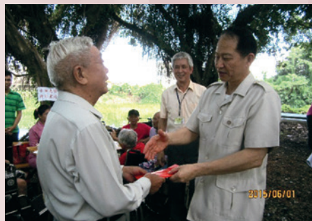
董主任委員蒞家視導並頒贈端節加菜金。