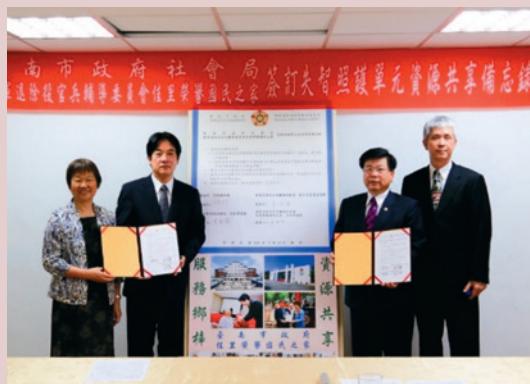
與臺南市賴市長清德先生簽訂資源共享備忘錄。