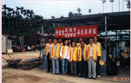
佳里榮家（921）賑災醫療團隊留影。

期間榮家員工與榮民為響應政府「賑災捐款」，共計募得捐款總數71萬6,300元，全數匯入內政部「921賑災專戶」中統籌運用。