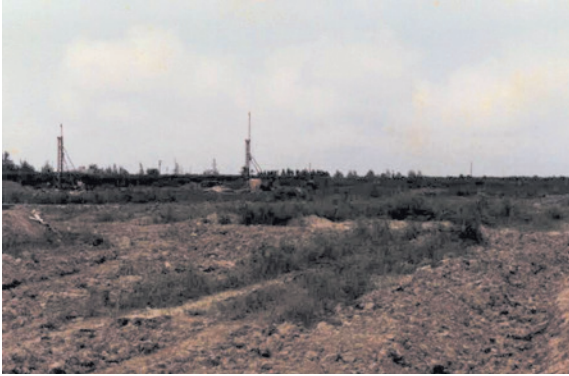
本榮家前為高雄大同農莊一片荒蕪地狀況。