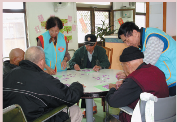
榮民藝能活動—拼圖遊戲。

針對行動不便榮民實施床邊關懷、餵食，並協助購物，就醫及陪同身障榮民復健，有助於孤寂心情之排解，對本榮家服務照顧榮民工作助益甚大。