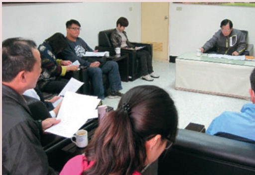
與縣政府共同研議推動社福資源共享會議。

針對地方政府的需求及榮家設施設備的供給，除了服務照顧榮民及榮譽外，開放設施設備共同照顧低收入戶的弱勢族群，經積極與縣政府聯繫協調，自102年起共同簽訂「低收入戶養護老人收容照顧合約書」，提供床位協助轄內低收入戶長者轉介至本家收容照顧，深獲各界肯定。