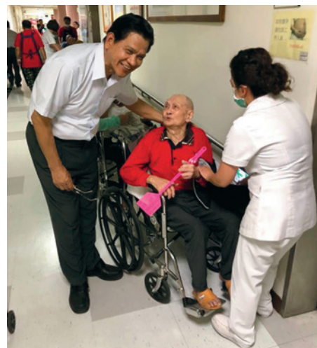
葉主任（左1）關懷就醫榮民。