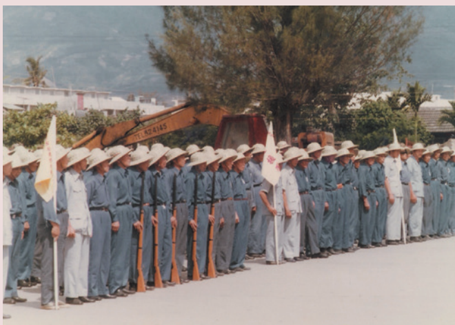
榮民編組自衛隊演練情形。