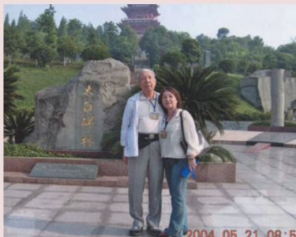
張主任夫婦生活照。

張主任民國17年1月7日生，河南省開封縣人，畢業於陸軍官校第22期，歷任連、營、旅、師長等職，77年10月12日陸軍少將外職停役，調任本榮家主任，任期3年7個月。重要政績如后：