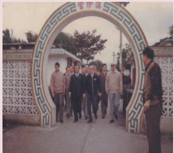
蔡先生（右2）代理家主任陪同蔣故總統經國先生巡視家區。