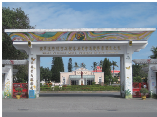
民國102年榮家組改後新大門。