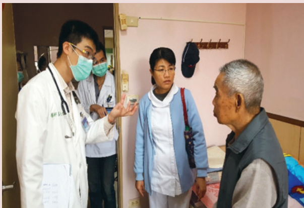
藍光世醫師走動式服務關懷榮民身心狀況。