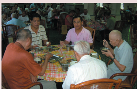
詹主任（右2）與榮民共餐。

一、本家自榮院開放、圍牆拆除後，已有宵小進入榮舍偷竊情事，榮民生活於恐懼中，加派夜間巡查人員，並協請馬蘭派出所夜間至家區巡查，強化防竊措施。