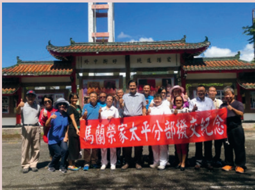
與縣政府共同研議推動社福資源共享會議。

太平榮譽國民之家成立於民國44年，占地11.25公頃，當初是為了安置戰功身心障礙的軍人而設立，最盛時期安置四千多名榮民，政府組織再造後，隨著榮民凋零，102年11月併入馬蘭榮家，改稱「國軍退除役官兵輔導委員會馬蘭榮譽國民之家太平分部」，原有的榮民及職員工移至馬蘭榮家本部安置，經輔導會政策評估與指導，107年7月25日完成撥交臺東縣政府。