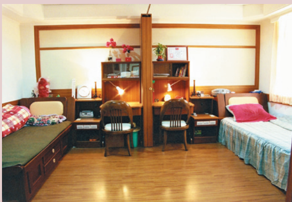
現代化起居設施之雙人套房。

民國92年4月整建和平堂舊榮舍為雙人套房，共21間42床，92年12月16日正式啟用，每層樓設有文康室，每間分設臥室及客廳，寢室內備有衣櫃、床組、書桌、床頭燈、電扇、美術燈組及床頭櫃等現代化起居設施，均採用符合老人適用材質的用具配備，充分考量高齡榮民生活所需。