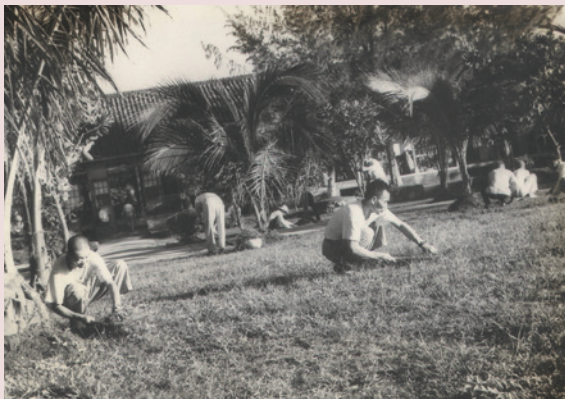
榮民整理環境情形。