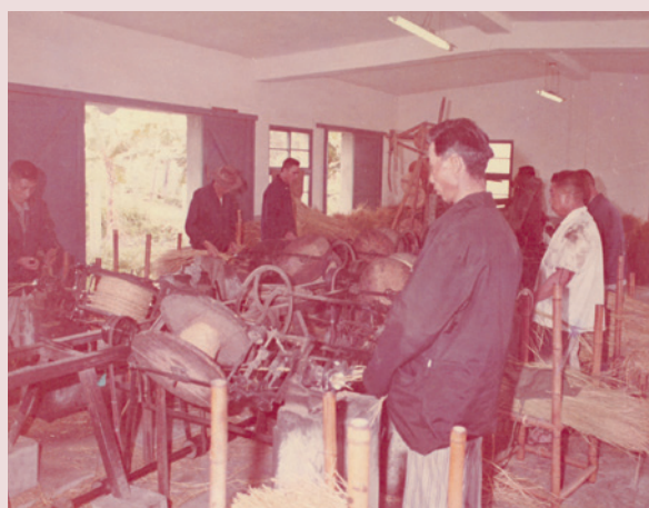
草繩工廠運作情形。