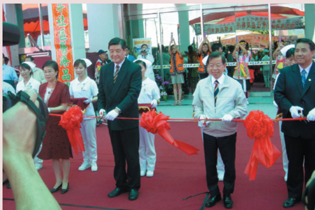
行政院謝前院長長廷（右2）主持臺東榮院落成啓用剪彩。

本榮家累積老人服務經驗與成效，以六星計畫中「社區安全」及「社福醫療」為主軸，結合臺東縣榮服處及臺東榮民醫院，共同推動「馬蘭健康社區」，結合南榮、新生及馬蘭3里，嘉惠社區民眾。行政院謝前院長長廷於民國94年6月21日蒞臨本榮家視導，聽取「營造馬蘭健康社區」計畫後，除表示肯定及嘉許外，期許能持續有效推動。