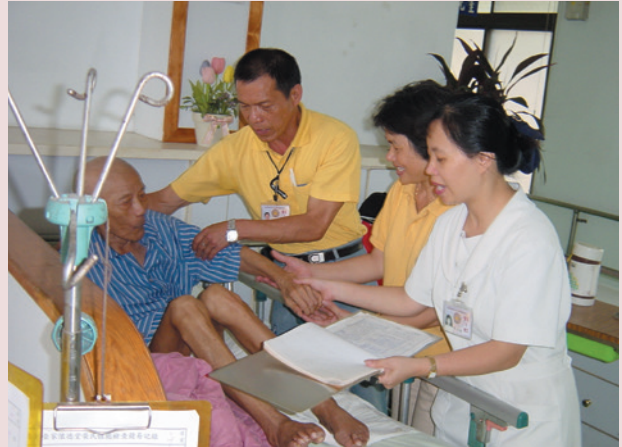
三合一聯合巡房走動式服務。

每日早上8時起由堂長、照服員及責任護士，實施三合一聯合巡房，向榮民噓寒問暖、量測血壓、用藥追蹤及衛教，提供更多服務項目，縮短彼此距離，期能儘早發掘問題，適時予以解決。