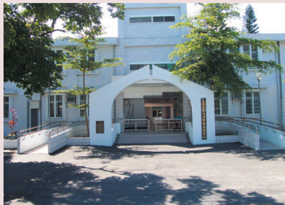
慎修養護中心大門。

以最完善的生活設施，最專業的服務團隊、高品質的醫療照顧及多樣的活動，營造溫馨、祥和的頤養環境，10年來成效深獲各界肯定；於94年1月1日依促參法委託民間經營。