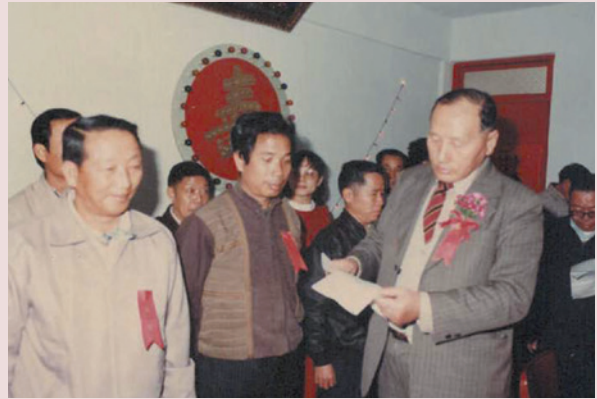
賴先生（左2）接受表揚。

榮家在歷任各級員工努力下，目前家區煥然一新，花木扶疏，綠樹成蔭，整體景觀美化，願全體同仁，本著繼往開來，全力以赴之工作精神，共同營造榮家為最佳之頤養處所。