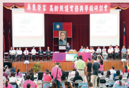
104年高齡照護學術研討會。