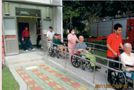
消防分隊教官指導本家災害防救演練及驗證。

依輔導會頒布規定，每週抽測安、養護堂隊照服員消防設備操作及宣導安全逃生疏散演練一次，每月實施堂隊疏散演練一次，每半年舉辦一次災害防救演練。災害防救演練包含照服員上下班任務交接、發現小火時自行撲滅、中火無法撲滅時通報支援、及大火持續延燒時召回家區附近職員工返家救災等。演練期間商請龍