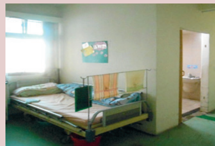
和平堂整修後住民皆有獨立空間及簡易衛生設備。