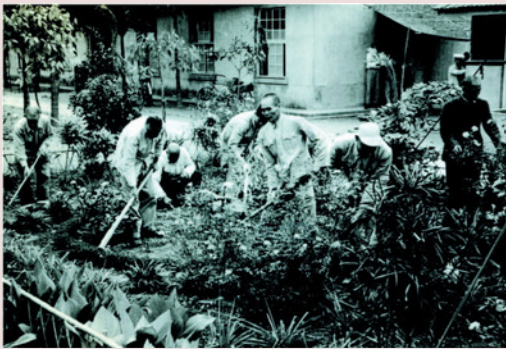
榮民辛勤工作美化家園。