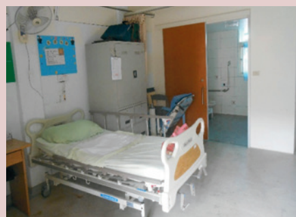
忠孝堂整修後住民皆有獨立空間及簡易衛生設備。