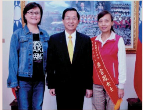
當選民國94年度全國模範勞工與陳前總統合影（右1）。

老人心靈的空虛，為豐富住家榮民精神生活，積極推動爭取社會資源，協調慈濟功德會、佛光山友愛服務隊、慈恩修心靜思會、威盛信望愛基金會、基督大連教會、天主教、鄰近各大專院校博愛社團等，來家居家關懷，帶來溫馨的活動與歡樂，讓榮民們心靈有所寄託。在臺舉目無親的榮民長輩們，早已把臺灣當成自己的家，這群離鄉背井的老人都經過歷史的苦難，每位都是很可愛的老人，他們需要更多的愛與關懷，也因此李 女士誓言將投入全部心力繼續照顧這群無依的老人。一路走來她均本著慈濟「大愛」精神，以熱誠來服務照護長輩不遺餘力，深受長官嘉評及長輩們讚譽，88年當選輔導會員工楷模接受表揚、94年5月榮膺全國94年度模範勞工接受表揚。