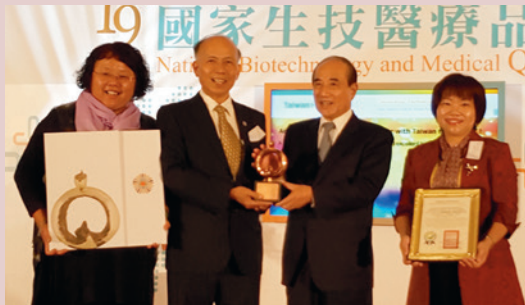
生策會王金平創會會長頒獎。

2016年以「守護遺忘的時光~建構走動、互動、感動失智照護模式」，向國家生技醫療產業策進會（簡稱生策會）申請「護理照護服務類/長照機構服務組」「2016 SNQ國家品質標章」，經由評審團審查，評核本項目品質優良，核定通過「SNQ國家品質標章」認證；且本項目之品質卓越，經評審團審議一致通過授予「國家生技醫療品質獎」銅獎之殊榮。2017年以同主題申請續審通過「SNQ國家品質標章」認證。