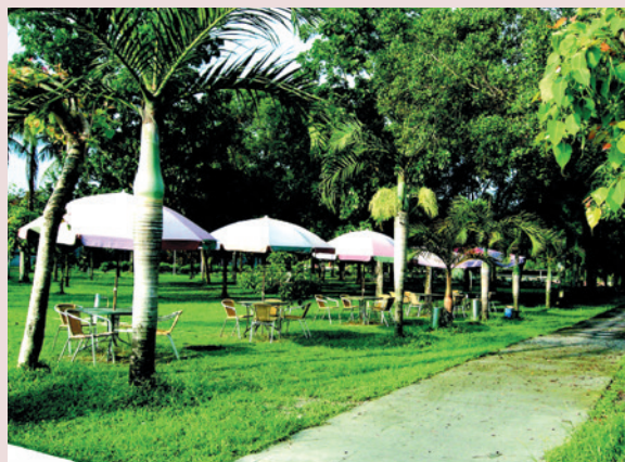
家區榮民休閒處所。