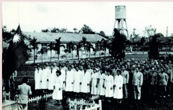
丁主任（前中）主持榮民及員工升旗典禮。

丁主任在任雖僅4個月餘，但其秉持堅定的信仰，除了為榮民帶來心靈上的滿足外，創立榮民識字班，協助不識字的榮民弟兄讀書習字，吸取知識，同時成立習藝班，教導一生戎馬的鐵錚漢子，充實其知識與技能。