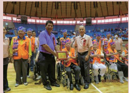
住民參加音律活化年齡倒著走活動。

為營造溫馨家園，連結引進佛光山紀念館、榮欣志工隊、松竹關懷協會、宏泰老人養護中心、大老師幼兒園，及榮華、泰安、新生國小等20餘個社會、宗教、慈善團體、學校等協助，辦理160場次多元性的大型文康活動，舒解榮民生活壓力，開闊個人的社會參與，增強人際關係，帶給住民41,096人次健康、樂趣及無限美好回憶。協調鐵改局南工處及屏東縣政府，免費運送土方回填廢魚池，擘劃為開心農場；獲屏東縣、內埔鄉、建興村協助，重修家區對面及圍牆外AC道路及排水系統；屏東林管處提供經費共辦「低碳世紀、森活做起、植樹養生、建康樂活」植樹活動；與鄰近社區辦理關懷據點、送餐服務與健康促進等回饋鄉里；協調屏東地檢署調派社會勞動人及協請軍事單位調派兵力協助整理家區及疏通排水設施。上述種種努力的成果，為榮家總體營造節約3千萬元的成本。