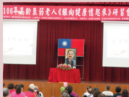
106年高齡衰弱老人《銀向健康憶起來》研習會。