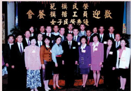
榮獲輔導會員工楷模（左2）。

劉輔導員79年經由輔導就業，至本榮家擔任輔導員兼任堂長，負責榮民生活起居照顧、糾紛調解、心理輔導、精神休閒、團康活動、就醫探視、權益維護、遺產繼承、善後處理等工作，近16年來對榮民的服務本著「當自己的事去辦，盡心盡力辦好」的信念，在榮家承接了幾個重大工作：79年至80年間辦理發還就養榮民前繳回半數退伍金案（13梯次發放數仟萬元）圓滿完成、帶動住家榮民老人晨間香功運動、引進推展社區槌球運動、充實榮民休閒、生活整修休閒中心（牌藝、卡拉OK）並予規劃管理等工作，先後獲選為本會員工楷模及全國模範公務人員等殊榮，績效顯著。90年間奉命將單位福利社轉型為員工消費合作社，當時在極短時間積極策劃整頓完成，並於92年當選全國績優員工消費合作社，榮獲內政部頒發優等獎狀，而劉輔導員卻從不居功，仍舊默默耕耘著，他表示：將一本服務照顧榮民初衷繼續努力，使照顧袍澤的工作更落實有效善盡「人生以服務為目的」是他和全體榮家工作伙伴戮力以赴的目標。