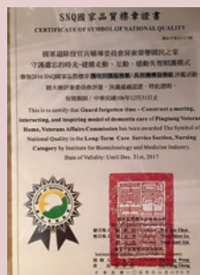
SNQ國家品質標章證書