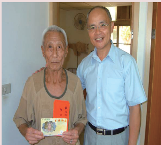
首長親臨為每一榮民慶生祝賀壽。

邱主任對本會政策及相關業務重點甚熟稔，學能優異，品操良好，處事謹慎細密，對所屬工作指導甚為細膩，不厭其煩，領導統御深得部屬向心；其每日抽空巡訪堂隊，探視榮民，深得榮民讚賞。