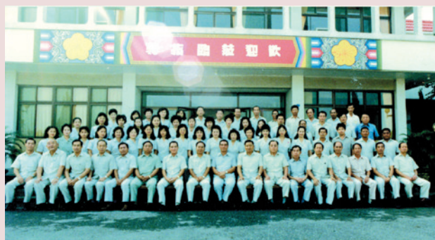
吳主任（前排正中）與員工於行政大樓合影。

復興運動，本榮家在吳主任領導下表現傑出，榮獲輔導會會屬榮家第3名之殊榮，73年輔導會辦理年度業務檢查評鑑作業，榮獲安養組第2名之成績。吳主任在任期間除積極爭取榮家各項硬體建設外，更強化榮民與員工生命共同體之心理建設，強調沒有榮民就沒有我們，榮民在那裡，我們的服務就到那裡，讓榮民備感溫馨。