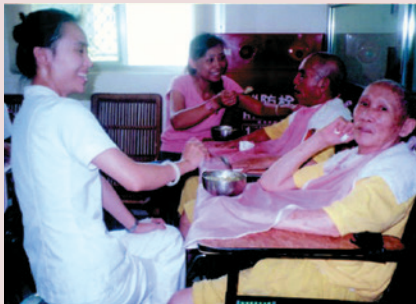
李女士（左2）餵食失能榮民長輩。

弱多病的老人得到更好照顧，主動接受完成居家服務員及照顧員轉銜訓練，取得服務員證書；為陪老人做運動，取得槌球C級教練暨裁判證照，深諳機構