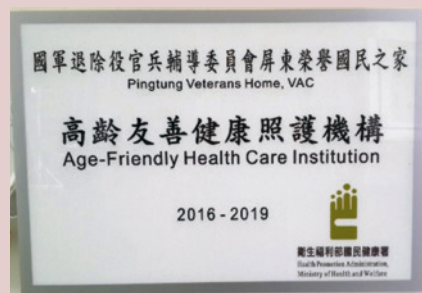
本家通過「高齡友善健康照護機構」構認。

本家依「高齡友善健康照護機構認證」作業規定，於105年8月30日提出認證申請書，並經衛生福利部國民健康署認證委員於105年9月26日蒞本家實地訪查認證作業，委員一致對本家生活設施及利用廢材創新做法對住民的照顧很感動，感受本家對於生命的尊重，以伯伯們的快樂為出發點。並於105年11月15日核發「高齡友善健康照護機構」認證。