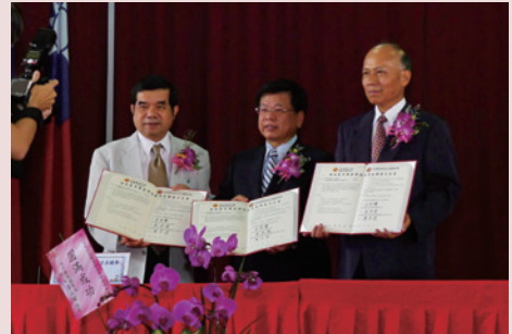
輔導會金副主委見證與美和科技大學簽署「策略聯盟」儀式。

與屏東縣政府簽署「資源共享」合作備忘錄，提供「忘我園區」6-12床，由縣政府委託65歲以上獨居失智且低（中低）收入戶接受照顧。102年9月4日收容照顧第一位女性民眾，「萬綠叢中一點紅」，使榮家有家的感覺，獲得報章與電視媒體的大幅報導，有效活化資源，輔導會已函請各榮家參照辦理資源共享。