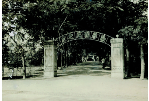
民國42年4月28日成立時之初址。

後因進住榮民日漸增多，榮舍不足，乃於68年奉准遷移至現址—屏東縣內埔鄉建興村100號，並於70年7月1日改隸輔導會，正式定名為「行政院國軍退除役官兵輔導委員會屏東榮譽國民之家」，核定為乙種榮家，本榮家成立之初，置主任1人，綜理全家業務，下設教導、習藝、保健、總務4組，主計、人事2室，分別辦理榮民安養業務，改制計職員32人、工友60人，安置榮民1千餘人，79年8月1日裁撤習藝組，核定為丙種榮家。