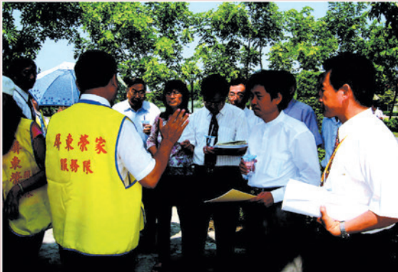
學者專家實地評鑑安養現況。

輔導會為加強安養機構之管理及對榮民之服務照顧，參照內政部對臺閩地區公私立安養機構評鑑方式邀請專家學者組成評鑑委員，對18所榮民安養機構實施評鑑，民國91年本榮家接受第一次安養機構制度化評鑑作業，經學者專家評鑑報告指出多項缺失與改革建議；本榮家為迎接94年度第二次機構制度化評鑑，全體同仁虛心檢討追蹤改革及克服困難追求卓越，在首長旺盛企圖心與正確領導及同仁們共同努力；經評鑑總成績榮獲榮家績優獎（第2名）及最佳進步獎。