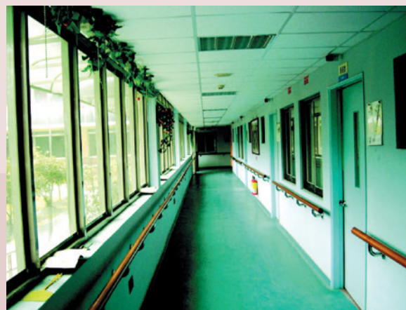
室內無障礙設施－扶手。