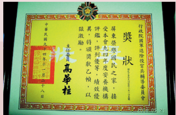
安養機構評鑑榮獲優等獎。