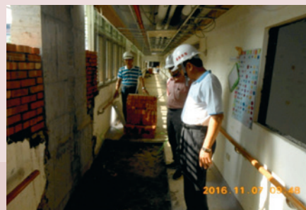
榮舍耐震補強工程。