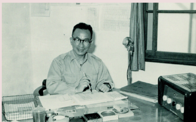
岳主任於辦公室內批閱公文。

岳主任對員工及榮民照顧不遺餘力，就任後首先成立福利社，以完善品質及服務對內營運，47年4月9日興建失能榮民宿舍乙棟，48年7月16日成立豆腐工廠，50年建職員眷舍3棟、癱瘓榮民宿舍3棟、廁所、廚房、車棚各乙棟，51年建職員眷舍、福利中