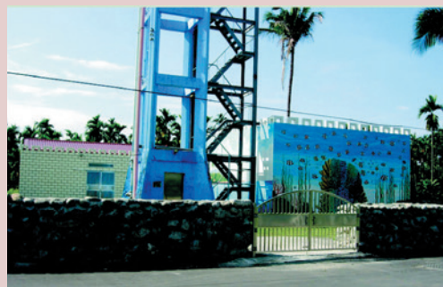
自來水製水供應系統。

本案主要工程有新建300噸儲水槽乙座、機房乙座，94年12月份竣工使用，每日造水最大容量480噸可滿足本榮家安養榮民飲用水之需求，使榮民先進能享有安全、健康、衛生無虞的飲用水品質。