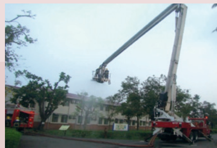
屏東縣消防局第二大隊配合本家全體職員工共同演練。