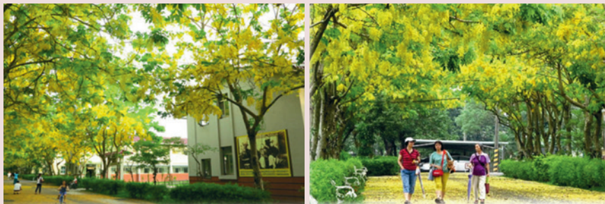
優美的黃金雨隧道。

所，提供民眾休憩及學生校外教學場所，帶動家區生動、活潑氣氛，使長輩及來賓均感受到綠意盎然蓬勃生氣的優質場所。尤其是每年5月中旬阿勃勒花季時，各地前來觀賞之遊客絡繹不絕，並讚嘆有加，106年花季迄6月底止已近有3千餘人前來觀賞。