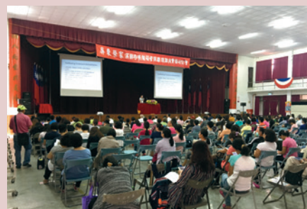
105年高齡吞嚥障礙者照顧研習會。