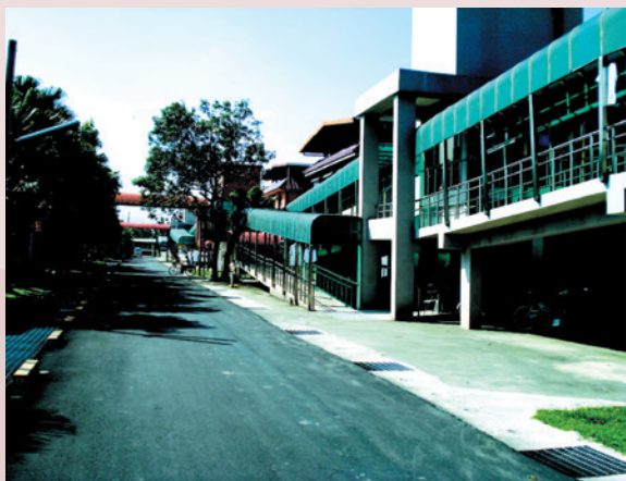
室外無障礙設施－斜坡道。

本榮家早期大部份為老舊建築，榮民年齡與體能尚屬中年老人，無障礙環境的建構在當時仍未被重視，80年代起，榮民年齡老邁體能衰退，為使家區之環境設施更能符合人性化，歷任主任皆積極貫徹輔導會政策，致力於無障礙生活設施改善，正是服務照顧具體實踐重要指標，以提供榮民長輩溫馨舒適的居家環境。