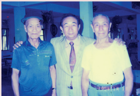
王主任（中立者）與榮民合影。

接任本榮家主任後，致力興利除弊，改善榮民生活品質及加強心理輔導，營造溫馨祥和頤養環境；為精進榮民伙食，籌組榮民伙食委員會，由員工輪流辦伙，榮民負責監督，嚴格控管伙食，要求精緻、營養、味美，多樣化，務使榮民吃得飽、吃得好。王主任更落實照顧榮民及遺眷，期間安置榮民眷屬10多人，解決榮眷就業問題，落實輔導會照顧榮民遺眷之政策。