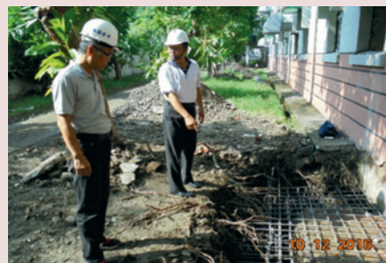
榮舍耐震補強工程。