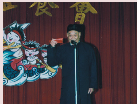
端午佳節聯歡會，盛裝出席表演相聲。