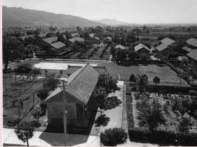
早期的太平榮家風貌，只見幾棟分散的平房、稀疏的樹木、模糊的邊際、純樸的風情。