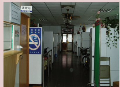
從壯年到老年，從安養變養護，我們隨著榮民照護需求改變照護模式。

成立志願服務隊，結合員工和榮民的資源，激勵秉持「施比受更有福，予比取更快樂」的理念，發揮「助人最樂、服務最樂、袍澤情深的精神」，有效運用熱心服務榮民及員工之人力資源，以閒餘時間參與「志願服務」工作，提升生活品質及增進全民福祉。加強訪問座談，有效掌握問題，切實照顧榮民生活，以增進榮民向心，鞏固團結。