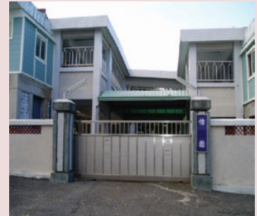
對於記憶退化的住民，我們提供了安全及保護性的居住環境。