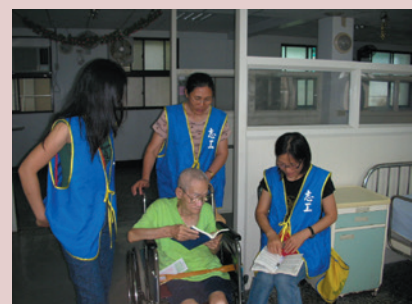
本家志工服務榮民。