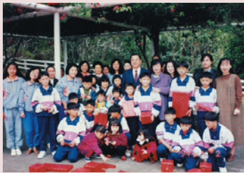
為照顧榮民遺孤，經國先生創辦慈母育幼院，翻開院區記憶錦囊，滿滿的愛在那兒（打領帶者為張主任）。