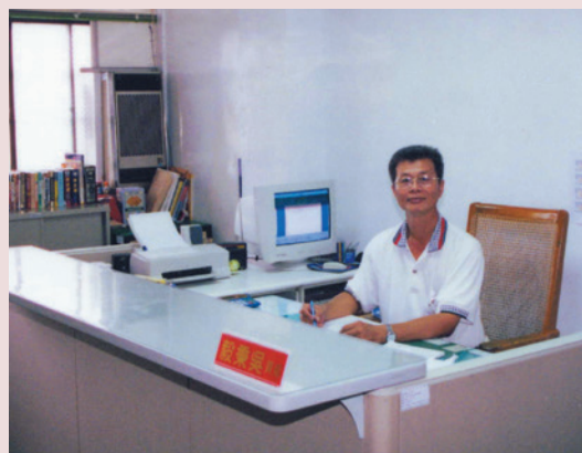
公私分明、剛柔並濟服務態度，贏得長官疼愛及同仁的敬戴。

雖然其目前擔任之職務非為決策者，但卻是貫徹執行要角，有著領導風範，帶動勤奮之風，足為表率。