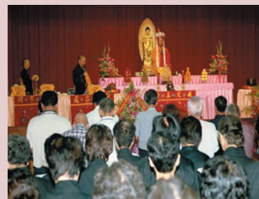
參佛禮拜淨化心靈。