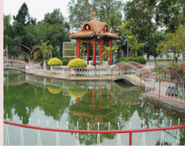
家區景觀「慈湖」～我們懷著「慈」烏反哺之心照顧榮民，這是責無旁貸的意念。