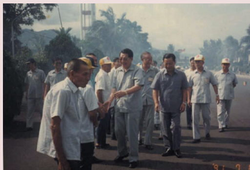
張主任（中）榮退榮民及員工列隊歡送實況。

「腳踏實地」是張主任執行任何政策原動力，其重要建樹：73年省府社會處支助興建本家資料館及環家圍牆工程；73年8月創訂業務手冊乙種，作為各項業務處理之準據；74年5月完成新建榮舍2棟；75年5月自行辦理改善福利中心房舍及設備，提升服務品質；完成整建中正紀念堂工程，75年6月創建家史館，完整保存榮民及員工功績史料。