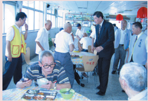
資主任（左立者）陪同高前主任委員華柱（左3）視察榮民用餐情形。

資主任服務本家3年多來，先後推動改善榮民伙食，將太平榮家公園化，健全保健組醫療系統，以發揮專業功能，使榮民得到更好照顧。94年辦理安養機構藝能競賽，榮獲合唱團冠軍，使員工士氣更高昂，服務更熱心。尤以推動榮家服務品質邁向國際標準化，於95年3月1日通過ISO 9001年版國際品質認證，更證明太平榮家不斷提升服務品質決心。