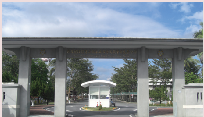
從分散稀疏的房舍，到現今具規模化的榮舍，我們歷經了無數的考驗（左為早期大門，右為現今家區大門面貌）。