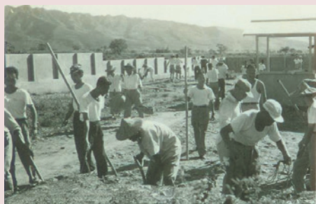
「一分耕耘一分收穫」，我們就是憑藉著這股信念，共同建造屬於自己的夢想家。

原有房舍48棟，運用美援經費及榮民的努力，採一次新建、每年陸續增建至民國68年止，共計88棟，共同建造屬於自己的家園。