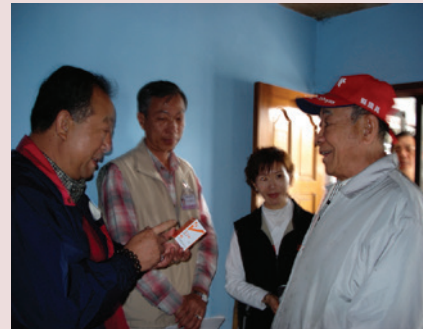
97年端節慰問住院榮民。