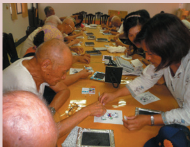
成立社區關懷據點，豐富老人生活。

二、擴大本會服務照顧層面及功能，拓展服務對象，以使本家能與社區相結合，達榮家社區化之遠景，俾落實本家永續經營。