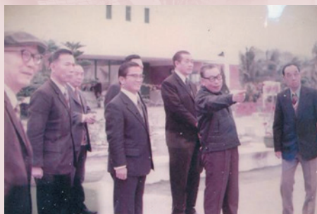
蔣故總統經國先生蒞家視察～願新的一年榮家有更高更遠的飛翔（右1為鄭主任）。

64年2月完成榮民復健中心；64年6月購地0.5公頃，開闢新大門、道路；65年6月創設碾米廠，改善榮民伙食，增進榮民福利；66年至73年1月策定整建發展近、中、遠程計畫，分6期實施，計完成行政大樓1棟、廚房3棟、倉庫1棟、深水井2口、水塔2座、浴室2棟、自建福利社1棟、精神病榮舍1棟；68年2月創設太榮托兒所；69年7月創辦榮民主副食統一採購，改善榮民伙食；72年12月承地方支援興建榮靈祠1棟。