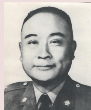
「誠心誠意」是慈悲為懷的顧主任留給後人最深刻的印象。

59年9月秋高氣爽之際，動員全體榮民員工，搬運石塊積土砌建家區圍牆及公園，建造安全、幽靜居家環境。泰安山區發生土石流，造成附近民宅受創嚴重，顧主任帶領員工扶危濟困，深得民心，61年11月主任於任期內病故，居民萬般不捨，名聲萬古流芳，永遠為居民所懷念、景仰。