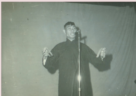
同樣的舞臺，不同的場景；不同的時光，有著相同的熱忱（年輕時期英挺風姿）。