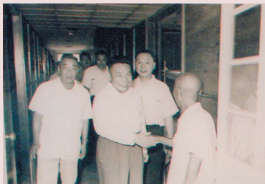
燦爛微笑，照我心房，蔣前主任委員經國先生（中間）蒞家視察，把榮家彩繪的無比光采（左為曹主任）。