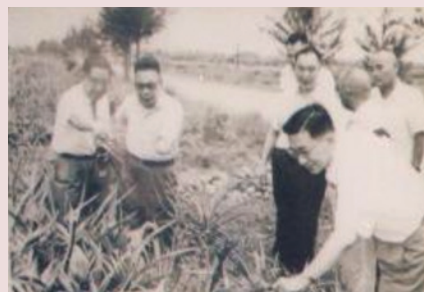
蔣故總統經國先生（左2）巡視本家農場實況。