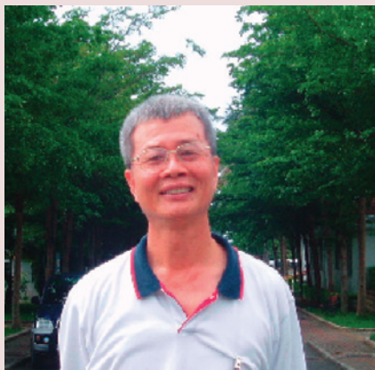
踏實純樸的個性，過人的聰明才智，我們以您為榮。