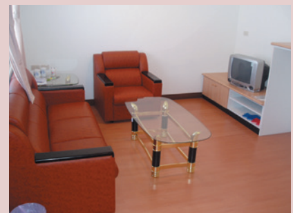
家庭式的居住環境。