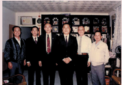
「精益求精」是張主任（右3）留給榮民及員工最深刻的印象。