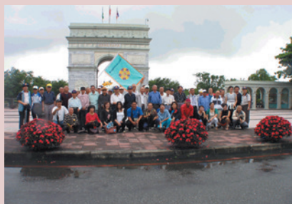
鼓勵榮民走出戶外，迎向陽光榮民自強活動。

設置佛堂、基督教堂帶領榮民參佛禮拜，豐富生活內涵，淨化心靈。每月定期舉辦慶生會，三節及重要節日，舉辦大型文康活動與餐會，使榮民感受關懷與家的溫馨。