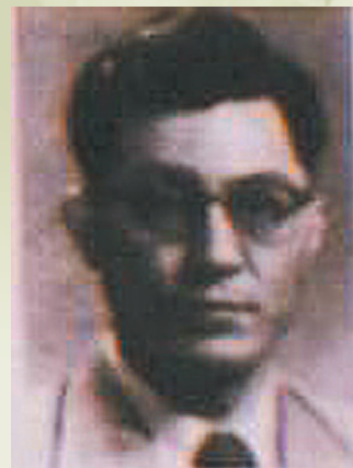
何山院長檔案玉照

本院於44年9月接收之初，皆為半永久性木質房屋，其中有2棟為火柴廠，3棟為高射砲營舍，由於彼時病患人數達1,000人以上容量不夠，故半數房舍皆用雙層通舖，醫療設備亦頗簡陋。此外因設備不全，工作人員較少，住院病患「養」多於「療」，此際對院內環境之整理，均有賴住院人員之合作，將院前遍地之卵石、雜草等清除，開闢成4公尺寬之道路，並於房舍前後栽植尤加利等容易生長之樹木；46年輔導會新建鋼筋水泥之醫療中心1棟，並撥款增加醫療設備，職員、工友各增四分之一以上，不僅使院務較易開展，性質上亦由「養」而變為「治療醫院」，始使本院粗具醫院規模。