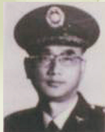
劉飛馳院長戎裝英姿。

任內新建建築：民眾病房、擴建各科室及急診室、護士宿舍、改建掛號室及擴大病歷間、改建榮民康樂室、新建醫護人員宿舍2棟、改建1至8病房配膳室為住院榮民存放物品庫房、改建榮民康樂室、榮民廚房加鋪磁磚、改建第1病房（勞保病房）隔間、改建中正紀念堂及新建將校病房等。