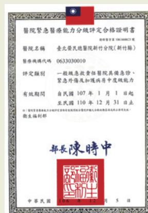
一般級急救責任醫院具備中度評鑑。