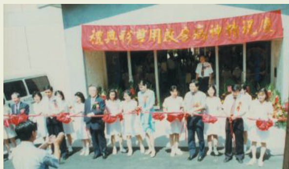
精神病房開幕剪綵盛況。

因應需求，於92年成立「精神科日間照護病房」，94年18病房（73床）完工收容病患。