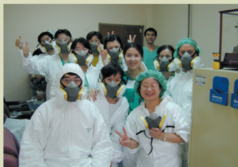
SARS醫療團隊合影留念。

臺灣自民國92年3月發現第一例境外移入的SARS個案以來，幾個月內全民及醫界都面臨了前所未有的考驗。面對一個新興、未知、感染力高且無孔不入的傳染病，從不清楚病原體，不了解治療方式，對傳染途徑有所爭議到對SARS病毒了解的漸露曙光，防疫措施逐漸修正改進，終於在7月暫時脫離了SARS的陰霾。回想過去的衝擊，的確是痛苦又光榮的一場戰役。