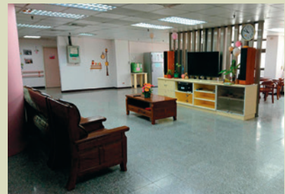
第二醫療大樓公務病床整修。