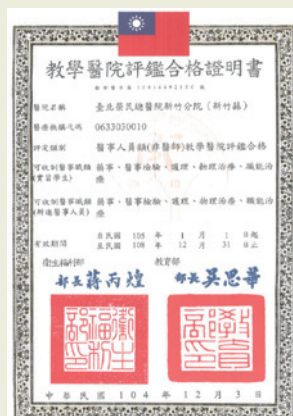
104年教學醫院評鑑合格。

局之評鑑。106年則陸續通過「一般級急救責任醫院具備中度」評鑑和「高齡友善健康照護機構認證」及「健康醫院認證」，同年亦通過「專科護理師訓練醫院」評鑑，升級成為可獨立訓練專科護理師之地區教學醫院。