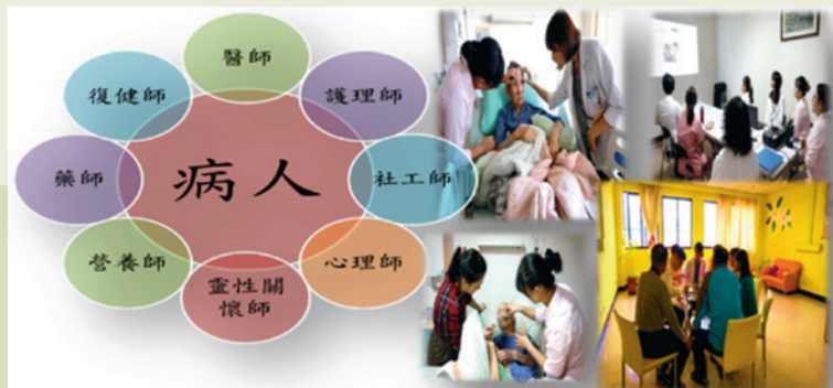
以病人為中心之安寧團隊。

長期推動醫療照護在地化之工作多年，除一般居家醫療、居家護理、居家復健工作成效卓著，順利推動「在地老化」外，近年更推動「在地終老」概念，發展「全程式安寧照護模式」。從組成以病人為中心的安寧照護團隊開始，陸續發展住