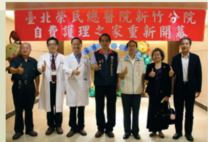
17病房自費護理之家。