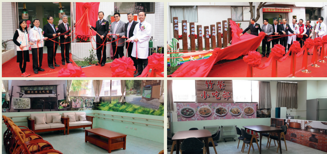
日照中心開幕及內部裝設。