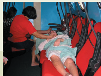
高壓氧治療中心內觀。