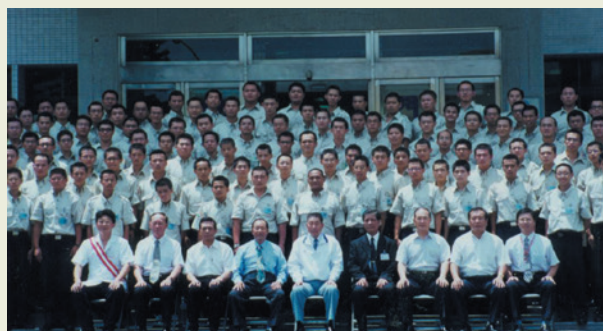
楊主任委員德智（前中）主持替代役男開訓。

本院承辦兵役替代役男156員專業訓練（輔導會第一次），自90年8月7日至20日，歷時二週，全程計畫周詳，內部管理確實，並蒙內政部兵役司長官到院督導嘉許，楊前主委親臨主持開訓典禮時，對本項工作諸多鼓勵，使役男抽籤、分發、接兵等工作順利推展，圓滿達成任務。