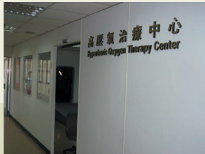
高壓氧治療中心外觀。

本院的高壓氧應用在急慢性創傷傷口之復健，均有顯著的療效，對於大新竹地區的緊急醫療上，本院的高壓氧更是功不可沒。