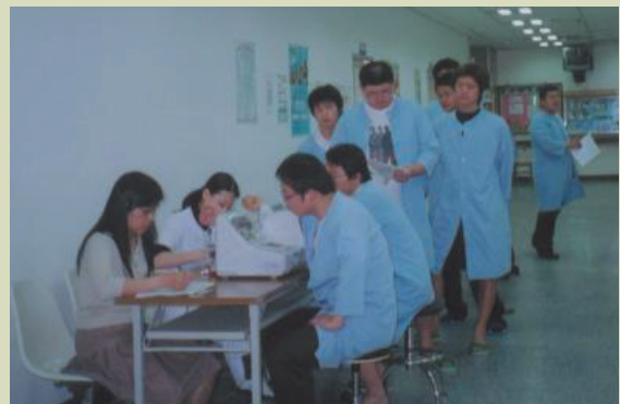
役兵體檢作業狀況。

本院執行役兵體檢，不同於其他醫院之處在於：場地淨空與一般門診隔絕，動線明朗開闊，1樓電梯全面管制，避免閒雜人等進入，役男身份確認，人力上總動員，即各行政科室均派員支援服務。故歷年來執行兵役體檢績優，迭獲役政司、兵役局督導長官嘉許（90年度獲新竹縣政府提報績優健檢單位），除應邀提供成果供役政展示之用外，特於民國92年3月1日兵役節慶祝大會中接受內政部長頒獎表揚及國防部長嘉勉，忝為「役政之光」。