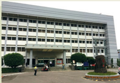
第一醫療大樓耐震補強。

自民國104年起，陸續完成之工程包括：第一醫療大樓暨18病房建築物耐震補強、國際會議廳翻修、17病房自費護理之家回收整建、新設中醫整合性門診醫療區、門診臨床醫療單位整合重建、第二醫療大樓公務病床轉型護理之家、員工宿舍翻修、新建日照中心等，以提供民眾就醫舒適環境品質及員工優質住宿設施。