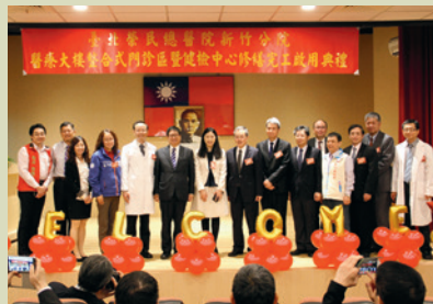
門診臨床醫療單位整合。