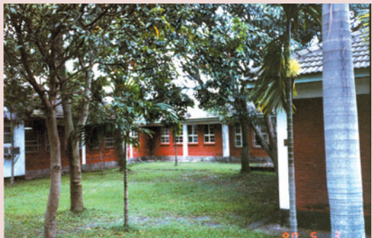
早期病房平房建築。