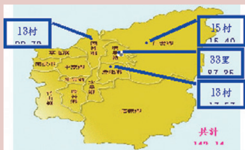
鄰近四鄉鎮村里及人數皆為重點服務對象。

由於經濟發展及醫療科技進步，國人平均壽命延長、人口老化，健康需求也由急性疾病之機構照顧逐漸變成慢性病及健康維護之社區照顧。