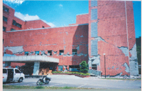
921大地震醫療大樓外觀損毀情形。

第3期全國醫療網自民國86年起至89年止，期間共完成整建院區無障礙及安全設施、聯絡走廊道路排水溝等工程、設立公務護理之家床位400床、增建職務宿舍、醫護及單身宿舍、深水井及淨水處理工程、太平間解剖室等工程。