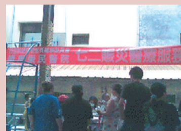
社區關懷醫療服務。

鑑於整體健康營造趨勢及預防醫學日形重要，為提升埔里地區民眾健康意識及水準，並兼顧市場服務佔有率及競爭力，本院社區健康中心秉持「促進社區民眾之健康、推展社區民眾預防保健服務、社區民眾疾病早期診治及健康管理、整合醫療資源與社會資源回饋社會」之服務宗旨，於民國91年1月1日正式成立。