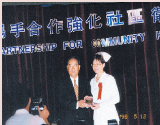
周主任(右1)榮獲87年臺灣省優良護理人員表揚。

回首23年的護理生涯，周主任感謝家人平日的支持相守及護理人員的支持鼓勵。她深具使命的表示，照顧榮民應「視病猶親，視病猶己」；她經常傾聽基層護理人員的心聲，努力為同仁爭取福利；並勉勵全體護理人員要一起努力團結合作，本著南丁格爾的精神共同為護理界貢獻一己之力。她的親切、穩健，腳踏實地、終身學習、默默耕耘的特質，深得護理同仁的愛戴及做為學習的標竿。