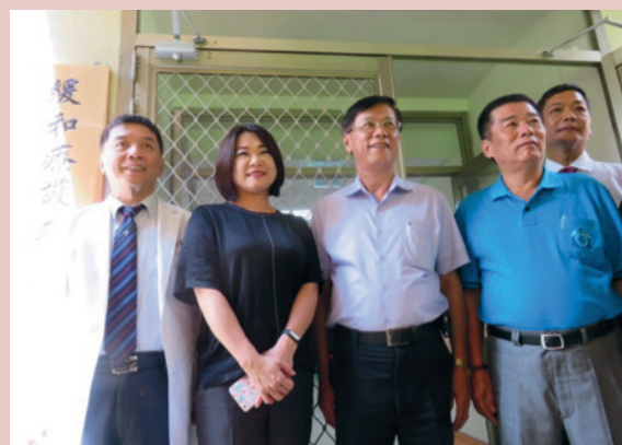
緩和療護病房揭牌儀式。

鑑於南投縣境內沒有安寧病房，在輔導會榮民安寧緩和全程照護網絡計畫協助及推動之下，歷時一年多的籌劃與準備，「緩和療護病房」於105年7月6日啟用，坐落於醫療大樓後方，共有單人、雙人房各4間，總計12床，環境清幽，光線充足，花木扶疏。地上1樓的建築方便長者與行動不便的病友及家屬活動。病房格局小而美，以舒適、溫馨為取向。並設置交誼廳、宗教室、沐浴間及陽光花園，提供病患與家屬不同於一般病房的溫馨舒適。