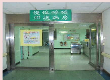
民國91年成立慢性呼吸照護病房。

為協助長期呼吸器使用者，提供長期醫療照顧及良好的護理品質，以減輕家屬長期照護壓力及經濟與精神之負擔，特成立呼吸治療病房。慢性呼吸治療病房係於民國91年4月由中央健保局核准加入整合性照護系統，初設18床，至92年12月擴增為40床。為因應需求增加，以閒置病房改建為呼吸治療病房（慢性健保病房），之後陸續以每次6床逐次擴充至64床之規模，專收呼吸器依賴患者（經判斷不易脫離呼吸器者），進行個案管理，並降低長期使用呼吸器病人佔用加護病房或急性病房之情形，促使醫療資源合理使用。