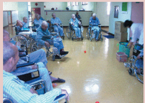
心身精神科老人日間病房。

91年1月再開設慢性精神病床50床，以協助慢性精神病患之長期安置問題。本院病房為嶄新的2層樓建築，急性病房每間病室3人一間，慢性病房4人一間，以人性化之空間為規劃。