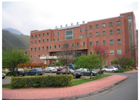
民國90年醫療大樓整復完工為現代化建築。

70年特別設立癱瘓病房，以加強癱瘓榮民之照顧。90年開設精神科急性病床及同年底開設精神科慢性病床，91年開設一般慢性病床及呼吸病房，92年建置慢性病床，以供長期呼吸照護病患使用，93年開立精神科日間照護病房，本院101年1月1日起組改併入臺中榮總為埔里分院後，陸續於105年開設緩和療護病房12床，106年新建長照大樓200床動土開工，增設日間照顧中心20床，全面落實政府之長照政策。