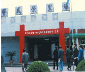
早期醫院為平房建築。

坐落埔里盆地，地處臺灣正中心，距「臺灣地理中心碑」約1公里，往霧社風景區的路線上，至「日月潭風景區」約20分鐘車程，四面環山，環境優美，無工廠污染，氣候清新宜人。