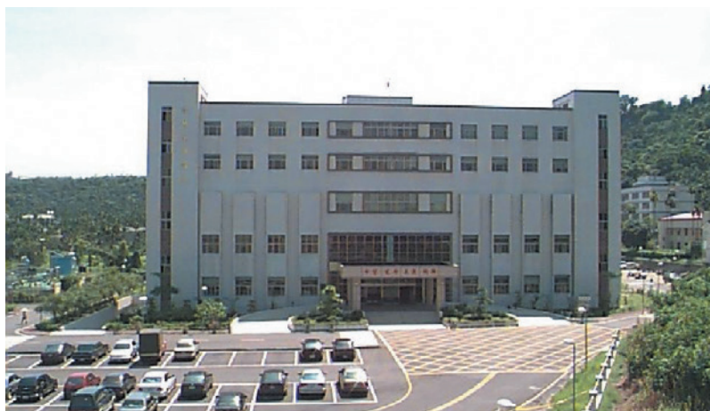
灣橋榮院醫療大樓。