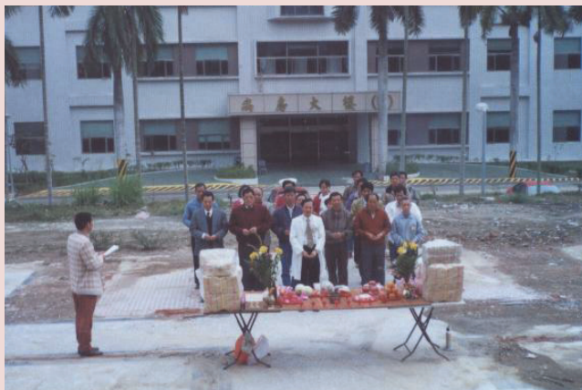
精神科病房落成啓用。

由於工商業的發達，經濟及社會型態的改變，各方面的壓力接踵而來，首當其衝的是人民精神打擊無法承受，造成諸多家庭與社會問題，精神病亦隨著社會文明應運而生。雲嘉地區地處偏遠，醫療資源貧乏，每遇精神病患均須遠程跋涉，造成人力、物力的浪費與不便。灣橋榮院有鑑於此，遂在民國年月開設精神科病房，為雲嘉地區規模最大的精神病照護醫院，為雲