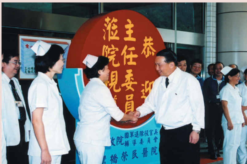
鄧前主任委員祖琳蒞院訪視。

曾主任是於民國58年自國防醫學院護理系畢業後即分發到空軍醫療單位服務。退伍後轉入公職，先後在署立醫療系統服務，直到80年轉入輔導會榮民醫院繼續工作，共計在醫院臨床工作了35年。