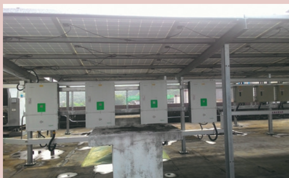
設置太陽能光電發電設備。

民國106年與海利浦電子科技股份有限公司簽訂『設置太陽能光電發電設備標租案』，除可配合政府發展綠能政策，亦能活絡國有不動產以增進國庫收入。