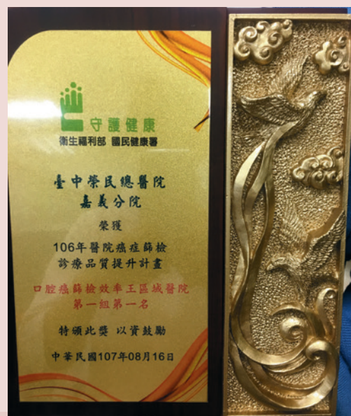
榮獲106年口腔癌篩檢區域醫院組第一名。

執行國健署口腔癌篩檢連年績效卓越，自民國104年起連年榮獲口腔癌篩檢區域醫院組第一名殊榮，106年再次得獎完成三連霸。