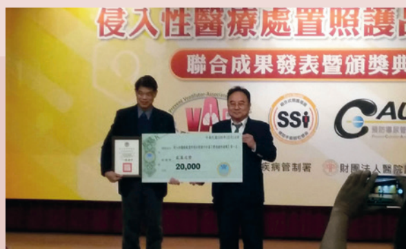
醫策會頒發106年「侵入性醫療處置照護品質提升計畫」實務操作競賽得獎~#第一類參與醫院B組~#第一名。

參加醫策會民國106年「侵入性醫療處置照護品質提升計畫」實務操作競賽得獎~#第一類參與醫院B組~#第一名，在長官的指導下，在病人的照護品管上不斷的精進與創新，團隊的努力成果獲的肯定與表揚。