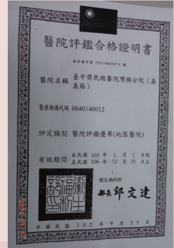
臺中榮民總醫院灣橋分院獲醫策會102年度新制醫院評鑑，評定為「優等」。