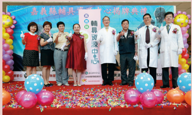
張花冠縣長主持4月22日於灣橋分院舉辦嘉義縣輔助資源中心揭牌典禮。

提供本縣身心障礙者輔具專業服務，協助身心障礙者獲得正確、適用的輔具，促進其生活自立、健康強化，提升生活自理能力，促進社會融合參與機會。透過輔具回收、租借、維修等專業服務，促進輔具資源再利用。