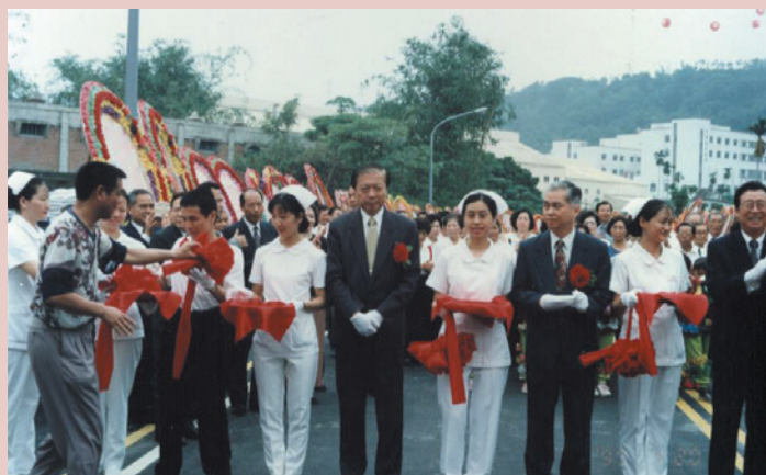
本院聯外道路通車典禮。

灣橋榮院原先為陸軍療養機構，地處嘉東偏遠鄉下，交通甚為不便，知名度不高，而嘉義地區由於工商業日漸發達，人口不斷增加，醫療需求亦成為民眾不可或缺的重要課題，本院地處山邊，進出均須經過羊腸小徑，不但造成看病民眾的不便，車輛進出亦甚感困難，直接與間接影響醫院的發展前途，因此，拓展連外道