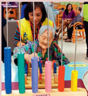
日照中心志工陪伴長者。