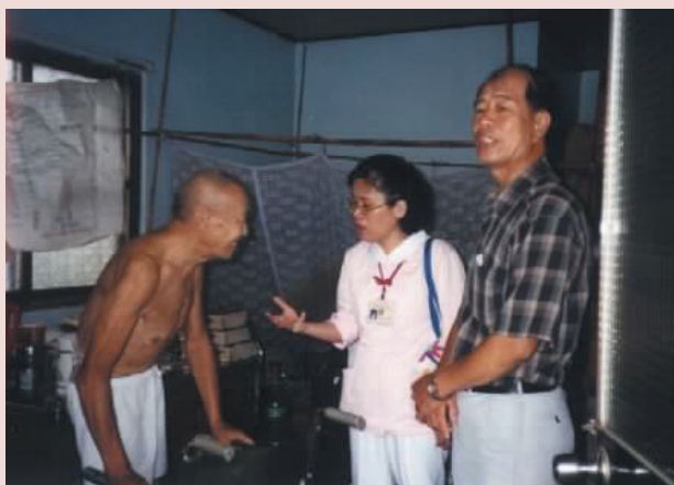
黃員（右1）利用假日訪視榮民。

83年上校退休後，原可安享不虞匱乏的生活。然在其不斷自我要求下及「助人為快樂之本」人生理念中，追求日行一善，種植福田。曾當選全國好人好事代表，軍訓楷模，傑出校友、榮民楷模及績優服務組長。黃員一生服務、奉獻軍旅、學校、鄉里精神，足堪榮民袍澤學習表率。