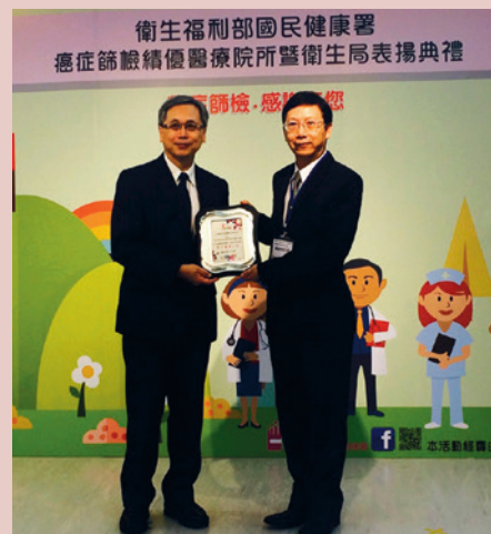
104年榮獲國民健康署頒發癌症績優醫院所。

積極照護偏鄉原住民健康，於院內推動語言志工（排灣語、魯凱語），提供全程安心陪診服務。多面向致力於原住民健康照護工作推動，從健康篩檢服務到戒菸戒檳衛教諮詢，醫療團隊的努力，於104年獲得行政