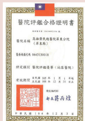
104年雙雙通過醫院評鑑暨教學醫院評鑑，經評定為地區醫院優等。

本院院為屏東縣屏北地區的綜合型醫院，為持續提升地區醫院醫療水準，全體團隊齊心努力，以病人安全為中心的理念，從醫療人才提升至醫療品質及硬體設施改善，獲得高度肯定。民國104年雙雙通過醫院評鑑暨教學醫院評鑑，經評定為地區醫院優等，顯示本分院醫療服務和教學能力皆達到一定水準，未來亦將秉持提升醫療品質與病人安全的精神，提供完善及可近性的醫療服務，關懷社區民眾並扮演好社區醫院角色。