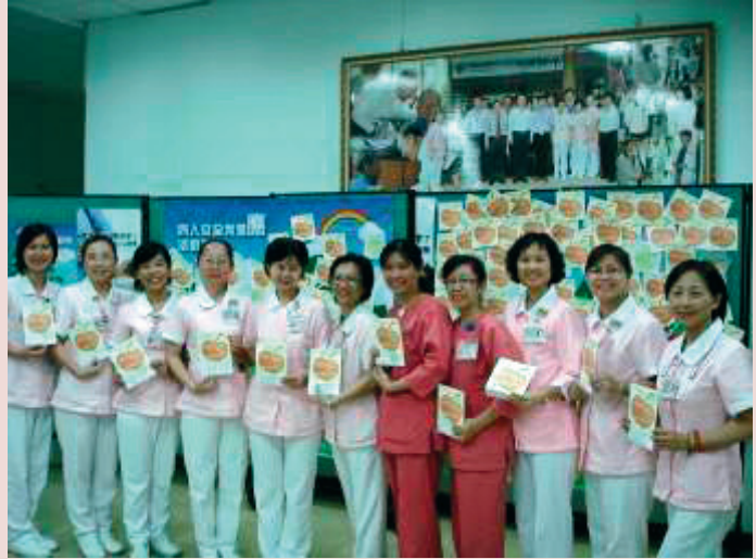
護理部舒主任（左5）與護理部同仁合影。

統籌規劃護理部評鑑作業，帶領通過各類評鑑，成效卓著，民國104年地區醫院評鑑「優等」，104年通過教學醫院、精神護理之家評鑑，貫徹輔導會政策，如：三級整合醫療、行動護理工作車等。爭取榮譽獲致無菸醫院「金獎」、績優標竿醫院「銅獎」、醫療照護品質「銀獎」、THIS標竿醫院評選「銅獎」、護理創新「銅獎」及多項競賽獲獎，以及特殊獎項如：「原署獎」、「全國模範勞工」等成果豐碩。