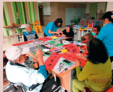
日照中心設計節慶動手做春聯活動，長者手動樂趣多。