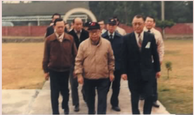
何山院長（右1）陪同總統經國先生蒞院訪視。

民國7年2月4日生，上海市人，國防醫學院專科2期畢業，69年8月16日陸軍中校轉任本院院長，任期2年7月餘。重要事蹟：有感院區內外環境及生活設施老舊，急需整修，爭取各方經費完成中正堂、各病房榮民廚房等設施、排水溝整修。內埔13公墓、納骨塔、門樓整修，彌補亡故榮民殯葬墓地嚴重缺乏情況，並改善亂葬情形。老舊通舖病床全面拆除，換成單人病床，更加妥善照顧病患。