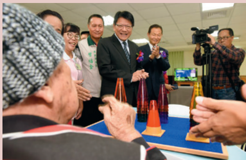
李主任委員與潘孟安縣長視導日照中心，關心長者復健。