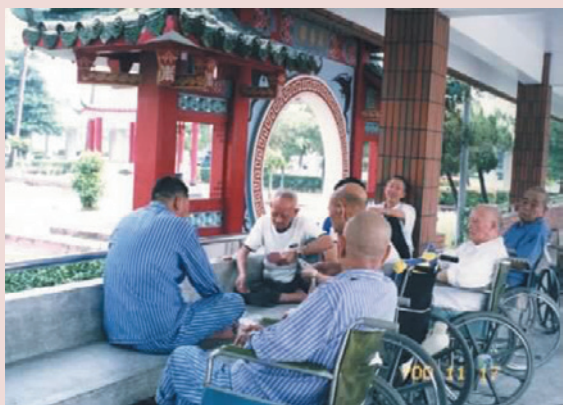
連絡走廊榮民活動情形。

報到後的她被分配到內科一病房服務，帶領的護理人員多是同學或資深護士，個個優秀、且能幹，要大家一起努力、一起高興，可能不那麼容易。貫徹領導方法，第一：將心比心。第二：三人行必有我師。第三：注重同仁福利。領導大家努力打拚工作，只要合乎情、近乎禮以工作績效表現為前題之下，與大夥同在；譬如說同仁希望安排三天連休，長官不允許。人員、工作安排好沒問題，她一定為他們爭取。經過多次溝通與建議，終於獲得圓滿解決，於是大夥情同姐妹，一條心。服務期間曾遭遇困難，亦曾大膽建議，點滴在心頭。