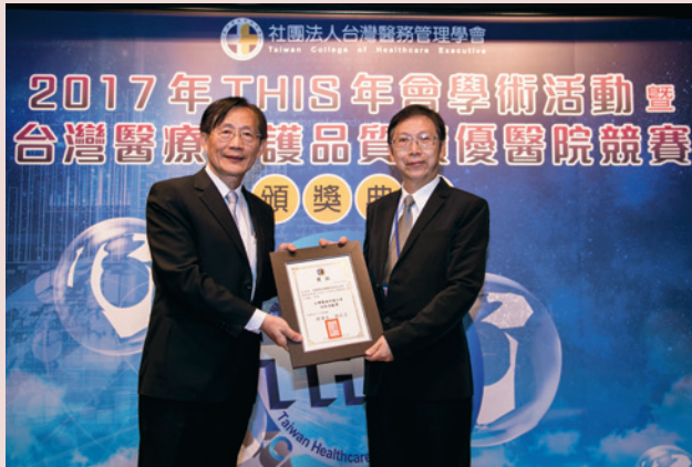
106年榮獲醫務管理學會績優醫院競賽銅獎及臺灣醫療特殊貢獻獎。

動，屢獲佳績，重視病人安全及品質有目共睹。為衛生福利部民國104年抗生素管理計畫認證醫院，落實感染控制，抗生素管理成效卓著。同年獲得衛福部104年運用健保雲端藥歷系統提升用藥品質創意競賽：地區醫院組第二名。於醫院品質績效量測指標系統與落實品質改善第二階段計畫，本分院於104及105年連續2年獲得品質指標績優獎。