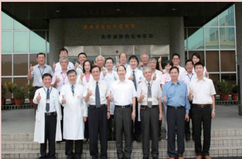
董主任委員視導高雄榮總屏東分院後全體同仁合影。

為提升本院營運績效，自100年加入健保總額制度後，營運穩定成長，費用管控得當，盈餘亦逐年增加，99年至102年盈餘增加11,526仟元，99-101年醫療收入概況總核減率由16.12%降為4.74%。