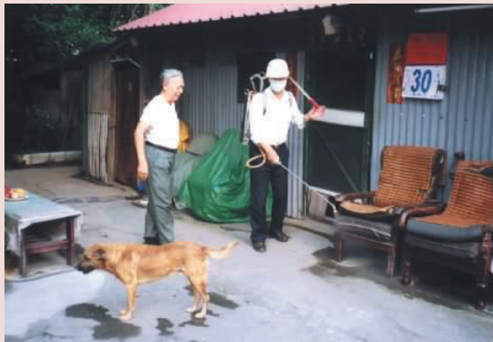
SARS期間協助榮民環境清理。

3年來服務鄉親3,500人次，深獲地方好評。報章連續報導，輔導會高主委獲悉後，指定本院擔負起各醫院社區營造工作示範、觀摩。93年8月5日龔副主委主持的參訪，即由黃員擔綱，內埔、東林示範點，表現優異，副主委給予肯定與表揚。