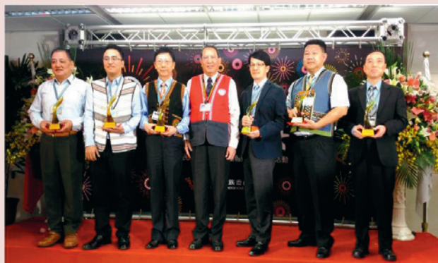
行政院原住民族委員會104年度第12屆原曙獎有功團體獎以及有功人士獎。

屏東分院加入屏東縣失智共同照護中心團隊，形成共同照護網絡平台。從醫院出發，透過門診、診斷，確診後由共照中心平台進行收