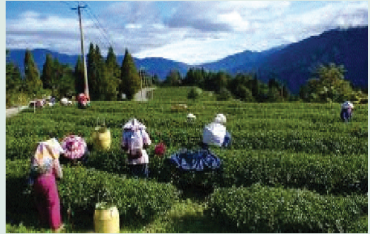
生產高品質之福壽長春茶，名聲享譽海內外，近年來產量已供不應求。

98年起已先後完成茶區灌溉設施、茶區風扇防霜設備、第三製茶廠及萎凋室等各項工程之興設改善，提升茶葉製作品質。近年來直營生態農園持續朝向有機方向精進生產技術，以安全、無毒管理方式生產高品質農特產品。目前已完成茶葉履歷驗證，並將持續辦理果品等其他產品之履歷驗證工作，常態性辦理農藥檢測及營養成份，以強化農場產品品牌形象，確保食用品質及安全。