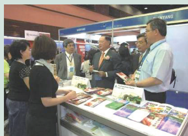
積極參加國內外大型旅展活動，開拓廣大旅遊市場。