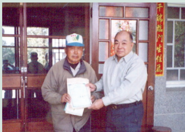
民國91年4月23日朱場長（右）頒發土地所有權狀。