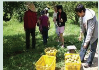
果樹認養活動已成為高山農業結合觀光體驗之成功典範。