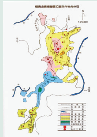
場區轄地及作物分佈。

農場地理環境位處東西橫貫公路中點梨山之後山，距臺中、宜蘭、太魯閣等皆為110公里左右，由林務局國有林班草生地撥借，場部距梨山7公里，土地橫跨臺中、南投兩縣，總面積800餘公頃；標高自1,450公尺至2,570公尺之間，場部所在地2,240公尺。大多數土地在2,200公尺至2,400公尺之間；氣溫夏季最高溫攝氏27度，冬季最低溫攝氏零下8度，全年平均溫度攝氏12度，4至10月作物生長期平均溫度攝氏16度；年平均雨量為2,000公釐左右。