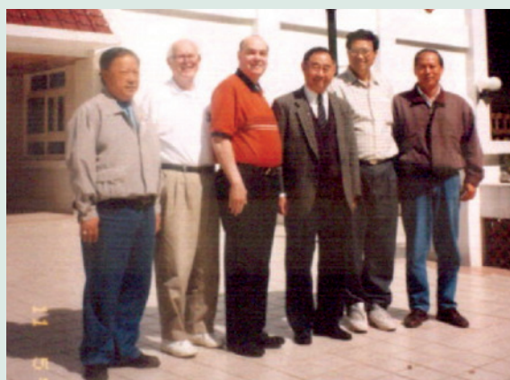
民國88年來勻德場長（右3）與外賓合影。

喜愛敦親睦鄰，和梨山各單位及外界的互動良好，對場員（遺眷）關係及當地居民亦常保持聯繫。