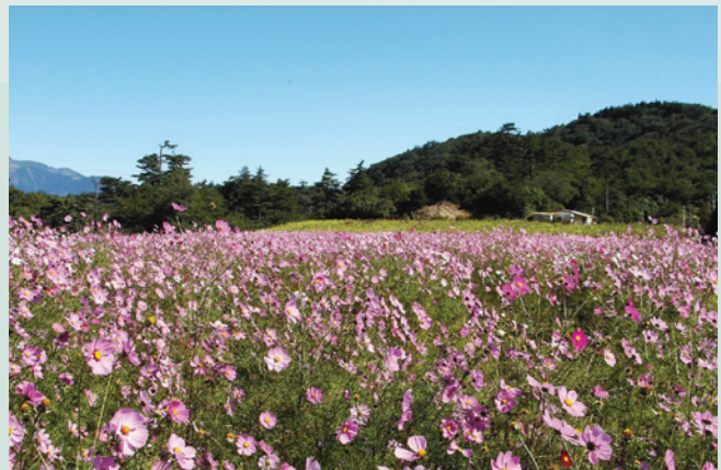
菜地於民國93年底收回，造林前的景緻。

民國93年7月2日至4日，全省下豪雨達725公釐，導致各地發生嚴重災害，農場直營農地由於水土保持設施良好，故七二水災本場並未有災害發生。惟為配合政府國土復育政策，除將菜地及果、茶園等合計76公頃，於96年底全部廢耕執行復育完畢。目前每年落實復育地撫育工作，持續補植山櫻花、楓樹、槭樹等具觀賞價值之樹木，提高視覺景觀及土壤涵養功效，兼具生態復育及景觀美學，營造成為農、林並貌之生態遊憩農場。