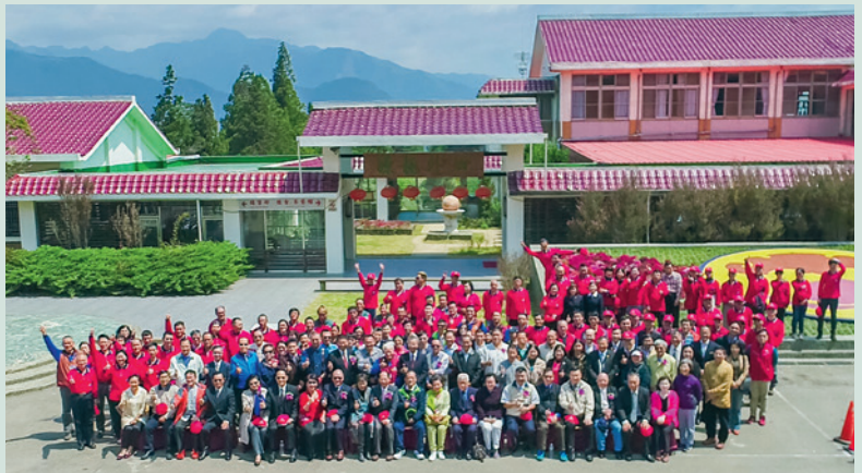
60週年場慶，與會嘉賓大合影。

農場於民國106年5月1日適逢成立60週年，特別擴大舉辦場慶慶祝活動，邀請輔導會曾前主任委員金陵、董主任委員翔龍及本會李副主任委員文忠參加。外賓包括臺中市政府林副市長陵三、消基會主任委員柴教授松林教授、地方公務單位、旅宿業及茶商會等計300餘人參加，場慶過程順利圓滿。