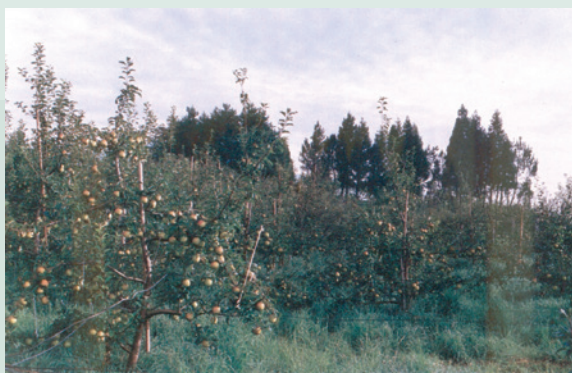
柳杉林屹立不搖捍衛蘋果樹（攝於民國80年）。