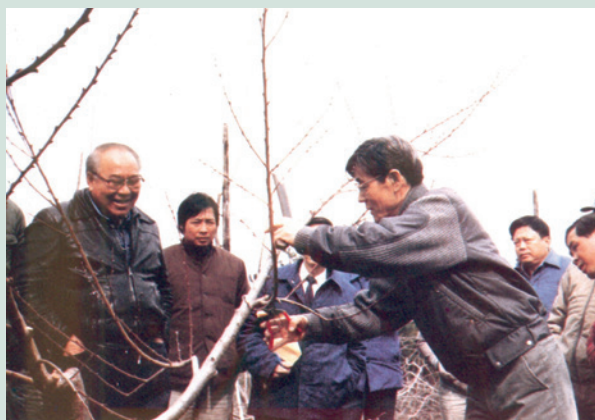
民國70年日本專家實地教導修剪果樹。

民國58年，前駐泰國大使沈昌煥陪同我國陸軍總司令于豪章將軍晉見泰王，泰王談及泰北山區少數民族生活困苦而多種植鴉片，為減少人民對鴉片的依賴，特成立「泰王北部山地計畫」，並請我國在農業上支援該計畫，經