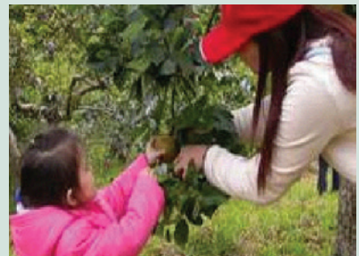
果樹認養活動兼具教育性及趣味性，吸引遊客攜家帶眷一同參加。

農場果樹認養活動兼具教育性及趣味性，舉辦10餘年來廣受好評，認養株數年年增加，從民國84年起研擬舉辦，由初期50株開始，每株3,000元，迄今開放蘋果670餘株，每株5,000元，為農場創造絕高收益。果樹認養活動至105年停止辦理，106年起改採現場採果方式，凡於11月訂房住宿之旅客得報名現場採果，品種以富士為主，每組房客6,600元可採60斤，至107年則擴大舉辦採果活動，自107年10月起不論住宿或是來訪的遊客皆可報名現場採果活動，品種以金冠與北斗為主，每人入園採果最低消費300元，以5斤為上限，當天依果品狀況於現場公告售價，讓來場遊客皆可享受採果樂趣。採果時期同時推出旅遊優惠措施成功提升住宿率，每逢採果季節一房難求，儼然已成為農場之招牌特色活動，有效達成高山農業結合觀光體驗活動之成功典範，提升生態農業產值及帶動旅遊事業之附加效益。