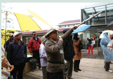
辦理行銷志工講習訓練，逐區逐點拉攏旅遊業績。