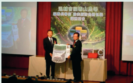
福壽山農場防偽標籤記者會。

民國106年8月農場與中華電信共同在「輔導會」19樓禮堂舉辦「福壽長春茶®發表暨防偽新包裝媒體茶會」。全新防偽包裝，具有特別設計製茶場標誌、立體防偽絲、防拆撕設計及獨一無二特殊編號，結合雲端防偽辨識系統「中華防偽雲」，保障福壽長春茶®品牌價值。