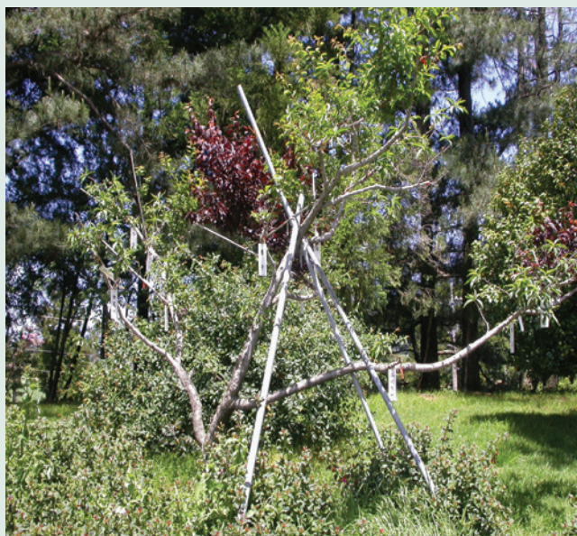
果桃李一家親—桃王。

現今全世界尚無一棵樹長滿數十種蘋果的紀錄，福壽山農場的蘋果王可稱為世界第一，亦顯現我國農業的高超技藝，值得國人的慶讚與肯定。蘋果王的嫁接與栽培管理是一項超級任務，嫁接過程中手指被刀削傷或從梯上摔下，是常發生的事，颱風造成接枝的斷裂，心血白費，次年又須重新嫁接，頗令人傷感；栽培管理作業從冬季落葉後的整枝修剪及果樹生育期的蔬果、施肥、病蟲害防治等等，都必須把蘋果王當成自己小孩般的細心呵護，