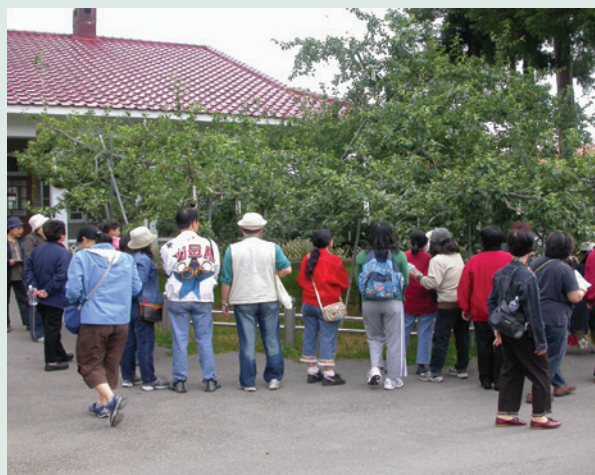
蘋果王門庭若市之盛況。