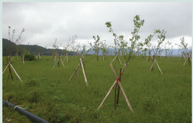
天池菜地於民國94年底完成景觀植生造林。