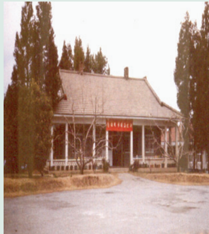
現今之場本部（攝於民國64年）。