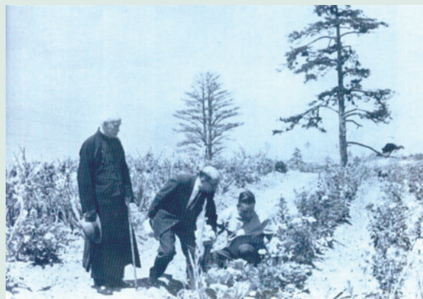
民國56年先總統蔣公與經國先生於果園中。