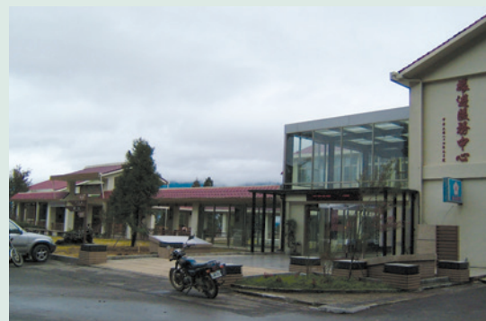
現代感十足的旅遊服務中心（攝於民國94年）。