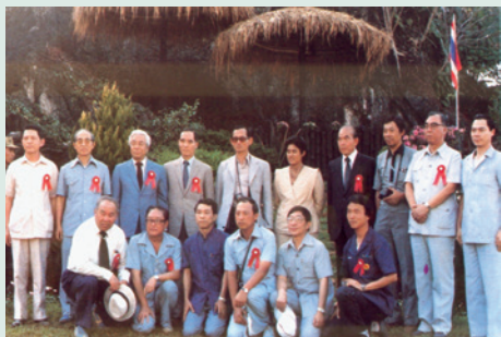
民國73年鄭主任委員（後排左4）與泰王（後左5）及詩玲公主（後排右5）合影。