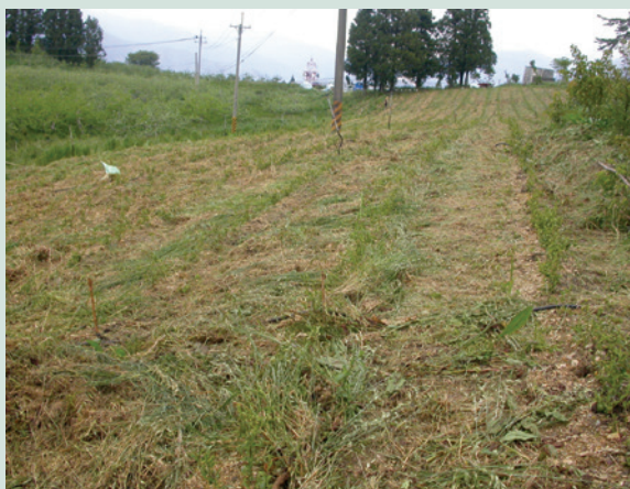
植草覆蓋後之一隅（攝於民國95年）。