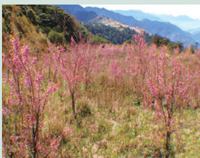
國土復育區種植櫻花，已逐漸成林，花季期間，遍野綻放吸引遊客。