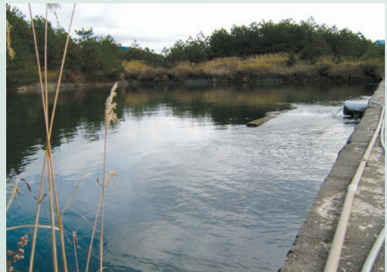
引自合歡山水源頭之儲水池（攝於民國75年）。

道路維修方面（產品之運出及材料之運進）為保持進出之暢通，方便旅行，農場除將主幹道拓寬鋪設柏油，並配合觀光將原主幹道拓寬為雙線道，並爭取地方政府補助，將通往各莊之產業道路興建級配料道路（AC路面道）。