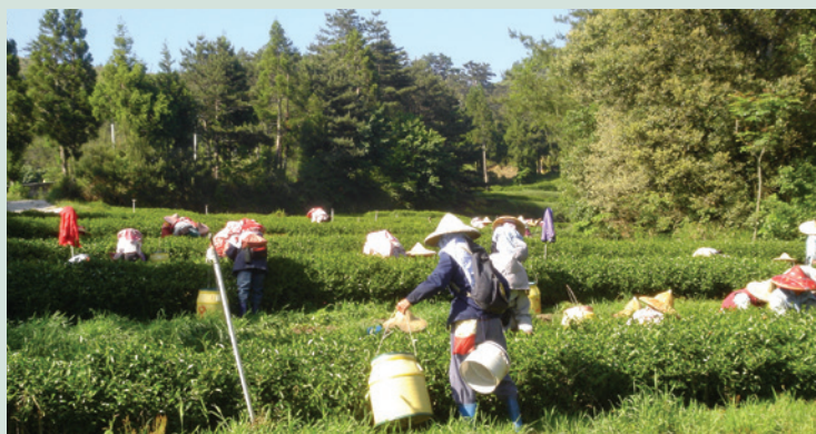
採茶之盛況（攝於民國94年）。