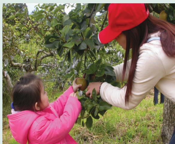
果樹認養活動-親子採果樂。