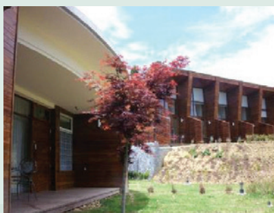
楓林雅築小木屋工程完成現況。

95年露營區聘請設計師規劃改建完成，增設星座營位、高架營位、殘障衛浴、解說牌、觀星台及烤肉區，