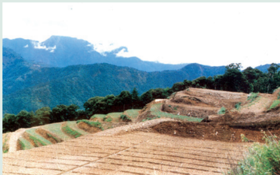
水土保持之平台階段（攝於民國74年）。