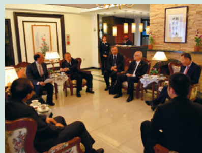
李主任委員翔宙與泰方貴賓於農場松廬敘舊。