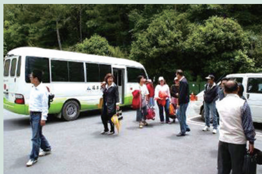
推出蘋果號套裝專案，提供遊客更便利及放鬆的旅遊行程。