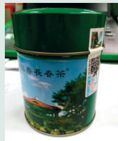
防偽標籤茶罐示意圖。