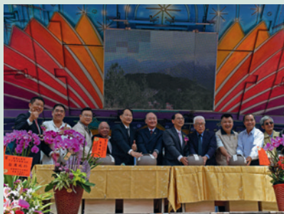
60週年場慶，福壽長春茶封茶紀念儀式。

農場於民國106年5月1日適逢成立60週年，特別擴大舉辦場慶慶祝活動，邀請輔導會曾前主任委員金陵、董主任委員翔龍及本會李副主任委員文忠參加。外賓包括臺中市政府林副市長陵三、消基會主任委員柴教授松林教授、地方公務單位、旅宿業及茶商會等計300餘人參加，場慶過程順利圓滿。