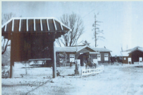
草創時期（民國50年）之場本部。