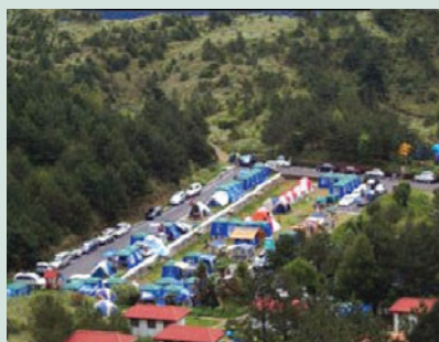
露營區以生態景觀吸引遊客前往，每逢假日人潮湧入，非常熱鬧。