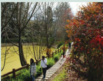
鴛鴦湖現已為遊客來場必定造訪之景點。