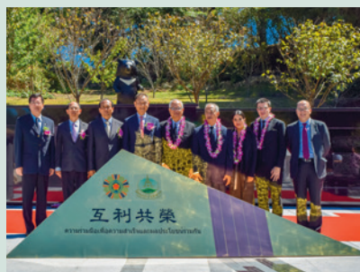
華泰農業交流紀念園區揭幕貴賓合影。

園區內除增加遊客更多休憩空間外，並讓人緬懷這段兼具「人道援助」與「務實外交」的成就，期望基於前人成果，廣續兩國人員互訪，提升農業技術及觀光遊憩品質，展開互利互榮的新合作關係，更為農場六十周年慶增添喜氣與榮耀。