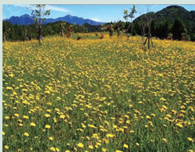
國土復育區另行撒播種子，花季時花海錦簇，非常熱鬧。