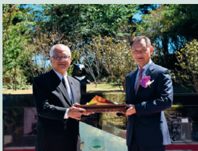
李主任委員翔宙贈與泰國皇家計畫基金會副主席Dr Pongsak Angkasith互利共榮紀念碑座。