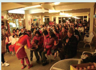
每年定期舉辦各類具特色之精彩活動，吸引遊客來場。

考量農場位處偏僻高山地區，為擴大服務範圍並方便遊客來場，98年開始推出蘋果號團體專車接送服務，採行全省接送、團進團出、食宿景點全程安排服務，有效縮短遊客到場交通時間，大幅拓展及增加旅遊事業經營績效，並達成與清境、武陵等友場間策略聯盟，蘋果號團體方案曾於105年8月底因故停駛，直到107年5月復駛，截至107年9月底已有23車次，共計服務460位遊客。另農場利用高山壯麗景觀、宜人氣候及人文特色，推出以唐莊為住宿設施之1至2週、1個月等優惠long stay住宿案，推出後反應熱烈客源逐漸增加，滿足各類族群旅遊需求。