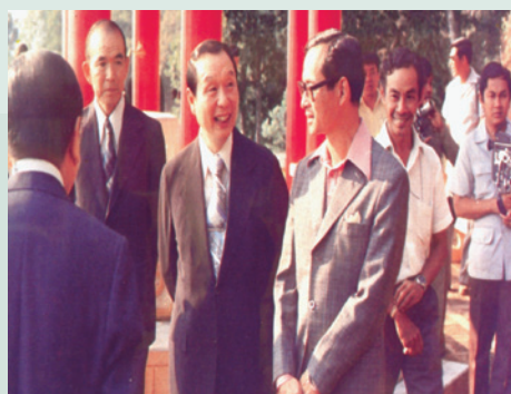
民國68年趙主任委員（左3）與泰王（右3）及畢沙迪親王（右2）合影。