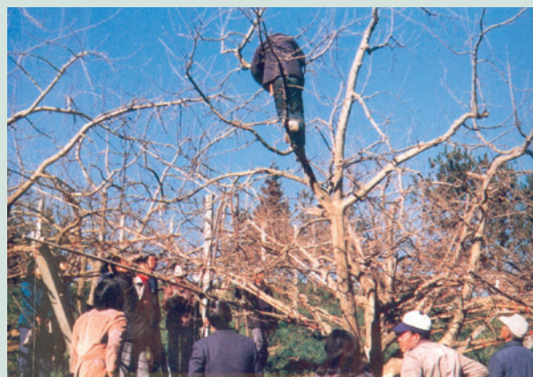
民國70年學員們實地觀摩修剪。