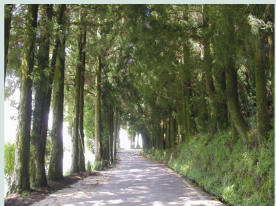
青蔥蔚鬱主幹道（攝於民國95年）。