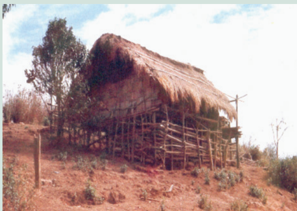
草創時期（民國47年）之茅草屋。

農場成立以來即依據輔導會安置條例，於場本部及華崗分場安置場員，至78年止，共安置場員361戶，有眷場員配耕0.75公頃，無眷場員0.5公頃，為使場員進場後即可從事生產，場員進墾前均先完成土地規劃、構築道路興建莊舍、灌溉設備及飲用水等，並供給必要之生產與生活設備，以及無息貸款，場員生產之所得悉歸榮民所有，政府及農場並無收取任何服務費用，83年奉令辦理場員土地放領，經歷數年於91年結束，共計放領357戶，面積266.7公頃。