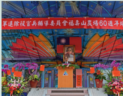
60週年場慶，巫場長致詞。