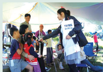
邀請各大媒體來場採訪，提高旅遊知名度。