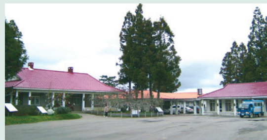
復古風的場部辦公室（攝於民國90年）。

農場現有直營農地計菜地30公頃、果地73公頃、茶園14公頃，共計117公頃，為配合國土復育政策現僅保留29公頃之果園、14公頃之茶園。