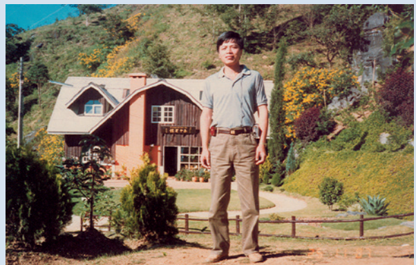
民國76年12月奉派至泰國，參與泰皇山地計畫（攝於泰國安康農場）。