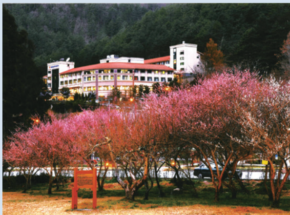
民國91年興建完成之武陵農場第二賓館。