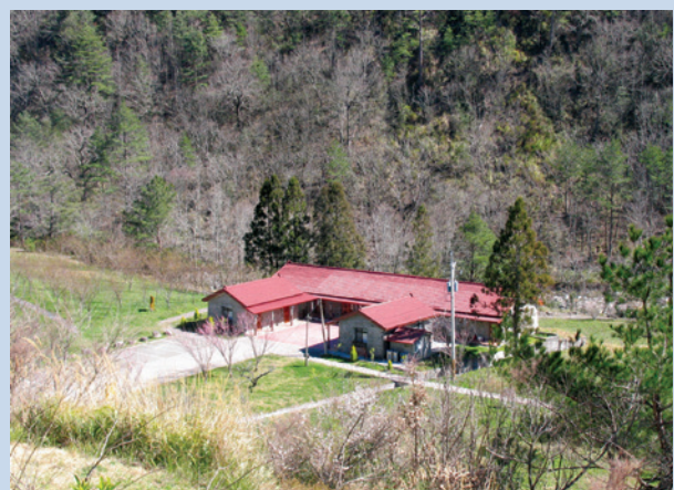
第6區農莊（攝於民國95年）。