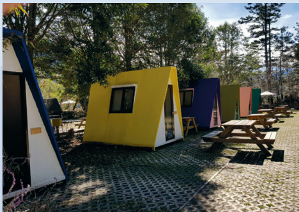
馬卡龍色系築夢屋，繽紛的彩虹三角屋，吸引了不少年輕人來拍照。

汽車停於木棧板營位旁，木棧板後面有獨立可使用的木桌椅，拿取與收納方便許多，每個營位均增設電源插座，可供營位使用，解決遊客用電需要。本著服務便利露營區營友，除維護營地整潔、營區安全外，逐年更新露營桌及棧