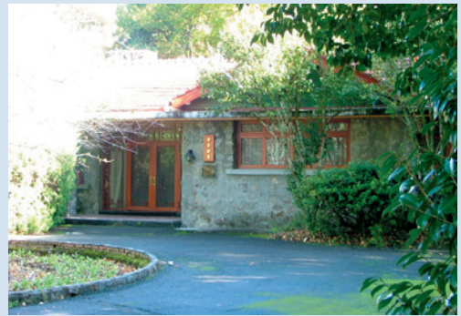
蔣公行館（攝於民國95年10月）。

櫻花鉤吻鮭與七家灣遺址是武陵地區最具稀有性與獨特性的生態旅遊資源，稀有的臺灣國寶魚「櫻花鉤吻鮭」是全世界