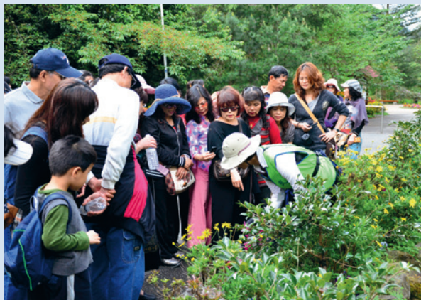
南谷遊憩區之導覽解說，提供生態旅遊之深度導覽，遊客全程參與聽得非常入神。