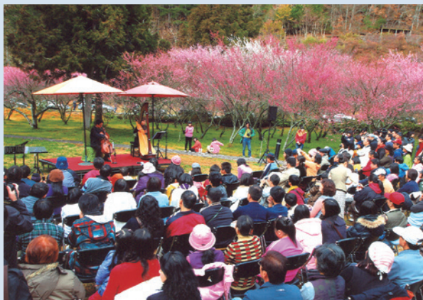
櫻花季舉辦之音樂會。