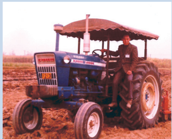
民國60年間採取機械化作業，提升農耕工作效率。