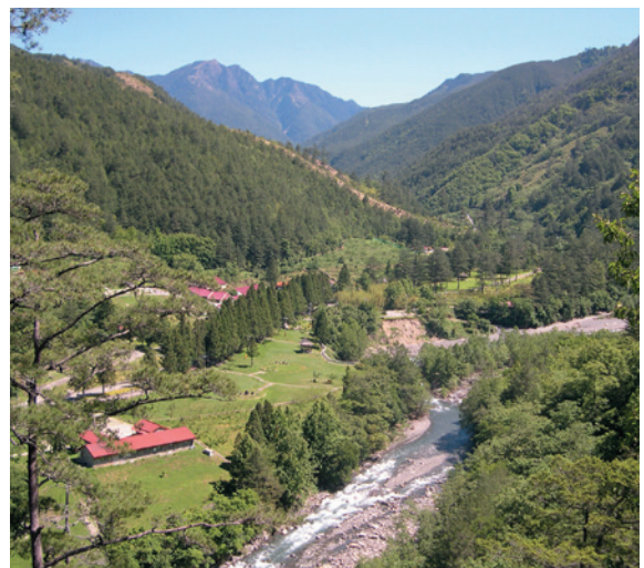
武陵農場南谷風光。（攝於民國95年10月）