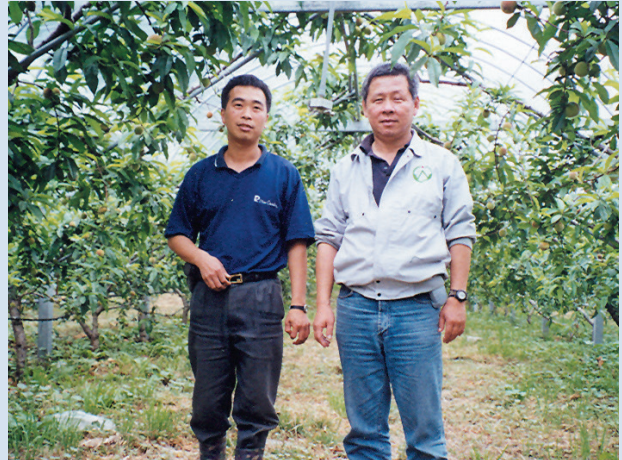
民國90年1月呂副技師（左1）指導農民果樹管理技術。

呂副技師除參與農場「國土復育計畫—棄耕返林」的規劃外，並負責執行逐年收回菜地、果園、茶區的相關作業以及後續的植生造林工作。「棄耕返林」代表長久以農業生產為主的經營方式，將有大幅度的改變。停止大範圍且密集的農業生產，除了可以降低農藥、肥料對於環境敏感地帶的污染，並可增加綠地提供野生動物棲息，進一步與農場既有的櫻花鉤吻鮭保育活動結合，發展更具深度的生態旅遊，使農場的經營更加多元化。呂副技師深知