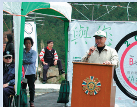
民國94年3月曹場長主持櫻花鉤吻鮭復育植樹活動致詞。