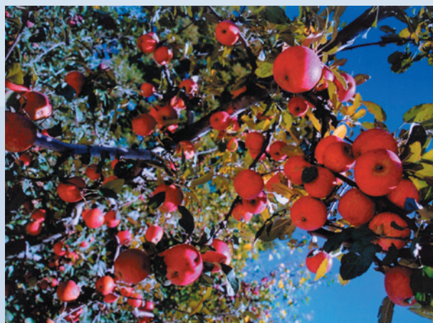
第6區矮性蘋果園結果情形（攝於民國86年）。

民國58年為鼓勵並提升生產效率，訂定農場生產績效獎勵辦法，並興建完成農場果品包裝廠及興建完成文康福利中心及園藝工作隊宿舍，大大改善員工生活品質。59年完成場區內灌溉系統，以利農業生產，並規劃完成北谷蔬菜地，三合院石頭屋之農莊，分誠、善、親、民4莊及就地安置之忠莊計5個莊，輔導場員種植、生產。繼之於60年間推行農業機械化作業，有效提升效率，節省人工。訂定銷售辦法，配合榮民供銷中心作業，統一標售