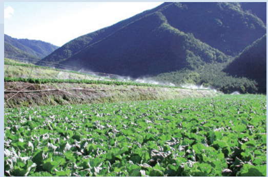
收回前菜地種植狀況。

依據行政院民國94年9月核定之國土復育計畫，武陵農場已自93年起逐年收回農耕地，於95年底全面停止菜地農業經營。果樹、茶園於96年底完成停耕作業。其中菜地種植原生觀賞樹種，使其兼具造林與景觀美化之作用，果、茶園部分則作為生態教學及品種觀察區，轉型為教育生態農園，農場整體規劃已將場區範圍區分為南谷遊憩區、中谷景觀林帶、北谷農業景觀區、自然保育區、原野遊憩區，執行國土復育計畫後，廣續規劃高山植物生態園區及休閒農業區，第4區高山植物園區於94年10月14日開工，95年3月初完工，於同年7月21日舉行盛大開幕儀式，並加強導覽解說之功能，期許國人對武陵地區有進一步之認識，滋生對環境保護之認同感。自94年起陸續收回委營土地停止開發生產進行復育造林，並持續撫育造林地，配合臺中市政府、雪霸國家公園管理處執行國寶魚櫻花鉤吻鮭護育計畫，以落實生態保育及環境維護工作，確保資源永續利用。