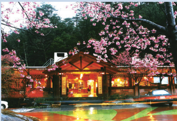
武陵農場內農特產品中心一茶莊。