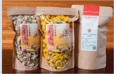
武陵高山杭菊（袋裝）。

高山杭菊種植，近年來，經國立中興大學農產品農藥殘留檢測中心農藥殘留量檢驗結果，均達到「未檢出」水準，證明杭菊除以特有風味著稱外，實屬兼具「安全健康」之珍稀飲品。杭菊盛開期，為提供蒞場遊客體驗不一樣的遊程，農場亦辦理採菊樂活動。