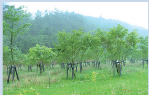
收回後執行植生造林成果。