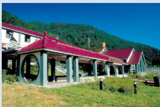
民國84年興建旅遊服務中心以服務遊客。

因應時代變遷，於民國78年推動農場轉型經營，改善生產條件，加強水土保持，改善環境綠美化，積極擴充觀光休閒設施，逐年逐步推動觀光設施軟體建設；至88年起進入轉型觀光發展時期，積極推動觀光旅遊、生態保育，使農場正式進入以生態觀光旅遊為主之轉型經營階段。