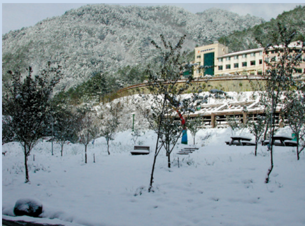
武陵第二賓館雪景（攝於民國93年3月）。