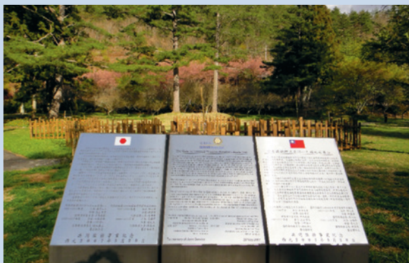
中、英、日文的自導式解說牌。