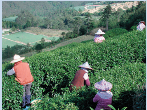
第4區高山茶園（攝於民國92年）。