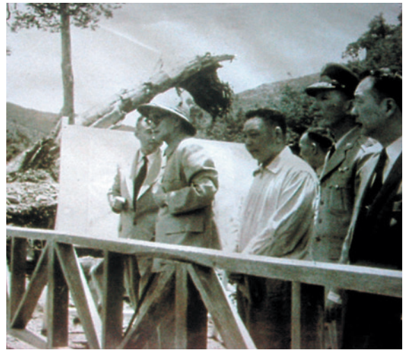
民國50年先總統蔣公及經國先生實地勘察原武陵墾區。

武陵農場自70年起，面對社會經濟環境變遷、配合政府生態旅遊及國土復育政策，以自然景觀與生物多樣性，結合豐富的農業資源相輔相成，逐步轉型為觀光休閒與生態旅遊。目前已朝生態旅遊發展定位，未來將持續向「營造國際保育形象」的生態旅遊目標邁進，以達永續經營。