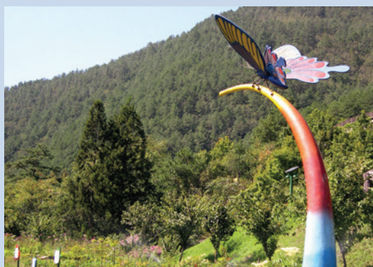
蝴蝶館（攝於民國90年）。

饒富生態資源與自然景觀的武陵，目前觀光活動為觀察特殊自然景觀、動植物觀察、賞雪、攝影、寫生、健行、登山、生態導覽等。其間，距今3~4千年的七家灣文化遺址及國寶魚櫻花鉤吻鮭，更