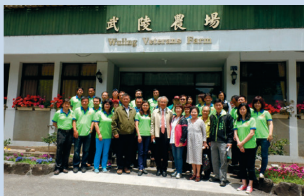
宜蘭東區扶輪社會議後合影留念。