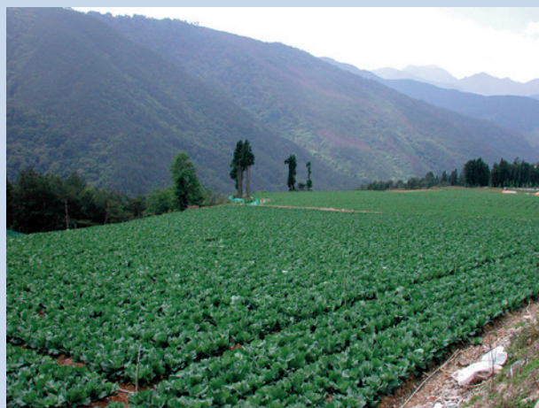
高麗菜園（攝於民國93年）。