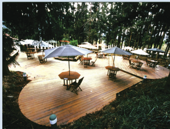
露營區管理中心旁的「森林咖啡吧」。