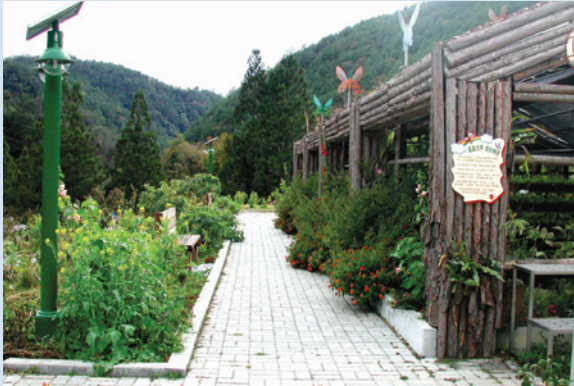
藥用植物園區（攝於民國95年）。

充滿著大自然生機與人文生態。武陵景緻秀麗迷人，重山峻嶺，雲霧氤氳，林野挹翠，流水悠碧，親樹賞鳥，聽波觀魚，無不生機盎然，動靜之態，皆引人入勝。