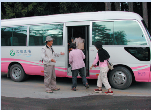
民國95年6月蝴蝶號生態旅遊導覽解說巴士開始營運。

物，路線自武陵賓館→迎賓橋→賞鳥步道→溪畔步道→櫻花鉤吻鮭復育中心→武陵農場行政中心→雪霸國家公園遊客中心，約4小時。中谷步道1條路線，路線自億年橋→第二區茶園→農莊文物館→兆豐橋→武陵製茶廠，約1.5小時。第四區露營區及高山植物園區1條，為大地體驗路線。桃山瀑布路線因深受民眾的喜愛，常有遊客詢問，107年度特別增加對志工的訓練，新增行程導覽解說，並於107年度暑假期間推出桃山瀑布導覽行程，活動採預約制，由國民賓館出發，利用園區遊園巴士將參與的客人載送至武陵山莊起點出發，行程約3.5小時，使遊客對於桃山瀑布的生態與健康芬多精森林之旅有了另類行程的參與，並建置29個生態旅遊解說站，完整詳實的提供專業解說，使遊客瞭解、欣賞、體驗及享受武陵地區的自然之美，藉以引導國人重視生態教育與環境保