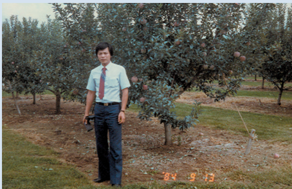
民國73年8月奉派至日本，考察農業（攝於日本岩手縣蘋果試驗場）。

81年陞任技師、調休閒農業組服務，86年代理休閒農業組長，88年擔任休閒農業組長，並依輔導會之政策指導，積極辦理農場轉型發展休閒農業。任內透過農場第1、2期發展觀光整體規劃，分年逐次完成環境保護措施與發展觀光休憩設施，提供各項旅遊服務，滿足遊客需求。期間並積極辦理武陵二