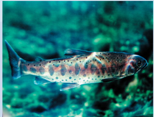
民國73年農委會公告櫻花鉤吻鮭為珍貴稀有動物並命名為國寶魚。