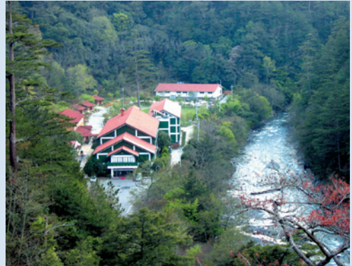
民國70年武陵第一賓館加入農場營運。

在生態保育方面，鑑於七家灣溪流域櫻花鉤吻鮭這項珍貴的自然資產恐有滅絕危機，政府主管機關與相關學術單位，遂自70年起，積極推動一連串保育措施。農委會特於73年依文化資產保存法，公告櫻花鉤吻鮭為珍貴的稀有動物，並命名為「國寶魚」；74年農委會積極推動對櫻花鉤吻鮭的人工復育以及放流工作，以增加族群數量；78年又依當時通過之野生動物保育法，將櫻花鉤吻鮭列為瀕臨絕種保育類野生動物；81年雪霸國家公園成立，七家灣溪集水區劃入國家公園生態保護區內，由國家公