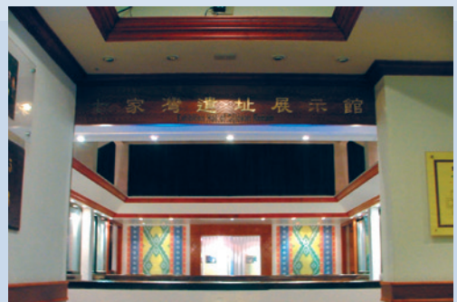
七家灣遺址展示館（攝於民國95年12月）。