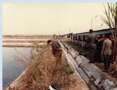
農漁牧綜合經營全貌。

為加強直營生產，於72至73年間場部完成開闢魚池9公頃。種植葡萄5公頃、培植蘭花0.5公頃、牧草100公頃等，開始辦理直營生產，並探求技術經驗，有成效之項目推介場員作生產參考。當時直營生產以水產養殖成效較佳，推介場員輔導生產，餘3項成效未臻理想。