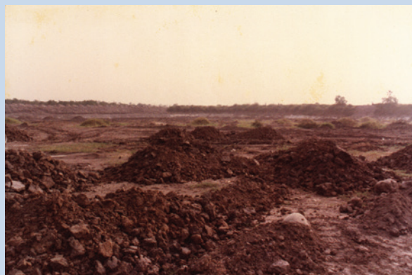
民國58年土地開墾後客土改良情形。