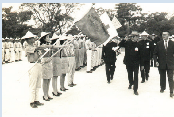
諶場長（右3）陪同輔導會會長官視察永安演習。