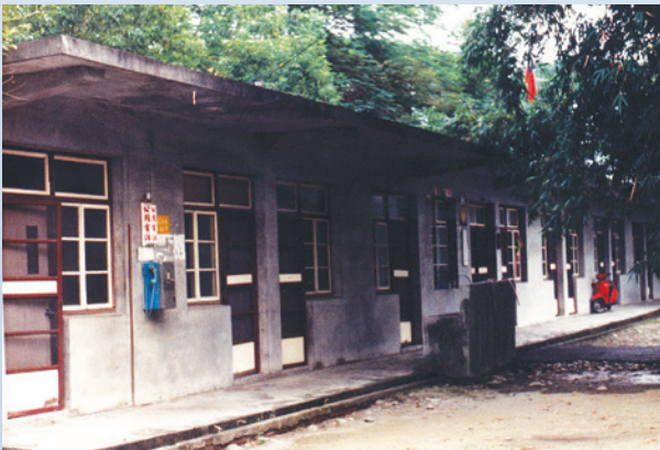
民國69年單身場員宿舍（鋼筋水泥宿舍）。