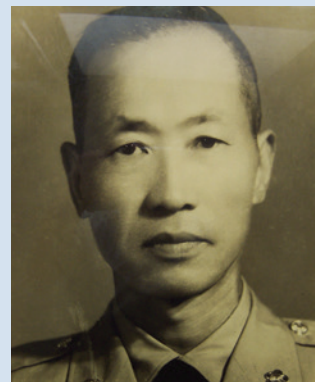
許場長著戎裝時英姿。

許場長湖南省永興縣人，民國9年2月9日生，陸軍官校16期、陸軍參軍大學正6期、三軍聯大戰爭學院正15期，歷任團長、處長、師長。任內繼續推展農業機械化，更新農業機具。與農林廳種苗改良場合作種植採種玉米50公頃及直營種植銀合歡10公頃。