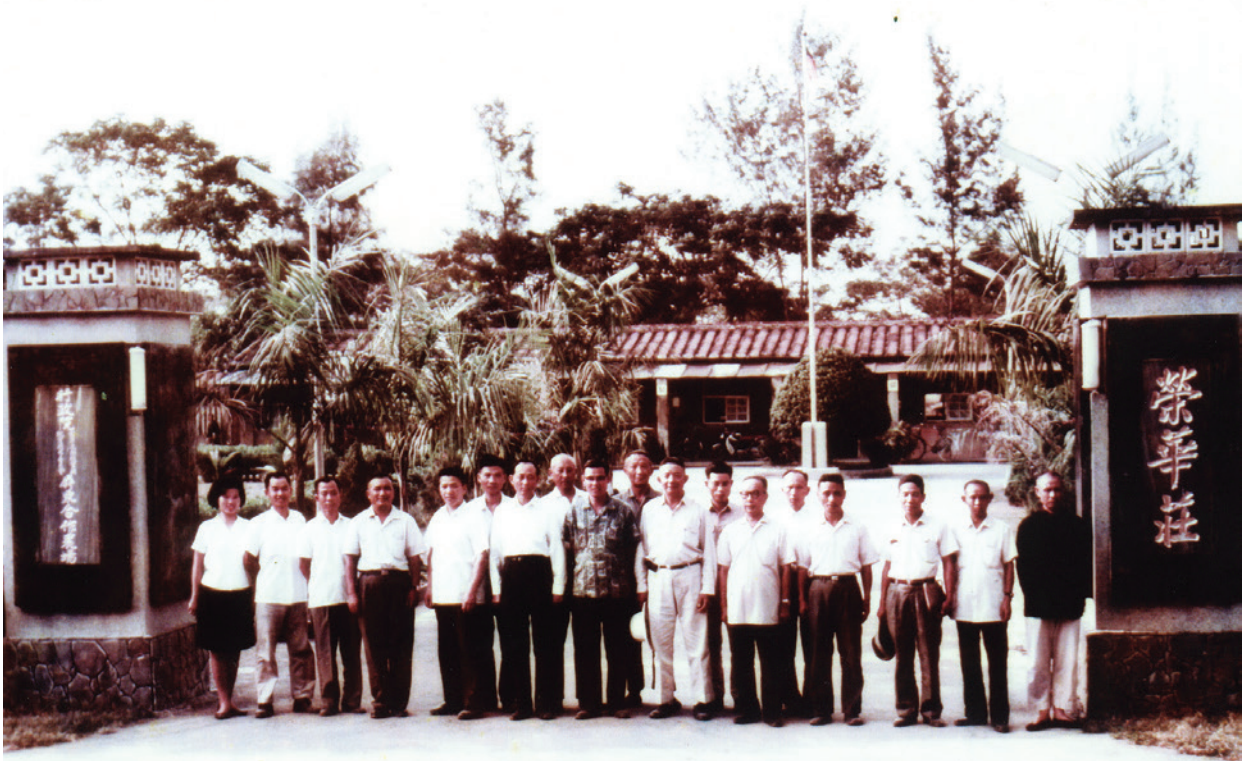
主任委員經國先生命名場部為「榮華莊」。

屏東農場成立於民國43年11月1日，前身為國防部所屬隘寮、竹田大同合作農場，主要任務是「安置解甲歸田之退除役官兵，開墾荒地，從事農業生產，以期安居樂業，繁榮社會，裨益國家經濟建設之發展」。51年7月1日將「隘寮大同合作農場」及「竹田大同合作農場」合併，更名為「屏東大同合作農場」，第1任場長由葉藹青先生擔任，場本部設置於屏東縣長治鄉隘寮。51年11月蔣主任委員經國先生巡視農場時，將場部所在地「隘寮」，命名為「榮華莊」。52年3月20日農場更名為「行政院國軍退除役官兵輔導委員會屏東合作農場」；並於58年11月1日正式定名為「行政院國軍退除役官兵輔導委員會屏東農場」。場本部新建辦公室於59年1月8日落成啟用，設場至今已有51個年頭，並於87年7月奉命簡併高雄農場（高雄農場成立於44年3月，場部設於高雄市楠梓區）。於102年11月1日整併至彰化農場，成為屏東分場。