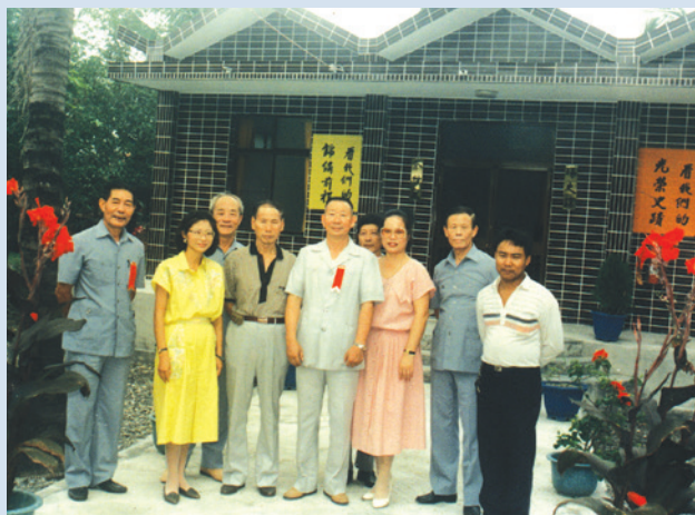
民國77年場史館新建完成啓用。

87年7月16日簡併高雄農場，並辦理人員精簡，簡併後高雄分場由輔導會投資6,300餘萬元整建，以經營休閒農場為主，爾後農場正式邁入觀光休閒與農業生產兩大主體之經營。