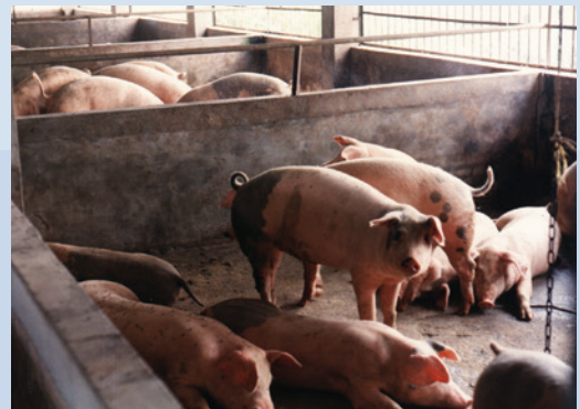
農漁牧綜合經營養豬情形。