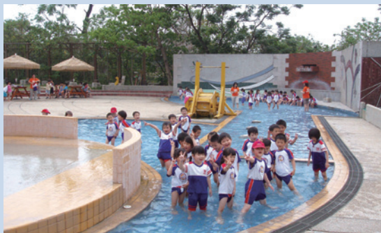
民國89年間整建後增加之遊憩設施。

隨著時代變遷社會進步，傳統農業已不敷經營需求，為求突破困境，增進農業經營收益，朝休閒農業發展是經營的趨勢。蒙輔導會政策指導及鼎力支持下，於民國87年度起分4年期投資金額6,300萬元，歷經2年修建，將高雄分場整建為觀光休閒農場，轉型經營休閒遊憩事業。