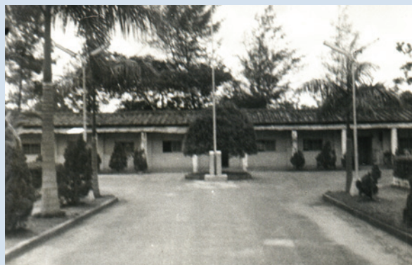
民國43年11月設立場部辦公室。