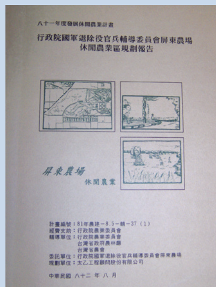
民國82年籌辦休閒農場整體規劃計畫書。