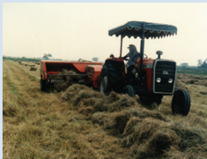
大面積牧草栽培機械採收情形。