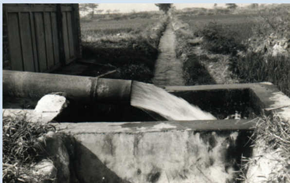
灌溉水井抽水情形。