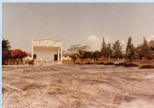
新建榮華堂廣場施工情形。