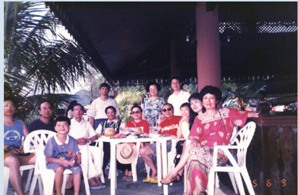
李副場長（左5）獲選民國84年模範公務人員接受行政院招待至馬來西亞遊玩時留影。

補助250萬元，建設汾陽社區排水溝，柏油路、路燈、社區活動中心設備等公共設施，在榮華莊爭取設置自來水，改善飲水衛生績效卓著。