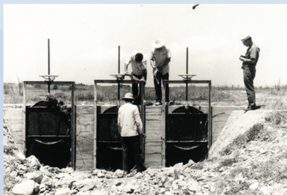
專家指導興建灌溉設施。