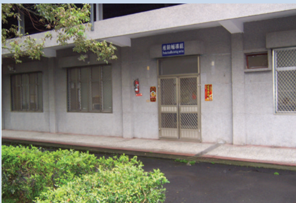
原場部會議室（現為綜合辦公室）。