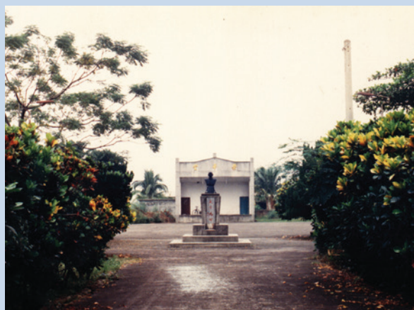
民國53年完工之榮華堂全貌。