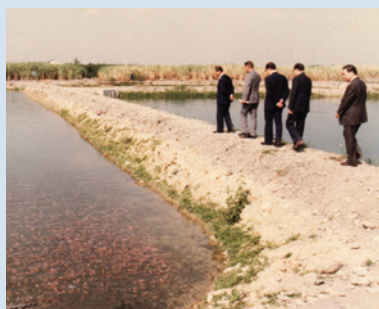
直營生產養殖尼羅紅魚情形。