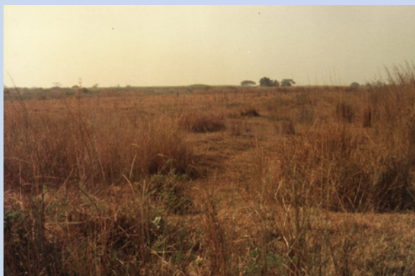
民國57年農場土地原均為荒蕪之砂礫河床地。