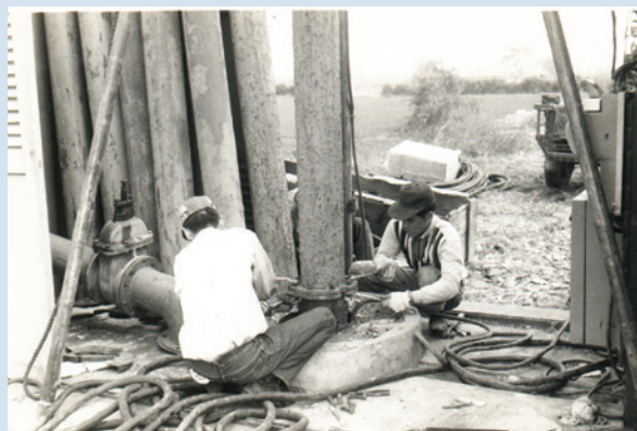
專業技術人員指導安裝灌溉水井設施。

早年農場大部分的土地都是河川沖積所形成之荒蕪砂礫河床地，因砂石多、土壤少，水土保持困難。場員們從雙手搬石頭、修築灌溉排水溝渠做起，初期以畜力耕作，到後來的農作機械化，都在輔導會積極規劃及資助，以及農業復興發展委員會、水利局等其他各單位的經費補助與技術協