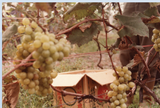
民國73年葡萄栽培結果情形。

為加強直營生產，於72至73年間場部完成開闢魚池9公頃。種植葡萄5公頃、培植蘭花0.5公頃、牧草100公頃等，開始辦理直營生產，並探求技術經驗，有成效之項目推介場員作生產參考。當時直營生產以水產養殖成效較佳，推介場員輔導生產，餘3項成效未臻理想。