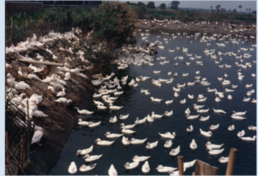
民國70年間推廣農漁牧綜合經營養鴨情形。

70年間政府推廣漁牧綜合經營政策，輔導會為輔導榮民提高生產收益，經政策輔導成立漁牧綜合經營區，面積8.4公頃，興建豬舍14棟（每棟飼養種豬8頭、肉豬60頭），搭配每口6分地之魚池經營漁牧生產。