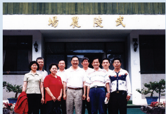
李副場長（右3）率員工赴武陵農場觀摩合影。

「人生如戲，戲如人生」，李副場長表示：進入輔導會農場，即抱定服務的人生觀，服務30餘年的公職生涯中，在輔導會農場擔任服務的角色，在每個工作崗位上，均能全力以赴，戮力從公，內心時常自我吶喊著：「為輔導會農場工作，是一項榮幸，也是一份責任」，不斷自我激勵，希望在人生的舞臺上所付出的苦心及努力，沒有辜負長官們的期望，如此才敢輕輕地說，沒有白白地虛度此生。