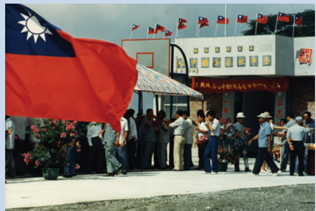
榮華社區活動中心於民國74年10月落成啓用。

69年間擴大推展農業機械化，新購曳引機、插秧機、聯合收割機、烘乾機、噴射霧機、動力脫谷機各