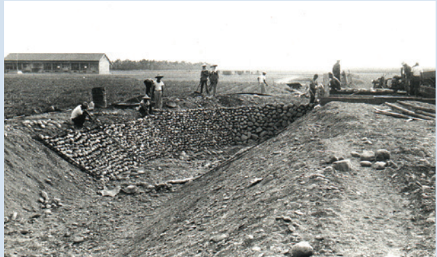
民國60年修築農路及灌溉排水溝施工情形。

助下，進行水利設施的建設。民國57年10月至73年間土地改良484公頃，新鑿灌溉用深水井14口及農水路之配合興建，完成土地開墾、改良之艱鉅任務。在農場幹部們積極協助，長期辛勤耕耘的開墾下，使滿佈砂礫的土地轉變成有生產效益的良田，奠定農場經營發展之良好基礎。