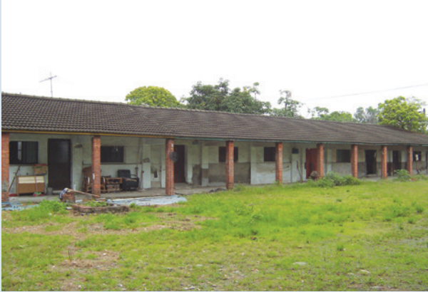
單身場員宿舍（磚造瓦屋）。