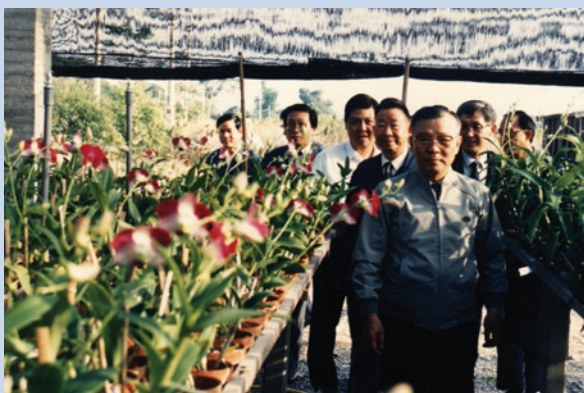
民國73年輔導會許主委歷農先生視察秋石斛生長情形。