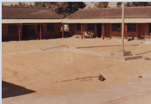
民國50年代本場建造的四合院式農莊，農莊的中央為曬穀場，農莊為本場的生產單位亦是場員居家安定生活的地方。

在增加場員生產能力、改善生活方面，61年邀請新竹改良場、新豐鄉公所、農會各主管、技術人員，及農莊代表等，召開機械墾植水稻一貫作業協調會，62年策劃水稻生產以機械代替人力實施一貫作業，節省人力，提高產量。62年3月水稻生產機械化一貫作業開始，共出動插秧機6臺，完成青埔區、竹南區插秧工作，作業面積共計達53.5公頃。63年為場員購置碾米機、碎石機各1台，供碾米及碾飼料用，以節省人力及時間。64年經