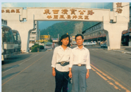
榮技術員於橫貫公路夫妻合照。