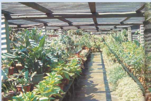
民國70年—80年間本場經營花卉有蘭花類、木本花、草本花、庭園花、蔓葉植物、蔓藤類、椰子類等各式大小花卉數百種。