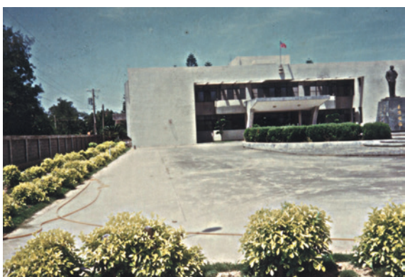
民國74年6月建造完成的新竹農場辦公室。

58年11月1日與「苗栗合作農場」合併改組，場銜改為「行政院國軍退除役官兵輔導委員會新竹農場」，場址位於新竹縣新豐鄉青埔子，轄區範圍北從基隆，南至苗栗。