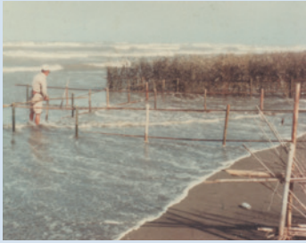
民國47年場員以攔淤法使海水流經時速減低，讓泥沙沉澱下來，使灘地漸漸變高。