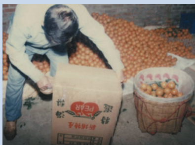
民國60年-70年間場員種植柑橘收成情形。