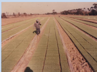
民國60年場員在水稻耕作區施肥情形。