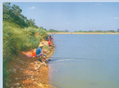
民國70年為發展水利及副業於青埔子興建大蓄水池（兼釣魚池）。