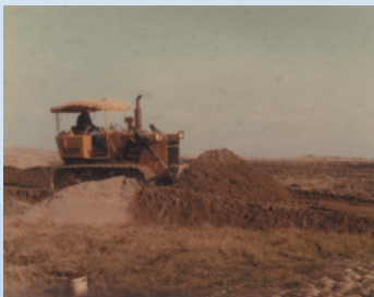
民國48年新竹海埔新生地開發情形。