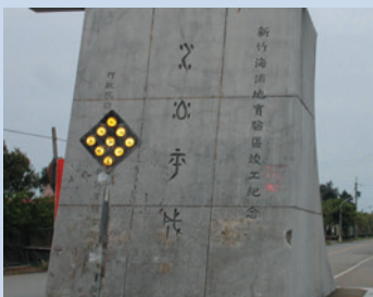
民國50年設立之海埔新生地開發紀念碑。

向臺灣省政府農林廳申請補助32萬餘元，興建育苗室（40坪）1棟，有育苗箱8,000個，此後不僅育苗工作方便，同時尚可代鄉民育苗。65年1月輔導會補助28萬餘元興建農具倉庫1棟（20坪），並購置各項農機保養工具。68年輔導會補助20萬元，改善竹南574公尺圳路工程及完成開鑿第12莊之水井工程。82年辦理中壢22莊自來水設施改善工程，動用經費43萬9,000元。