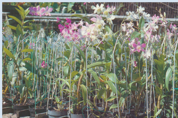
民國70年間本場花卉中心蘭花盆栽培情形。

花卉中心除生產栽培銷售花卉外，每年亦為行政院、國防部、輔導會、教育部等單位設計各種慶典花卉擺飾及園藝設計。因蘭花多姿優雅且具特殊的香氣，素有「王者之香」的美譽，自古就為國人所喜歡，在80年後被民眾大量但粗糙的繁殖，所生產的蘭花普遍都感染病蟲害而造成市場價格慘跌。花卉中心在市場低迷不振的情況下，為顧及場員的生計轉而往水稻育苗的栽培與新品種的開發方向發展，並於83年逐漸結束花卉中心的業務，人員均歸併入場部。