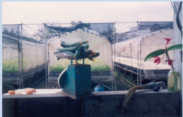
民國80年間種植之水耕蔬果碩大甜美。