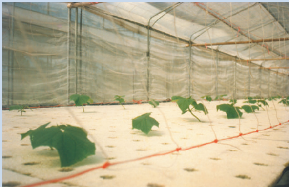
民國80年間發展水耕蔬菜種植情形。

為照顧場員生活，於59年完成青埔區整體計畫，並設立17至22莊為單身場員農莊，23、24兩莊為有眷場員農莊。60年完成青埔子社區之各項建設，計建