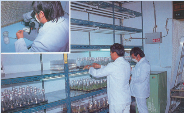
民國70年間中壢花卉中心工作實景。

中壢花卉中心成立於民國69年8月，隸屬於生產組，為直營事業，派有副技師1人，負責全中心之花木繁殖、培養、銷售等工作，另技術員、技工、工