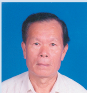
榮技術員的個人照。

談及在農場服務時最難忘的事，是當農場在中壢成立花卉中心時，榮技術員以本身在花卉栽培上的學問與專業知識，對花卉種子之培育、幼苗之栽培，無不竭盡所能貢獻心力與技能，將花卉栽種得非常漂亮，花卉銷售的成果也非常的好。除了花卉的栽種外，印象最深刻的事就是拓土挖石、開渠引水之事，當時的農場土地大都是接收來自於日據時代的軍用飛機場，土層的下面都是一層一層的大石頭，場員們非常辛苦的在自己所屬的耕地上一扁擔一扁擔的將地表下的大石頭挖除抬走，每一寸土地都是流血流汗換來的，挖除了石頭、石礫雜物後還要在堅硬的土地上建造數條能引水灌溉阡陌良田的溝渠，當時的場員真的是非常辛苦。