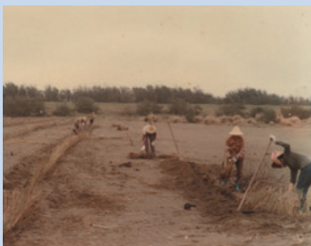
民國48年場員於新竹海埔新生地場員圍墾實景。