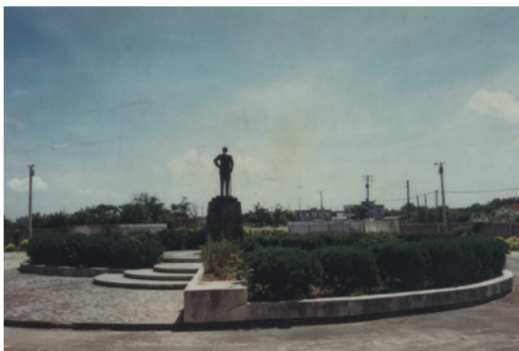
民國74年6月建造完成的新竹農場場區。

51年7月1日奉令由臺灣省合作事業管理處改隸輔導會復管，場銜改稱為「臺灣桃園合作農場」，主要任務為安置國軍退除役官兵就業農墾，使其達成自給自足、改善生活、立業成家、安定社會之目標。