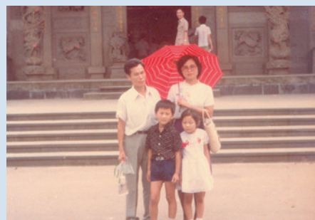
榮技術員全家福照。