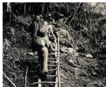
西寶農場場員早年運補糧食之艱辛作業情景。