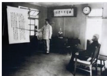
民國48年先總統 蔣公(右)視察西寶榮民農場，聽取邵場長子煌業務簡報之珍貴歷史照片。