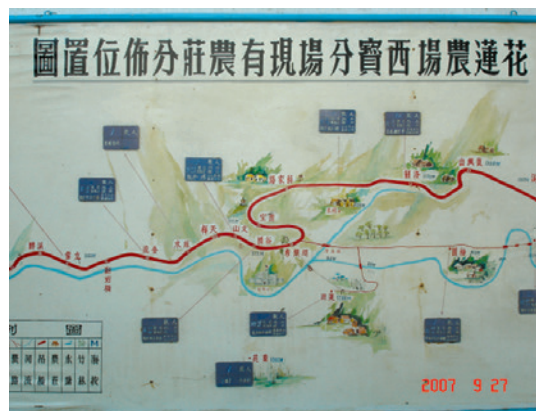
西寶分場早年農莊分布位置圖。

民國46年9月輔導會為供應東西橫貫公路築路員工新鮮蔬菜之需，於花蓮縣秀林鄉天祥地區成立西寶榮民農場，48年3月擴大梅園、蓮池、文山等墾區範圍及安置人數，51年再擴充竹村墾區，奉行政院正式核定成立西寶榮民農場，安置開闢中部東西橫貫公路參加築路之榮民。初期計在立霧、合流、綠水、文山、谷園、蘭苑、蓮池、竹村、松岡及洛韶等地點成立11個農莊，種植蔬菜、飼養禽畜，供應開路人員食用為主。場員在這些農莊開山闢地備極辛苦，山區交通不便，生活條件極端不佳，但我榮民袍澤不畏艱辛，將千萬年來之蠻荒地區，開闢為田園，並逐步建設成為人間仙境，58年2月1日撥入花蓮農場改稱西寶分場。