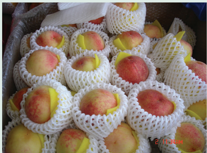
西寶農場場員種植碩大甜美的水蜜桃。

20年的場員生活，稍縱即逝，回憶栽種水蜜桃的日子，全盛時期西寶地區種植面積超過百公頃。近年因為入山開墾的老榮