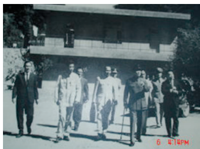
民國51年間老主任委員(右1)陪侍先總統蔣公巡視西寶榮民農場之珍貴歷史照片。