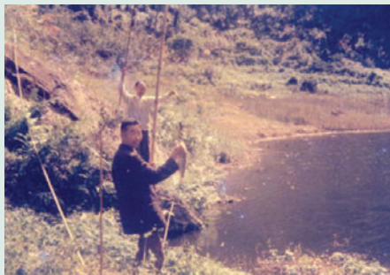
老主任委員經國先生譽為天下第一奇景－蓮花池，早年魚類資源豐富，可供場員蛋白質食物來源。