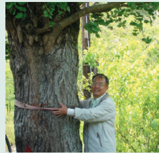
見證竹村發展史之百年臺灣第一巨大珍貴銀杏樹。