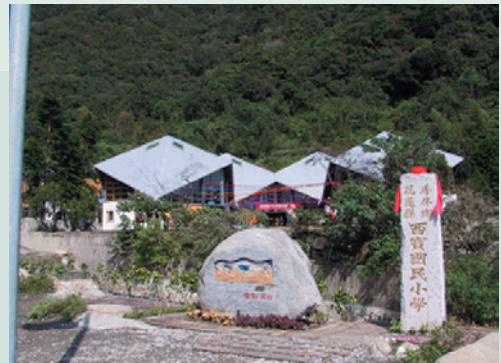
聞名中外森林實驗小學—西寶國小美麗的大門景觀。

民國56年前老主任委員經國先生為協助西寶榮民、場員改善生活環境，每戶贈送60棵水蜜桃及二十世紀梨樹苗，總計有6,000棵樹苗及每1平台1具石磨，供榮民種植大豆磨豆漿、玉米食用，增加營養，增強體力。也由於經國先生的先知卓見，開啟竹村地區溫帶果樹：水蜜桃、蘋果、二十世紀梨及加州李等溫帶水果的盛名。竹村農民更在70年間在第4梯台推廣高經濟的高冷果菜如梅、青梗白菜、紫色甘藍、球莖甘藍、結球白菜、甜椒、四季豆、蠶豆種植及蔬菜種子採種等農業生產，這些產品品種優良，因種在高山寒冷區，不需噴洒農藥，所有產品鮮美都可生食，深受消費大眾歡迎，既能增加收入又能滿足老饕的嘴與胃，至今西寶農場水蜜桃與高山蔬菜之美名「榮民生產、品質保證」仍留存在花蓮當地民眾心目中。據71年西寶分場資料顯示：西寶地區榮民平均每戶每月收入約1萬3,000元，是所有會屬農場單位收入最高的榮民，「造