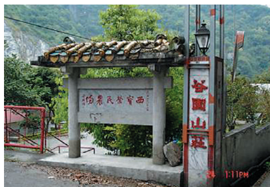
西寶分場谷園山莊之「西寶榮民農場」名銜，係民國48年由黨國大老書法名家于右任所書墨寶。