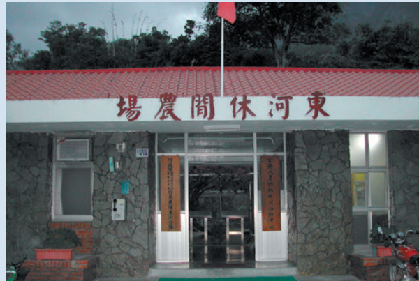
民國85年原辦公房舍整建為休閒農場之服務中心外觀。

整建桃莊庭院、兒童遊戲區等，農場始終以一步一腳印之踏實穩健的步伐努力經營，方有今日觀光休閒農場之雛型。