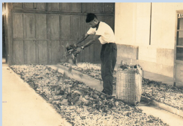
民國59年人工飼育稚蠶。