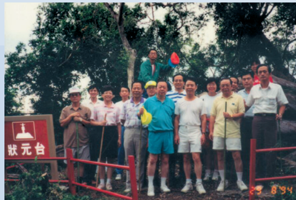
民國85年觀光局人員應本會邀請履勘東河休閒觀光資源。