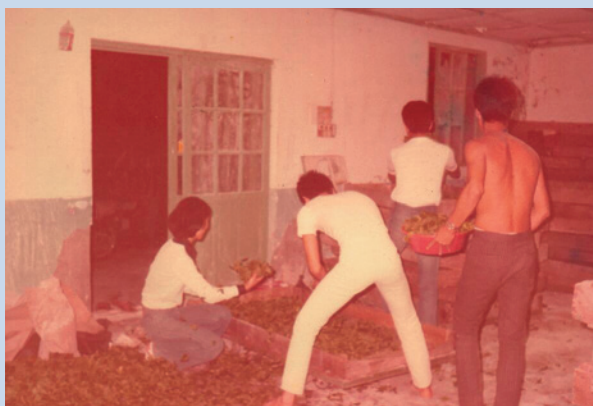
民國59年人工飼育壯蠶。

東河農場之桑樹均種植在山坡上，餵食蠶寶寶所需的桑葉原本就採運困難，加上榮民場員歲數逐年增長，體力日漸衰退，後又因臺灣蠶業日薄西山；74年開始場員轉種植芸香科植物，因東河山區適合生長文旦等果樹，故「東河文旦」的口碑一直維持至今。