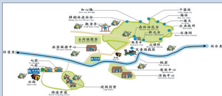
東河休閒農場導覽圖。