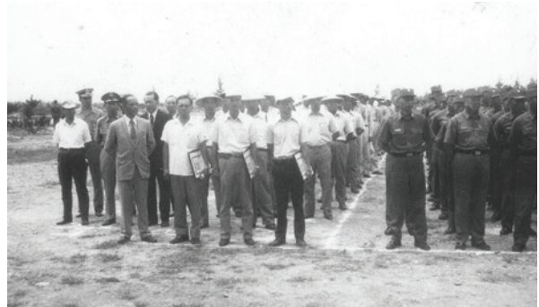
民國59年8月場員參加永安演習。

農場成立之初，輔導會將大南墾區劃設為「知本」、「大南」兩個輔導區以便管理。民國52年6月1日將大南墾區交由臺東（池上）農場接管，轄15個生產小組，又於同年11月擴增5個生產小組。53年1月，輔導區制廢止，將大南墾區併入臺東農場，改為「池上合作農場知本分場」。58年2月1日再將分場升格，擴充建制，成立「知本大同合作農場」，原屬臺東農場東河輔導區的都蘭3個莊、八里（興昌）3個莊、美和1個莊、馬蘭3個莊、臺東1個莊等共11個莊同時劃歸本農場管轄。同年11月刪除「合作」二字，改為「行政院國軍退除役官兵輔導委員會知本農場」。改制後58年至80年間，其組織系統內含農業機械隊、知本墾區（71個農莊、4個工作隊）、馬蘭墾區（4個農莊）、興都墾區（6個農莊）、大武自力墾區及榮農幼稚園等。