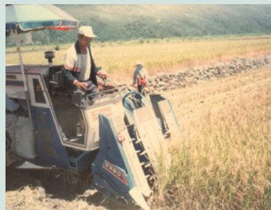
民國74年機械收割稻穀。