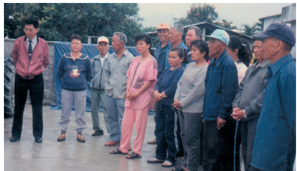
民國68年11月農場成立農機隊，場員參加農場舉辦之農技講習。