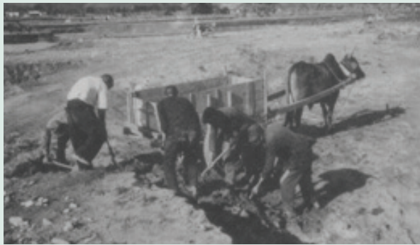
民國50年代場員以人力開墾。

知本農場前身為臺灣省政府東部土地開發處所屬大南壑區，由原臺灣警備總司令部調集開發總隊待退士官兵前來開墾，其成立緣由係為民國49年5月由國軍退除役官兵修建之中部橫貫公路竣工，當時本會蔣主任委員經國先生認為，聯貫東部之交通問題業已解決，遂於同年兩度前來東部就可資開發利用之土地進行勘查，為使大量待退官兵得有安身立命之所，並繁榮東部地區農業經濟，乃決定設置專責機構，有計畫開發東部土地，復於同年9月邀集農業復興發展委員會、美援會、國防部、臺灣省政府民政廳、農林廳、水利處、地政處等相關單位進行協商，11月即設立東部土地開發處，專責東部土地開發事宜。最初由輔導會管轄，並由臺灣警備總司令部成立東部警備開發總隊，做為東部土地開發的施工機構。