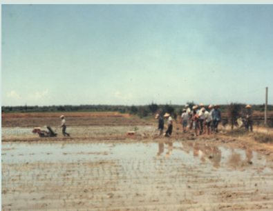
民國73年推廣機械插秧機。