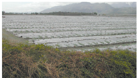
民國94年委託經營短期作物之西瓜田。