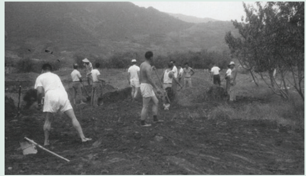
民國50年場員以人力客土開墾。