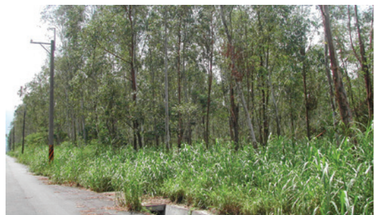
民國84年與永豐餘合作經營之造林地。