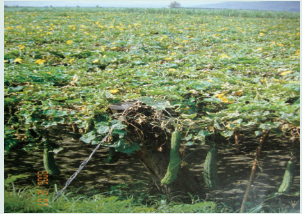
民國80年結實累累絲瓜絡大豐收。

菊花，農場栽植品種有杭菊、小白菊及小黃菊3種。杭菊為菊科多年生草本植物，每年3-4月育苗種植，每公頃可生產750公斤；小白菊及小黃菊高約40-150公分，育苗種植後9-11月開花，11月上旬摘花採收，產量可高達每公頃2,249公斤。