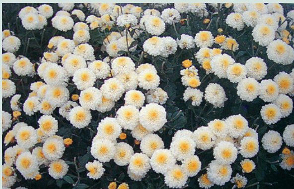
民國76年推廣種植成功小白菊。