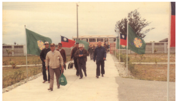
民國77年舉辦場員自強活動到友場參訪。