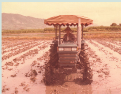
民國74年以機械農具耕作。