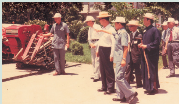
民國68年引進新式農機具，辦理講習研討會議。