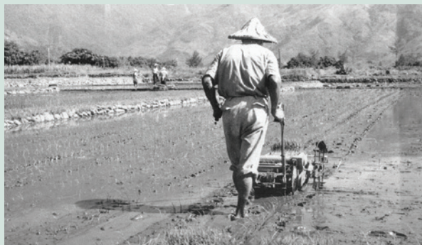
民國67年引進機械農具耕作。

在這生活的場員們並不以眼前的生活而滿足，反而更積極投入人力經營養殖漁業，希望在這塊土地上再締造另一個奇蹟，也期望能帶給後代子孫更好的生活。在歷經種種困難卻不喊苦的堅持下，終於在85年奠定了養殖漁業的基礎，近年來才能吸引養殖業者，接踵而來知本地區合作經營，進而增加農場的經濟收益，時至今日總算有些回報，對當年這些榮民前輩的智慧及高瞻遠矚，怎不令我們讚佩。