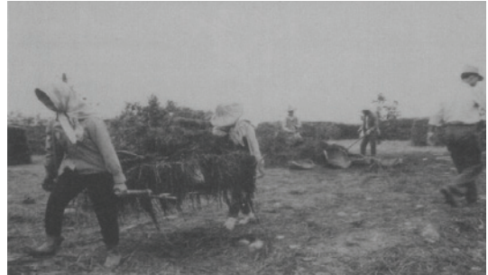
民國65年洋菇種植區堆肥。

87年7月14日知本農場因組織精簡而併入臺東農場，改稱臺東農場知本分場迄今。目前分場所轄區域包含知本墾區、臺東墾區、馬蘭墾區、美和墾區、大武墾區、鹿野墾區及興昌都蘭墾區等。