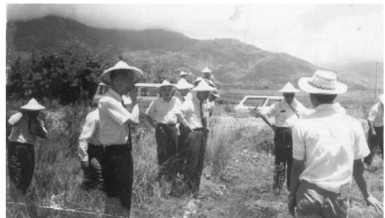
民國67年推廣蘆筍栽培觀摩。