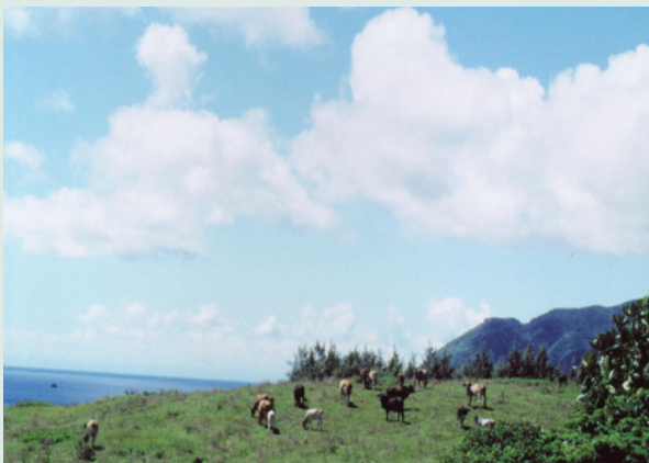
蘭嶼農場復興牧區的高品質肉牛。

農場土地經逐次撥用後，牧場範圍縮減，僅存中興、永興、天山等3處牧場，草源不足，牧區分散，後續發展空間受限，況以農場逐步精簡之人力，實際管理上出現重大困難。輔導會經盱衡全局，審慎評估後，遂以（78）輔肆字第3538號函核定蘭嶼農場於78年12月31日辦理結束，全場土地114.5公頃及蘭嶼地區警備指揮部所借用37棟房舍全數移交臺灣省政府民政廳，牛隻交由知本農場繼續發展畜牧事業。