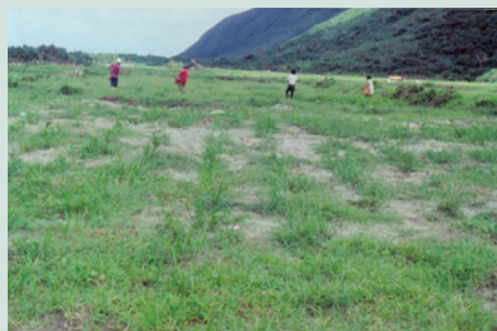
蘭嶼農場於永興牧區大面積推廣種植天竺草品種牧草。