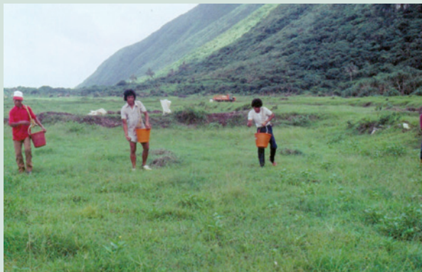
蘭嶼農場進行土地改良，增進地力所實施之施肥措施。

離島早年交通不便人煙稀少，每年7月至9月為颱風季節，11月至翌年3月為東北季風，因常遭受狂風暴雨侵襲，致土地多屬貧瘠，農場積極廣植牧草，藉由施肥進行土地改良，化荒地為優質綠地，對蘭嶼整體地力提升及水土保持有良好成果。