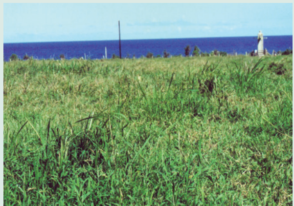
蘭嶼農場永興牧區肥美的天竺草。