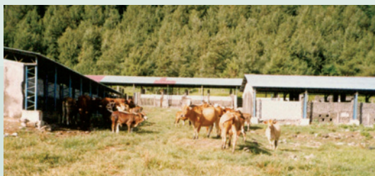
蘭嶼農場所設置牛棚，提供牛隻酷夏避熱棲息之用。