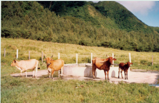
蘭嶼農場先進之肉牛飲用水設施。

離島早年交通不便人煙稀少，每年7月至9月為颱風季節，11月至翌年3月為東北季風，因常遭受狂風暴雨侵襲，致土地多屬貧瘠，農場積極廣植牧草，藉由施肥進行土地改良，化荒地為優質綠地，對蘭嶼整體地力提升及水土保持有良好成果。