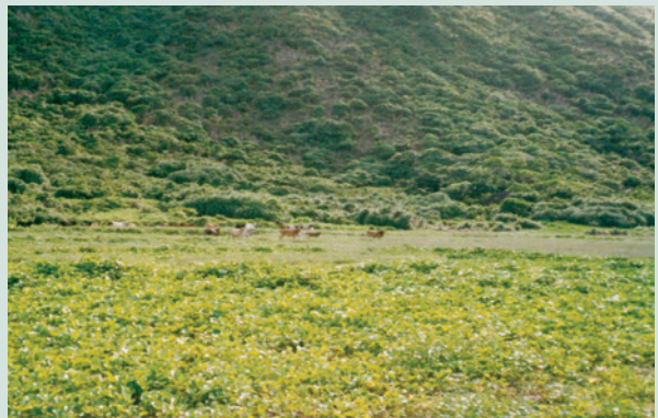
蘭嶼農場進行土地改良後之卓著成果。