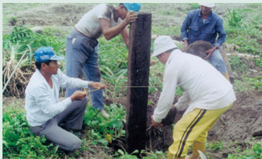
蘭嶼地區首次建立畜牧示範專業區的圍籬設立情形。

蘭嶼係屬於臺東縣離島的一個鄉鎮，島上居民受制於地理條件的影響，農作物生產不易，除種植芋頭、甘藷外，僅以落伍的漁撈技術捕魚以供給少許肉食，幾無相關可帶動地方繁榮之產業發展，蘭嶼農場將蘭嶼島南端上百公頃大範圍牧區內，整地種植牧草62公頃，包括補植、種植牧草22公頃，培植原生牧草地40頃，分別種植盤固拉草及天竺草，設置牛棚數十棟，枕木圍籬2,000公尺，分別種植牧草放牧養牛之示範專業區，為開發離島畜牧產業之先河，並有效繁榮地方，帶動離島發展，於蘭嶼發展史有不可磨滅之貢獻。