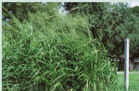
圖為蘭嶼農場天竺草品種試種篩選實驗。

蘭嶼農場分別引進「聖達」、「辛度」、「布拉曼」等品種肉牛，並精選本地種黃牛以科學方法進行品種改良，育成長肉率良好並適應當地離島氣候之優良肉牛。另引進「天竺草」、「盤固拉」等品種牧草，予以科學化試驗篩選最適合離島氣候之牧草品種，均有效提升蘭嶼當地畜牧產業整體水準。