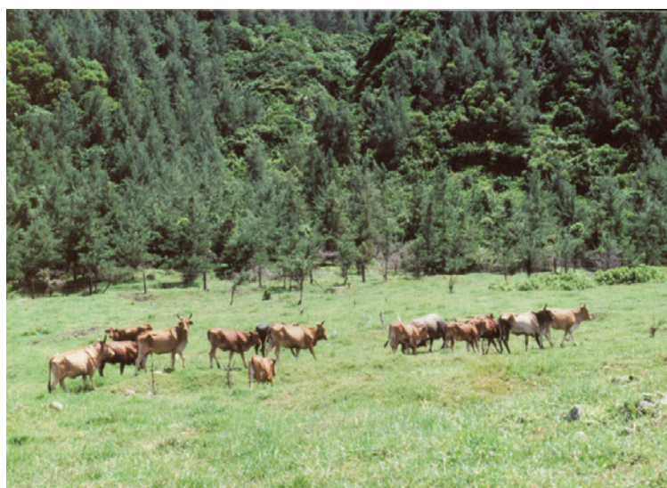
蘭嶼農場上所飼養放牧之牛群（位於中興牧區）。