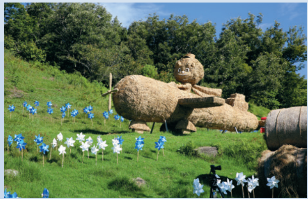
風起飛羊活動大型稻草裝置藝術。

十、107年農場年度盛事更改為「清境一夏—風起飛羊」活動，在暑假期間熱鬧登場！除了觀山牧區原有的大型主題風車外，以稻草裝置藝術布設為主題，讓活動的呈現更能一新耳目，有別以往。