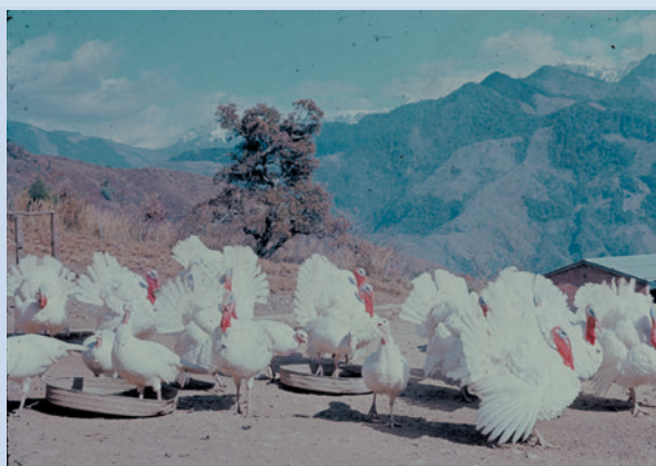
民國55年火雞飼養情形。

另一項增加榮義民收益的是輔導畜養美國白色小火雞，於民國53年間引進，亦採行粗放管理，且生長發育甚佳，頗具經濟效益，每年感恩節提供數十隻予駐臺外國使館過節之需。