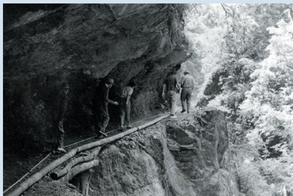
民國64年慈翁溪水利工程現勘情形。