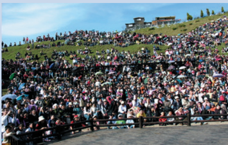
民國92年起農場年遊客量突破百萬。