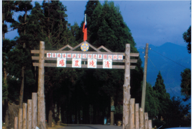
民國56年農場更名清境農場，新製入口排牌。

56年，蔣故總統經國先生因感於此地「清新空氣任君取，境地優雅是仙居」，遂於同年10月1日指示輔導會更名為「行政院國軍退除役官兵輔導委員會清境農場」，沿用至今，102年11月1日配合政府組織再造更名為「國軍退除役官兵輔導委員會清境農場」。