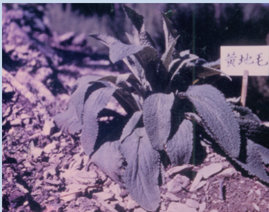
民國50年起進行試驗種植毛地黃。

前述中藥試驗，經多年觀察，部分雖品質符合，卻因產量較低，經濟價值較低，因此試驗計畫於61年底全部結束，而原栽種之啤酒花則移植他處試種。