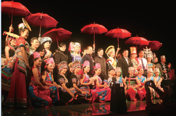
雲南少數民族七彩舞蹈團到場聯誼演出。