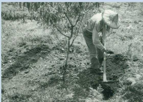
民國69年推動果樹間植蔬菜情形。