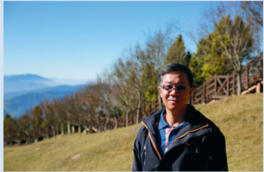
106年簡場長攝於青青草原前。

任內完成國民賓館耐震結構補強、青青草原表演臺座椅、公共廁所整修等工程，並督辦完成業界最先進羊舍拖網式刮糞機，有效減少人力、增進工作效能。並與南投縣政府合作辦理清境高架步道工程