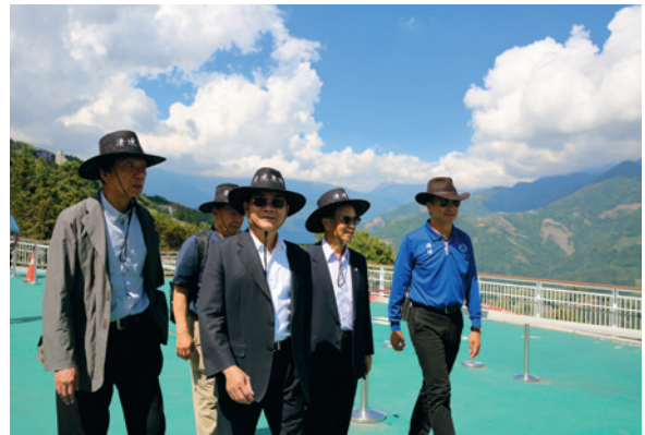
民國107年5月陪同監察委員蒞場履勘。

此外，配合政策發展觀光遊憩產業外，持續執行榮民照護及就業輔導，並進行敦親睦鄰及參與社區總體營造工作，與地方各界維持和諧關係，共創區域觀光遊憩發展榮景，並期許為原鄉文化發展及區域經濟振興，貢獻心力。