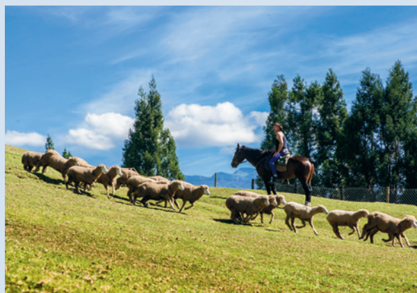
格蘭騎馬和牧羊犬合作無間的趕羊。