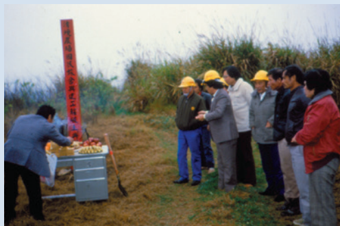
民國72年國民賓館奠基呂場長（左）主持破土典禮。

山東青島人，任內完成農場組織編制，持續慈翁溪引水工程之興建，設立果菜專業區，並致力改良黃肉罐桃與板栗加工，成立水果門市部自力銷售本場果品，另試辦加