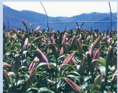
民國78年土地放領後義民於自有土地經營花卉。