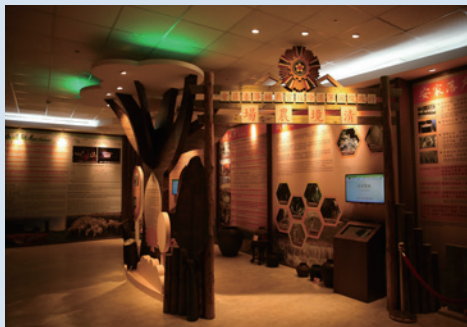
106年榮民文化館揭牌啓用。