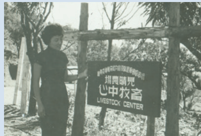
民國50年為發展畜牧事業成立之畜牧中心。