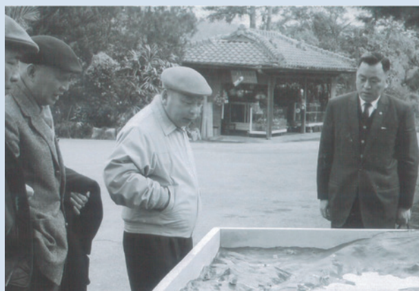
韓場長(右1)向經國先生簡報新人岡水利工程興建計畫模型。

廣東寧陽人，原任苗栗合作農場場長，任職期間，原武嶺水庫興建計畫變更，改以蓄水池設計工程替代，完成場區內14至20鄰各村莊道路廣場柏油路面鋪設、與農業試驗所合作藥用植物試驗、與公賣局合作試種啤酒花，規劃新人岡水利工程興建計畫，引進虎頭蘭試種。