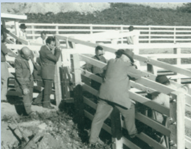
民國51年設置畜牧中心牛棚牛欄情形。

69年自澳洲引進肉毛兩用之「柯利黛」種綿羊，幾經繁殖綿羊數量不斷增加，於71年開始規劃觀賞與遊客互動區，以滿足遊客抱羊拍照及仔羊人工哺乳之需。自此，農場羊隻漸由畜產經營轉為觀光遊憩經營發展，終成為重要觀光遊憩資源。