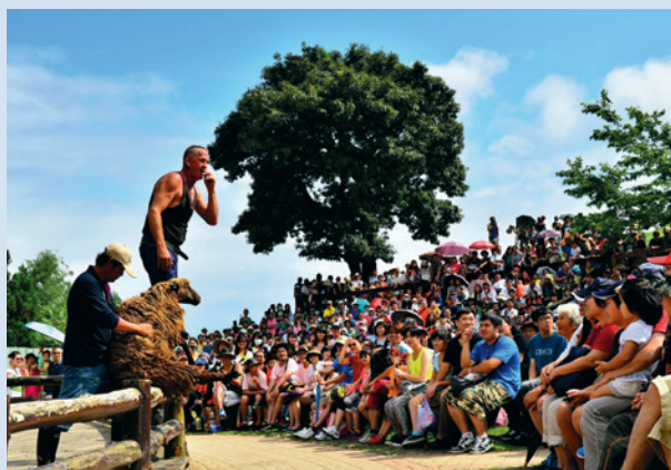
最具特色的綿羊秀。

格蘭最享受的時光就是和他的牧羊犬一起工作，牧羊犬與他相處多年，有著深厚的默契，吹聲口哨，牧羊犬即吠回應。趕羊，牧羊犬和格蘭合作無間，不用太久的時間，就把300多隻羊群趕回家，整個過程相當療癒。靜靜地架圍籬，餵牛羊，幫牠們檢查身體，做一個紐西蘭農夫真正該做、也最愛做的事。只有那刻，異鄉最像故鄉，農場的進步，和自己的青壯年歲，早已合而為一。