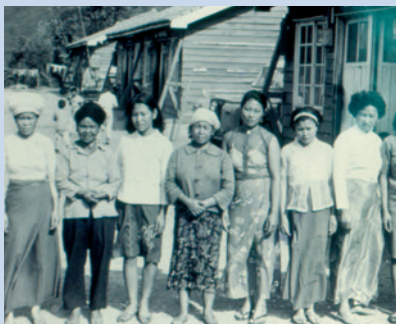
民國50年來自雲南少數民族（8族）婦女於壽亭新村合影。