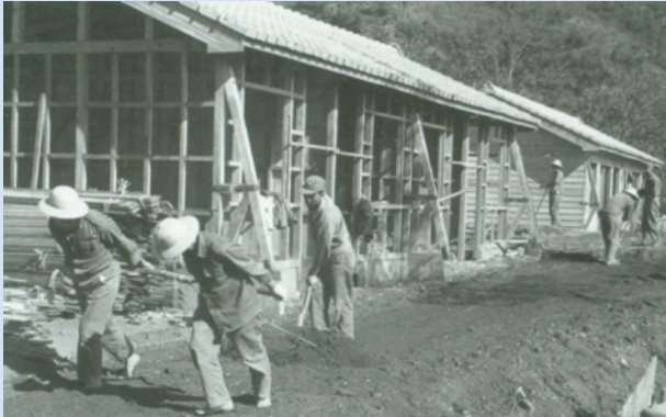
民國50年義民自力搭建眷屬房舍，以人力、鋤頭、圓鍬整地情形（於博望新村）。