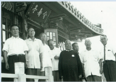
民國51年立法委員蒞場視察於介壽亭合影。