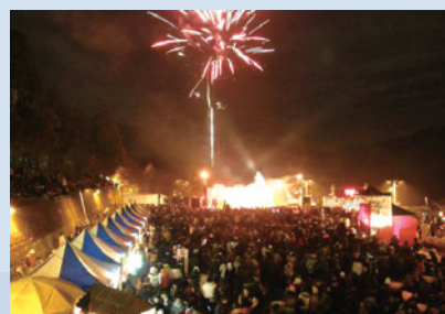
民國100年跨年演唱會活動等精采煙火秀。