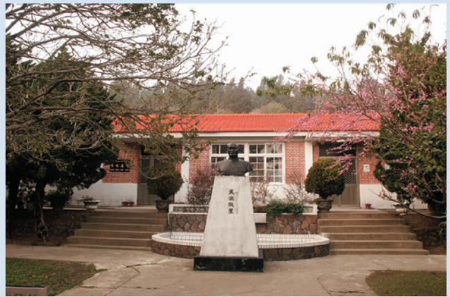
農場場部辦公室仍維持民國51年初建時規模。