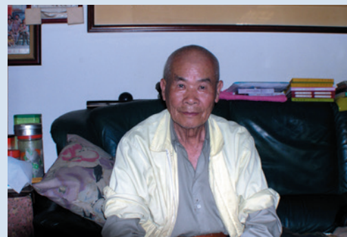
民國93年於壽亭新村住家留影。