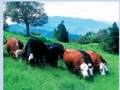
民國69年陸續購置繁殖之海弗、安格斯牛。