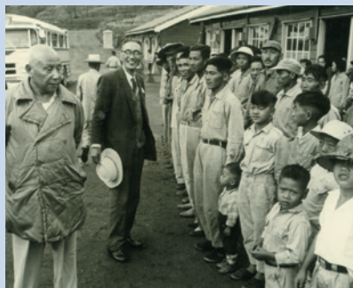
民國51年立法院雲南籍立法委員（左2）至壽亭慰問義民情形。