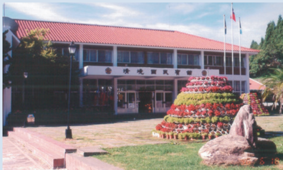
民國74年國民賓館落成開始營運。