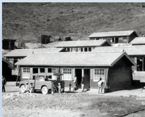
民國50年底壽亭新村興建完成，義民遷入定居。