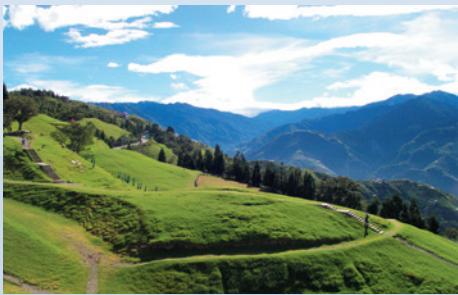
青青草原優美的景觀媲美瑞士風光。

80年進行第二階段觀光發展規劃，提出翠綠層層、埔霧遠眺…等十大景點，完成草原北端停車場等10餘項服務設施，開放綿羊與遊客互動、設立植物標本園、果樹觀察區、開辦解說導覽服務等。