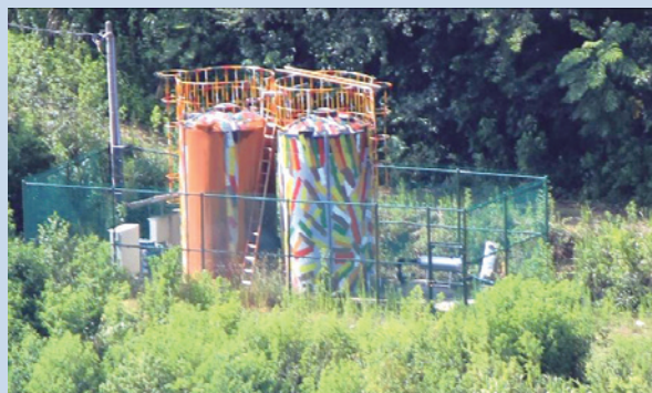
民國62年由原住民引領踏勘慈翁溪水源情形。

農場於93年開發完成第二水源，並引用山澗水經由幫浦抽取至水塔，有效的提供草原及賓館的用水問題，至98年開發第三水源，解決農場及清境地區供水問題，更於99年完成全場區水資源整合工程，使全場各營業區供補水自動化，大大的提升清境農場的供水及減少人力供補水作業問題。