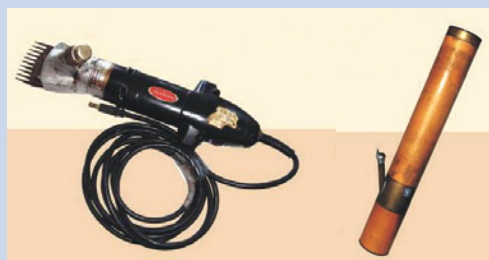
榮、義民等舊有器具數位建檔。

近年來文建會（現為文化部）為了保存臺灣現存的文化性資產，與輔導會協製榮義民文物清冊等文化資產清查、建檔等工作，完成數位資料留存與文物保存等工作，現文物保存於106年啟用之「清境榮民文物館」供遊客參觀，了解農場發展始末與心路歷程，更能讓這段歷史能夠有妥善的留存。