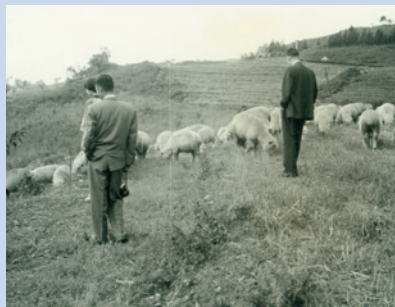
民國54年羊群於現賓館放牧情形。