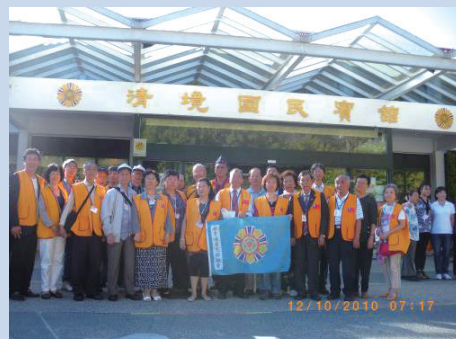
民國97年香港榮光聯誼會於國民賓館前合影。