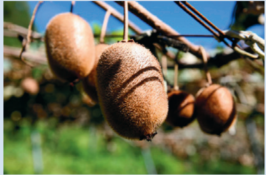
105年清境農場自產奇異果。

清境農場自民國74年起持續試種成功，面積約有5分地，為農特產品之一。每年4月下旬左右綻放芳香的淡白黃色小花，果實需經長達6至7個月的生長，在11月下旬便可見結實累累的獼猴桃，懸掛在秋日的陽光下等待被採收。獼猴桃維生素C的含量特別高，比蘋果高10至80倍，比桔子高4至12倍。因臺灣種的奇異果不必像紐西蘭一樣，為了長途運輸必須提早採收，所以清境農場的獼猴桃果實品質更香更甜。