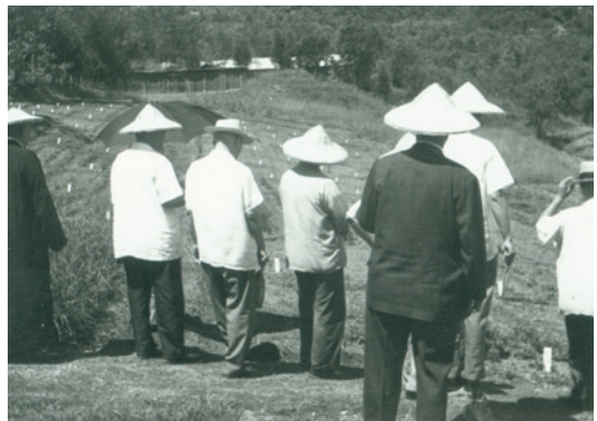
民國51年立法委員參訪參觀中藥試驗區情形。