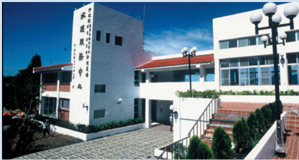
民國79完工之旅遊服務中心。