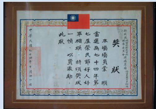
民國74年蒙老爹榮獲第7屆好人好事楷模。

蒙老先生平時熱心公益，並積極推行村里自治工作，多次榮獲農場模範楷模，蒙老先生目前在臺北與孫子同住。