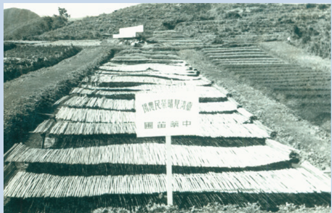
民國52年間設置之見晴榮民農場中藥苗圃。