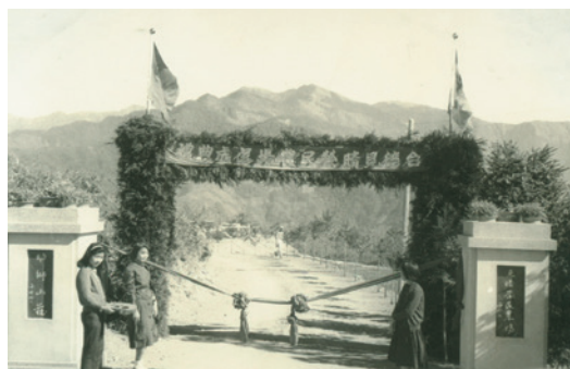
民國51年秋，臺灣見晴榮民農場新場部行政區落成典禮。