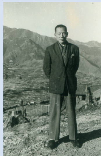
民國50年楊場長於場區開墾基地留影。

20日正式成立，完成榮、義民之安置作業，建置博望、壽亭二村，及忠、孝、仁、義、禮、智、信等七莊，爭取農業復興發展委員會補助設置擋水壩水槽及管線，解決農業用水，推動養牛、養豬及火雞等畜產計畫，興建牛奶加工廠及飼料加工廠，推動中草藥試驗研究，引進各類溫帶果樹推廣種植，完成仁愛國小見晴分班建校，設立博望及壽亭幼稚園。