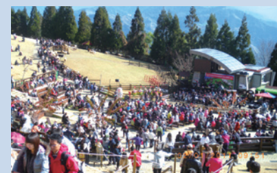
國立臺灣交響樂團於青青草原演奏優美音樂。