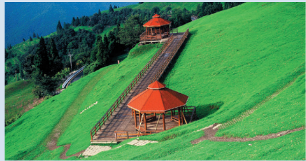
民國79年青青草原開始收費。