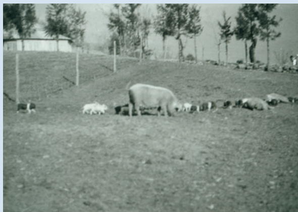
民國50年間豬隻於思源池邊放飼情形。

農場始建，為改善義民生活，首推「豬隻培育計畫」，由農業復興發展委員會養豬專家指導，興建新式改良豬舍、浴池，為使豬隻有充分的運動，採放牧方式飼養，場部引進及培育優良仔豬及生產飼料，提供榮義民每家戶飼養之需，並推廣及於原住民，品系計有藍瑞斯、杜洛克、約克夏、漢布夏等，全盛時共養400餘頭，而仔豬也曾在臺中、南投、彰化等縣市建立良好信譽。民國57年間，為畜牧事業能朝專業化、精緻化及企業化發展，遂決定停養，至59年後完全停養。