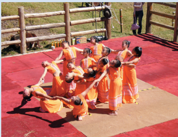
民國94年牛戀清境活動清境國小擺夷舞蹈表演。

來到清境後，跟著義民們靠著雙手，開荒闢地、涉源取水，造就了今日清境的風華，儘管他們的身分曾經不明確，懸宕於承認與否認間，但是文化來自歷史，文化成形之後，歷史便會被彰顯，在行雲流水的手部翻轉與輕盈步伐下，子子孫孫在舉手投足間記住遠在雲南的故事。