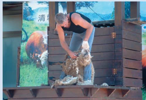
民國87年草原正式開辦綿羊秀表演。