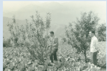
民國52年為增加榮義民營收，輔導於果園間植蔬菜情形。