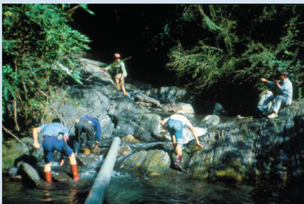
民國63年慈翁溪（瑞岩溪）水利工程水源頭施工情形。

協助義民整建房舍為水泥磚造及增建定遠新村，並完成忠莊遷移，推動榮義民生活改善計畫，研製罐裝純正水蜜桃果醬一種，增加榮、義民收益。