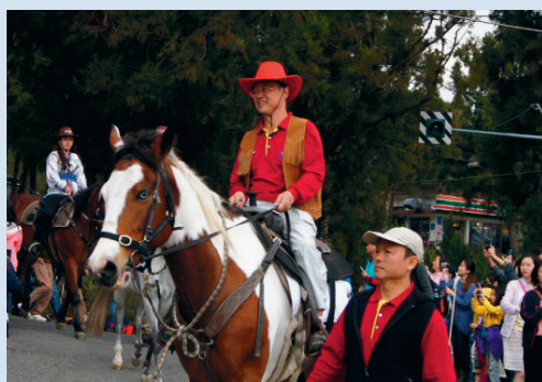
103年場慶奔羊節活動。

山東東平人，海軍官校58年班、海院正71年班，曾任海軍官校校長、輔導會專門委員，任內督導全場多角化經營，積極拓展行銷、加強服務，並強化國民賓館軟硬體設施，導入熱泵及led照明等綠能節能系統，國民賓館場域地質鑽探及監測，進行國民賓館強度檢測及補強工程，並完成第四水源區開發，取得交通部觀光局星級旅館三星級標章，104年與南投縣政府簽訂高架步道系統工程一場地使用及營運管理合作備忘錄。