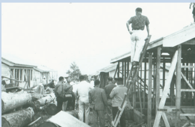
民國50年義民自力構建眷舍之情形（博望新村）。