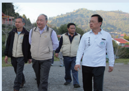
102年主委蒞場照指導陪同解說導覽解說。