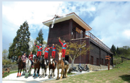
御馬房等馬術表演人員合影。

近年來清境地區觀光人數快速增加，也吸引了許多國外旅客前來，包含美國、英國、馬來西亞、新加坡、香港及大陸地區觀光旅客，更因政府開放陸客來臺觀光政策，大陸地區旅客人數亦快速成長。民國97年接待大陸國家旅遊局局長邵琪偉先生率先發團蒞場參訪，開啟了清境地區與大陸官方的觀光合作理念，同年國慶期間，香港榮光聯誼會亦蒞場參訪，100年浙江省葛惠君副省長、河南旅遊局一行蒞