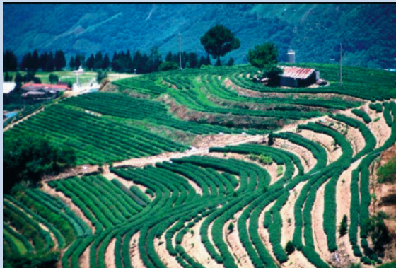
民國73年農場與台電合作茶葉水土保持試種計畫。

83年為了增加茶葉收入，提高品質，將佔有茶園面積75%的金萱茶更新為烏龍茶。85年8月起改直營管理茶菁銷售之方式經營，將茶葉製作成茶包，並於賓館賣店成立茶葉推廣中心，採外包方式供茶菁業者銷售茶葉。