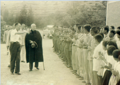
民國52年 蔣公蒞場巡視榮、義民於場部列隊歡迎。

輔導會主任委員、文教大隊以及各級長官也不定期來場訪問並關懷、慰問榮、義民之生活狀況與農墾情形，參與春節團拜、紀念 蔣公逝世周年大會暨歷年亡故榮義民（榮民節）、婦女節、元旦升旗典禮等慶典活動，並於榮民節舉辦「榮民模範」「員工楷模」「優秀青少年榮民子女」選拔表揚活動。