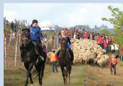
50週年場慶奔羊秀等活動熱鬧盛況。