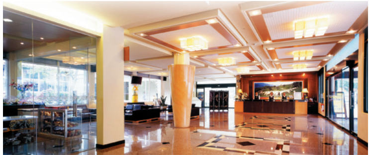
民國92年整修後之國民賓館大廳。

86年8月試辦剪羊毛秀表演，87年正式開辦，自89年起已發展為農場主要休憩活動；休閒中心及旅遊服務中心分別於92年及94年，委託民間公司經營，除提升服務層面與品質，亦增加經營效能。