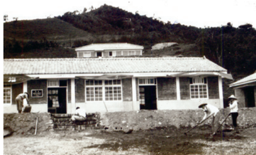
民國51年農場場部新建辦公室興建情形。