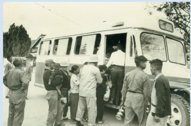
民國50年義民初來暫住埔里，自構眷舍完工後再由埔里接運上山情形。