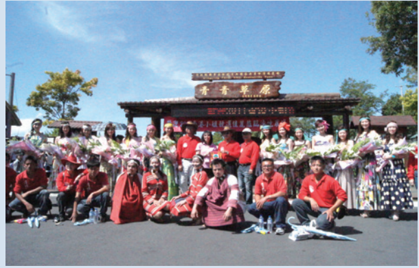
2011年香港小姐決選佳麗到場拍攝外景。