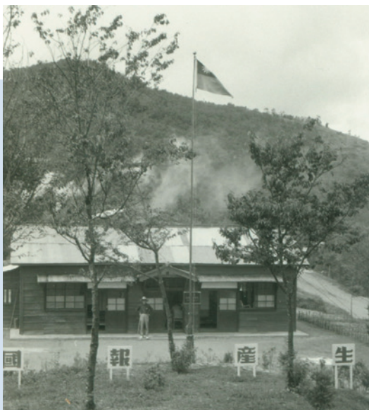
民國50年農場初成立沿用霧社牧場舊辦公室。