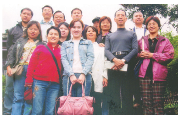
民國94年員工金瓜石自強活動照片。