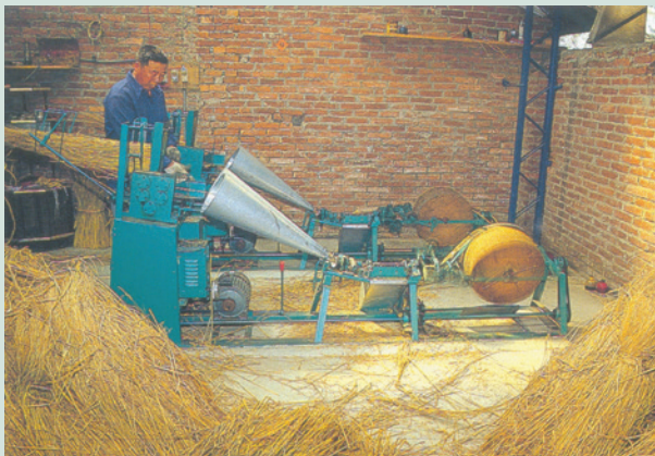
民國64年農場推廣場員家庭副業，圖為場員在家中製作生產草繩情形。