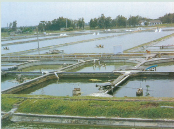
民國74年開闢之養鰻池，鰻魚進食之情形。