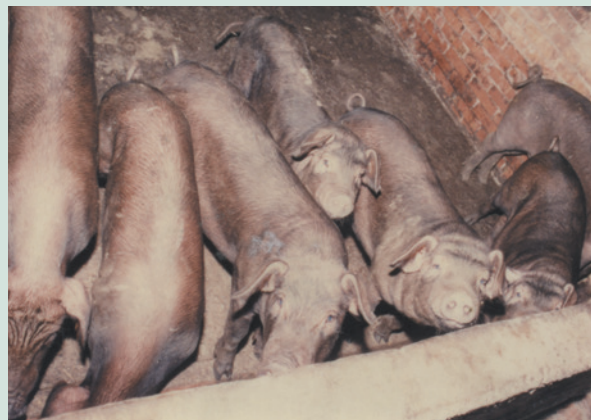
民國63年漢寶、二林成立「養豬專業區」，輔導場員飼養肉豬情形。

目前場部及各分場配合資源整合，支援榮服處，訪視獨居榮民，每月將訪視紀錄回報備查。