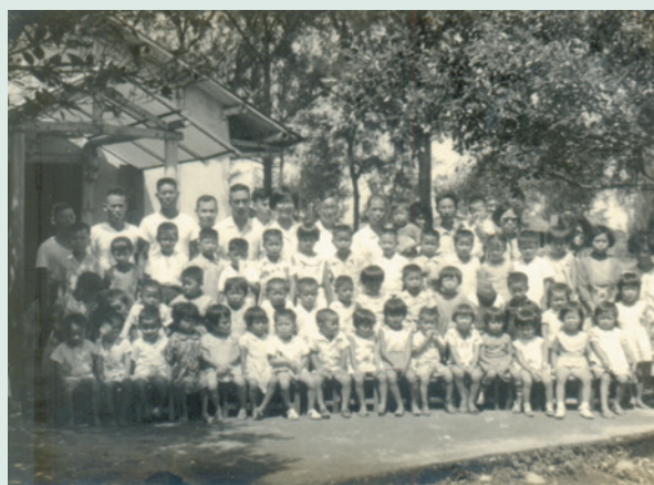
民國66年間於下水埔的場部旁邊成立托兒所培育場員子女，當時收容有場員子女76名。

為救助因疾病、災害而死亡之場員，68年向地方機關爭取災害救助補助費，共完成興建場員房舍20戶。