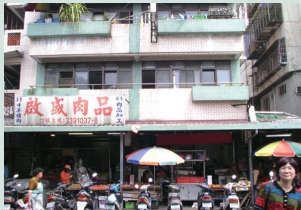
臺北市富民路農、漁、牧產品展售中心。