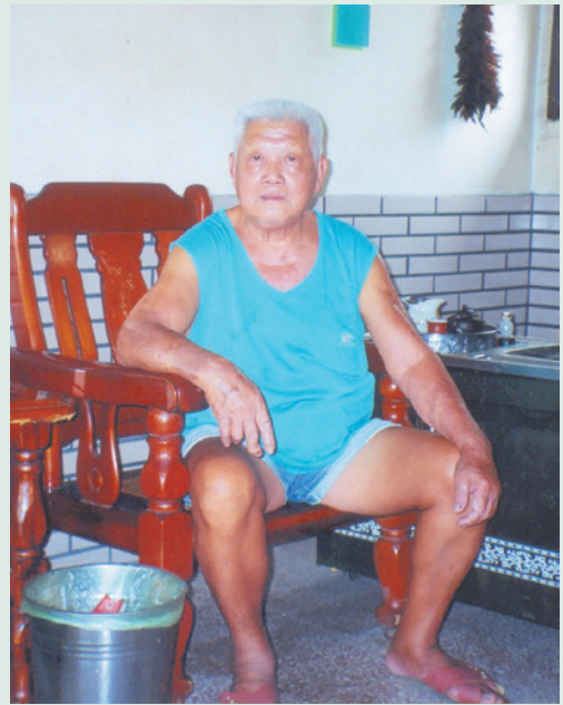
民國94年9月接受訪問時留影。