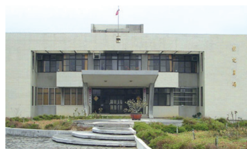
民國91年3月為利於經營管理遷移至新竹場部（場址：新竹縣新豐鄉青埔村80號）。