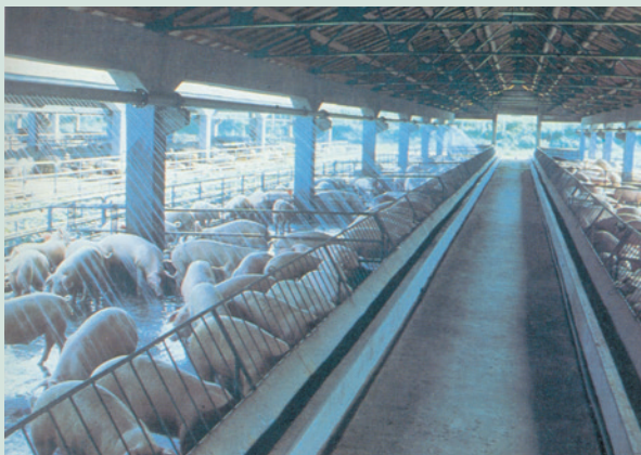
民國74年本場直營養豬場，飼養豬隻情形。

(二) 彰化農場嘉義分場遊憩設施興擴整建營運移轉案（ROT案），106年10月與緻州股份有限公司完成簽約，定額權利金每年為400萬元，營運權利金每年營業收入1億元內依2%計算，超出1億元部分4%計算。農場並成立工作小組，進行履約管理及績效考核，執行過程中如有不周延之處，滾動檢討修訂，落實管理制度以增加收益及活絡地方經濟。