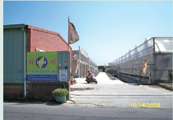
彰化鹿港區土地委託鉅洲公司經營情形。