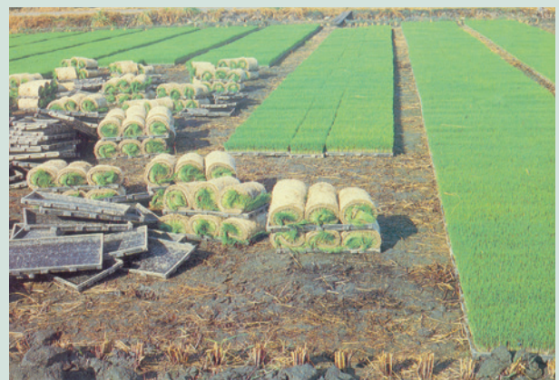
民國64年本場成立水稻育苗中心，圖為育苗情形。