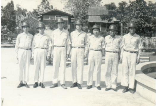
民國42年農場成立初期場部職員合照，後方建物為位於彰化縣溪州鄉下水埔處之場部。