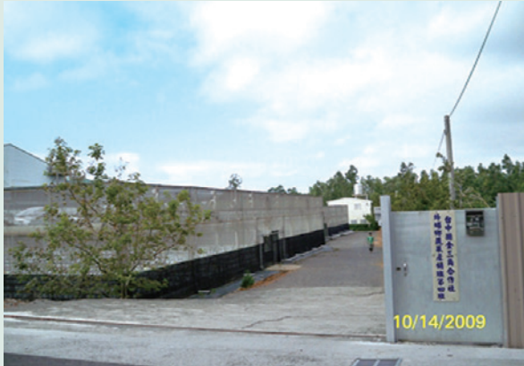
臺中外埔區土地委託金三角合作社經營情形。