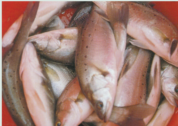
民國74年本場飼養之七星鱸魚為高品質淡水魚類。

惟保存不易，未擴大種植。引進民間農產及供銷技術，擴大辦理農產品之合作經營產銷作業，並與台糖公司月眉糖廠簽約，合作種植甘蔗，同年與漢寶社區農場簽約，合作繁殖文蛤苗。