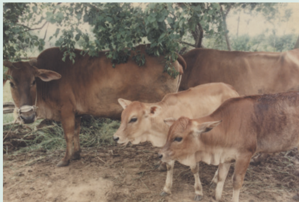
民國74年於漢寶區設立養牛場飼養肉牛情形。