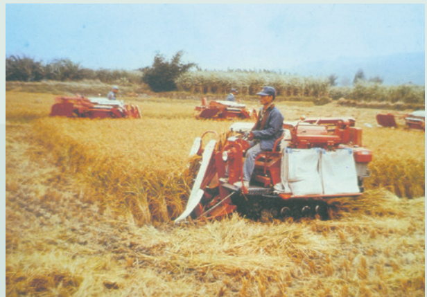
民國62年農場推廣農業機械化作業，圖為場員接受農業機械訓練情形。

由於農場成立時即訂有「生活急難救助辦法」及「儲蓄保險」，場員都能安心生活、安定工作，農場並於每年向地方政府申請經費，補助因疾病、災害而死亡之場員，使用經費達18萬2,000元，受益場員32人。