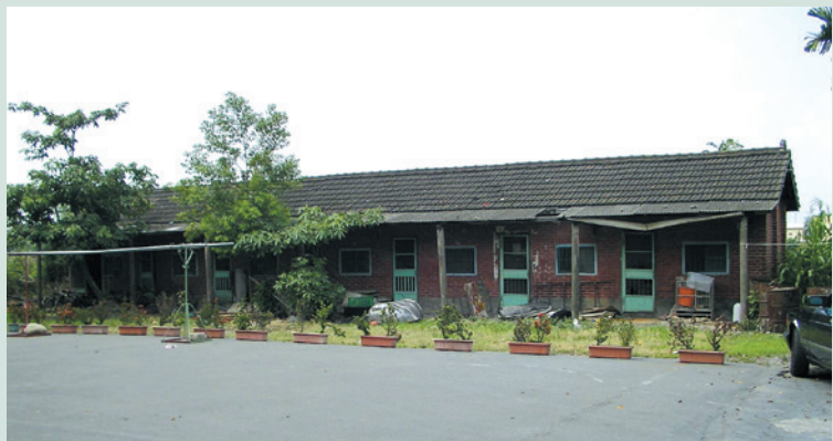
民國58年提供場員安置之宿舍。