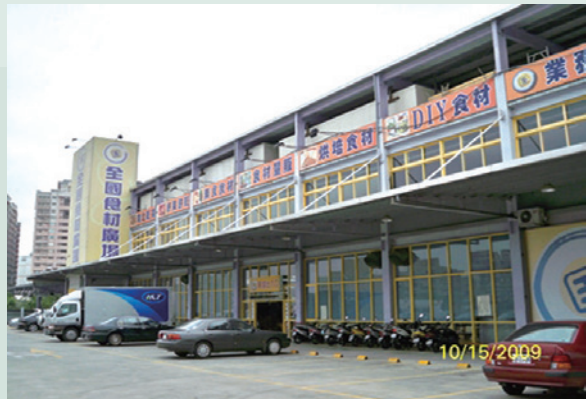
桃園大有路地區土地及建物委託經營情形。