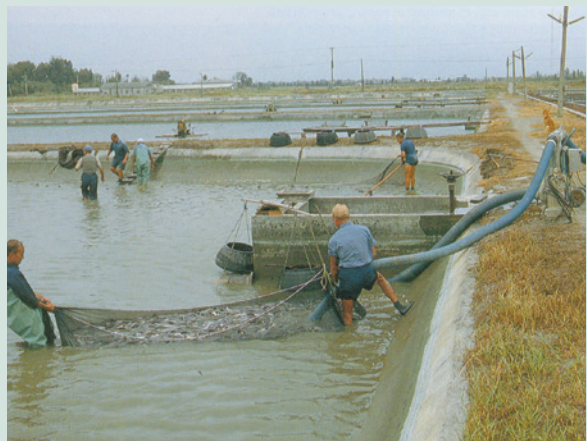
民國74年場員將鰻魚分級分池的轉池作業情形。