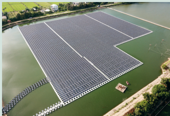
新竹縣新豐鄉青埔村蓄水池設置水面型太陽光電系統。