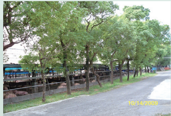
彰化溪州鄉畜牧場委託經營情形。