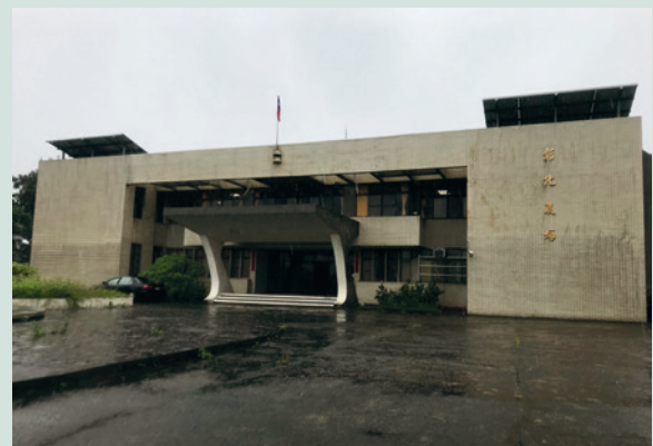
彰化場部辦公室屋頂設置屋頂型太陽光電系統。