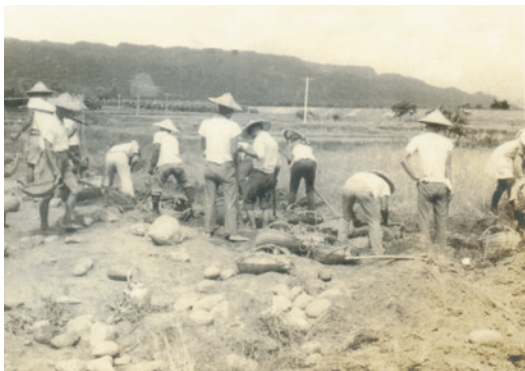
民國50年南投名間輔導區的場員辛勤的清除土中石頭及雜物，使荒地變成可耕作的良田。