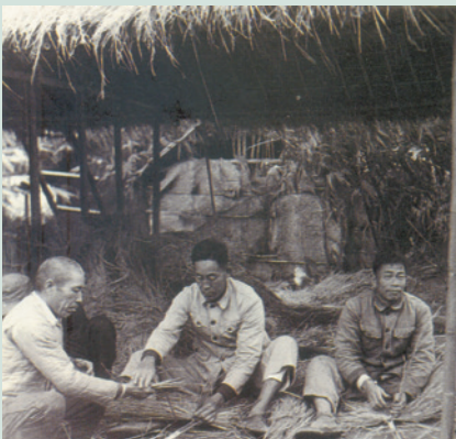
民國47年安置之場員自建草屋宿舍情形。

62年4月21日，因增加榮民安置就業，編制職員增為33人，並新增臺中輔導區，全場共計5個輔導區，23個農莊，編制場員753人，當時實有場員443人，其中有眷者215戶。