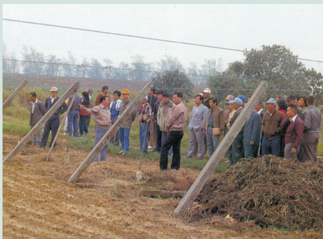
民國61年技術人員對場員做農務講解。

為使場員能習得農業之各項技能，自民國42年起每年均舉辦農事教育講習1至2次，由各農莊選派1至2名優秀場員參加，並邀請臺中農業改良場、中興大學、彰化種畜繁殖場、彰化縣政府等單位派遣講師來場講解並指導農作技能，場部並定期向學術、研究機構索取農、漁、牧等報導刊物計15種，供技術人員研讀，並從事指導。