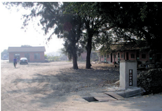
民國58年11月各工作小組改稱農莊，上圖為位於彰化縣溪州鄉的第二十八農莊（建於民國55年）。

彰化農場緣於民國41年12月16日由國防部奉命成立彰化大同合作農場，隸屬國防部總政治部管轄，場部設於彰化縣溪州鄉之下水埔，下轄3個中隊、9個區隊、29個小組。