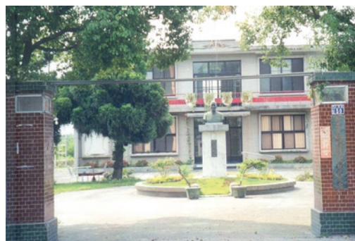
彰化農場位於溪州鄉之舊場部（攝於民國92年5月22日）。

輔導會組織法於102年6月18日經立法院三讀通過，輔導會各所屬機構遂訂於102年11月1日為組織改造施行日，嘉義及屏東農場整併至本農場，成為嘉義分場及屏東分場，農場編制員額精簡為21人。