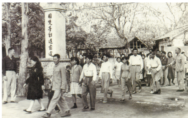
早期農場職員工遊園活動（攝於民國55年先總統蔣公誕辰紀念日）。