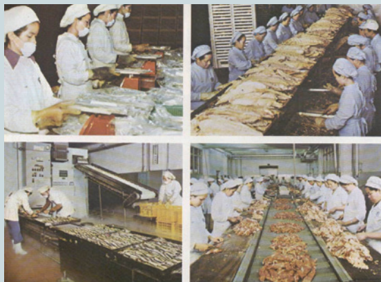
各種肉品製罐作業情形（民國68年）。

為培養足夠的基層技術人力，同時加強照顧榮民子女，該廠早在孫廠長時就與省立岡山高級農工職校創辦「建教合作班」，招收學生以榮民子女為優先，白天在工廠上班，下班後由廠派專車送至岡山農工職校夜間部上課。民國72年1月21日立法院內政委員會委員一行20餘人，由召集人饒穎奇委員率領考察該廠時，委員們對此「建教合作班」的成效，也極為稱讚，認為值此一技難求之時，建教合作是鼓勵青年自謀出路最好的辦法，也是提高員工素質的唯一途徑。委員們認為應該由政府鼓勵民間工廠與職工學校擴大辦理類似的建教合作，使青年朋友人人有一技之長，並進而減輕家庭之教育負擔，提高國民生活品質，安定社會。