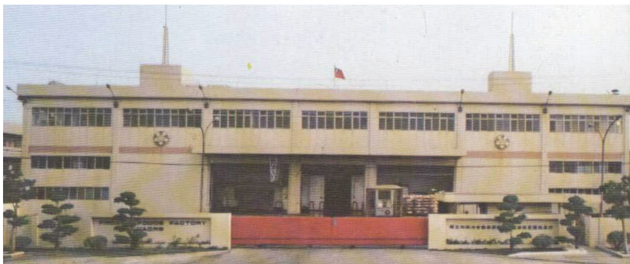
冷凍加工廠門景（民國68年）。