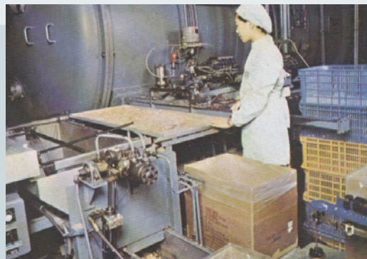
牛肉脫水處理銷售日本（民國68年）。