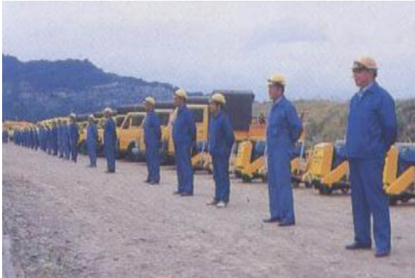
施工技術人員及裝備。