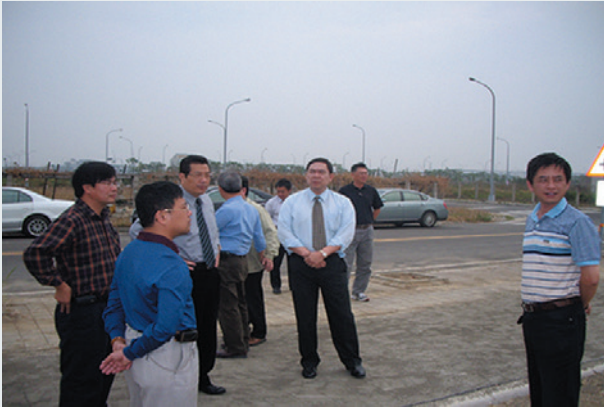
楊郁湜主任（前右2）視導高鐵臺南車站區段景觀工程。