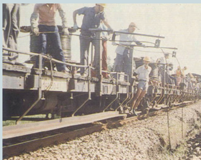
十大建設鐵路電氣化工程電力線鋪設（1）。