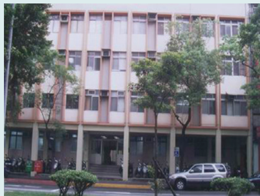
中心辦公室大門（新址）。