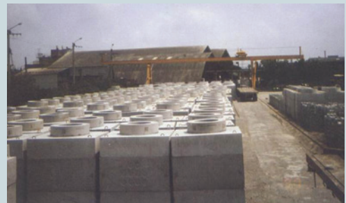
水泥製品加工隊生產之地下管路人孔。

中心的水泥製品加工隊專門製作人孔、水泥隔板、水泥管、基樁等器材，供給公、民營機構工程使用。