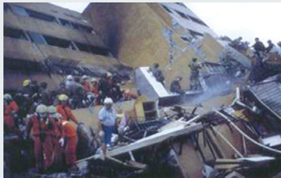
救災行動：瓦礫中搜尋生還者。

中心奉本會指示以部分人力投入救災工作，除對駐地附近受災民眾及眷舍，派遣小組人力實施搶救及復原工作外，並於奉命後立即編組救災隊，迅速投入參加救災行動。