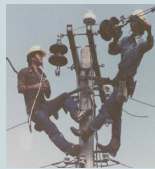
承攬台電公司電力線路架設工程。