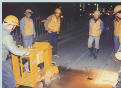
鋪設管線柏油路面切割。