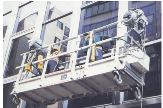
大樓外窗清潔作業。