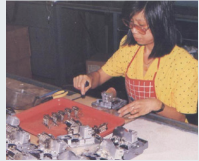
台電公司之家用電錶檢修維護。

技術二隊在60至65年間承接台電公司電錶拆裝、清潔、檢測及維修勞務。電錶需定期使用儀器檢測，為維持其使用壽命，尚需定期清洗，故障的電錶，需拆下進行維修。