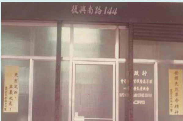
中心辦公室大門（舊址）。