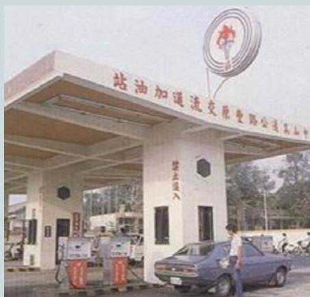
中山高速公路加油站加油一般勞務。