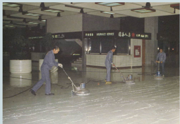
公共場所清潔打蠟。