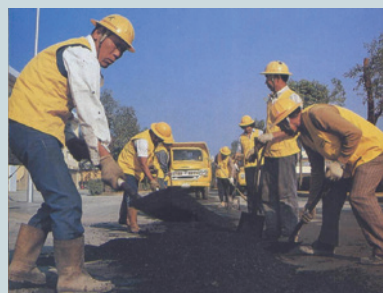
鋪設管線後柏油路面恢復。