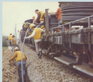
十大建設鐵路電氣化工程電力線鋪設（2）。