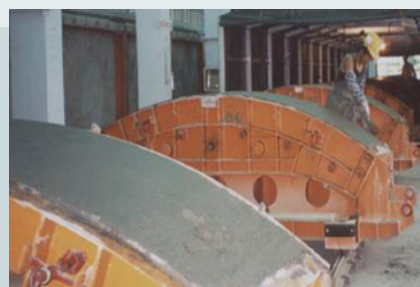
生產之臺北捷運工程隧道環片。