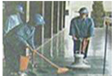
清潔打腊一般勞務。