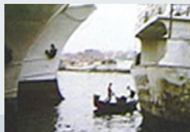
高雄港水面油污清除。