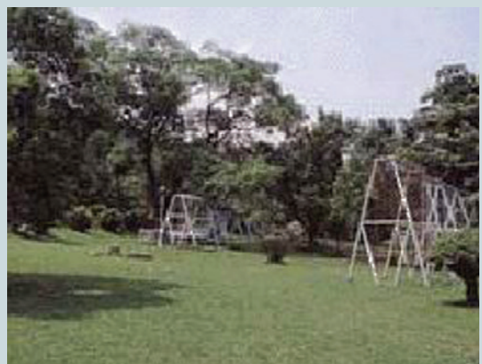
高雄市庭園綠化工程。

高雄地區綠化工程工案，包括公園美化、村落美化、校園美化及庭園綠化等。通常中心僅負責施工部分，而由政府負責規劃及設計。經中心數個技術勞務隊的努力，使高雄縣市多了許多民眾休閒、娛樂的好去處，也使百姓們