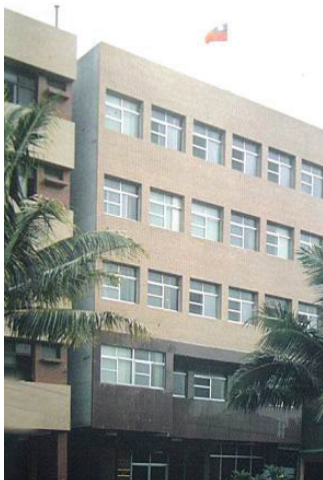
高雄市河北一路辦公大樓。