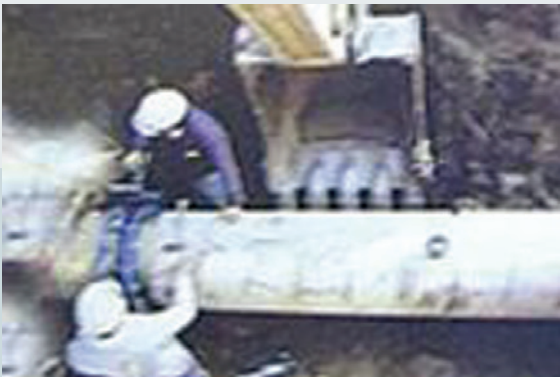
液化石油氣管路埋設。

工程，因而累積了甚多挖埋管技術，使中心業務蓬勃發展，對促進國內社會安定、經濟穩定，貢獻良多。不論電力公司、電信局、中國石油公司或瓦斯公司等之地下涵管管線埋管工程，作業程序大同小異，步驟如下：涵管加工組裝待埋→挖管路→埋管→接裝→覆土。