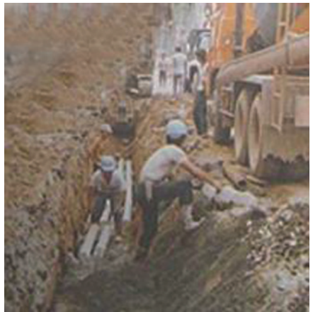
電信管路埋設工程。