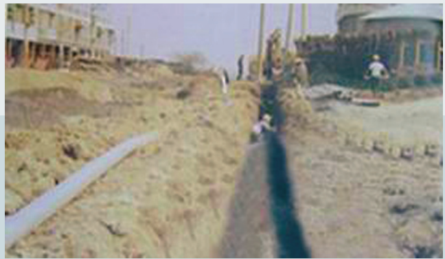
電信局電信線管路埋設。