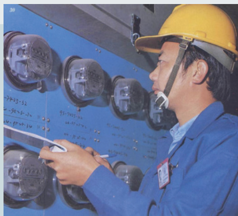
為台電公司抄錶服務。