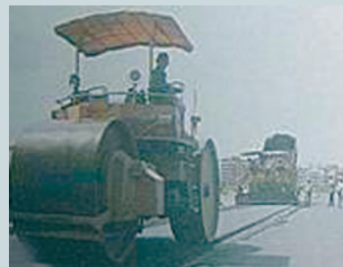
松山機場滑行道整修 (2)。