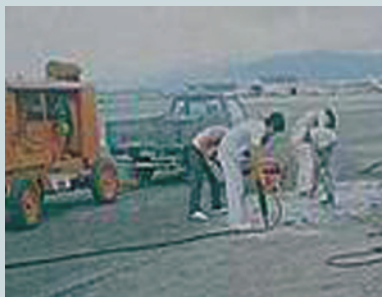
松山機場滑行道整修 (1)。