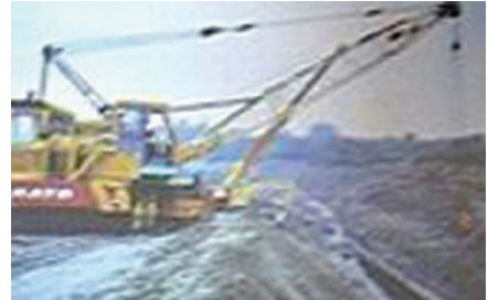
液化石油氣管路埋設工程。