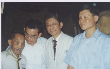
宮先生（右1）陪同第一處韋處長探視特需照顧榮民（90.6）。

在榮服處任職期間，宮先生所欣喜的並非榮譽與獎勵，而是他實際上能夠在工作領域得到的「活到老，學到老」。服務機構是考驗人性的大教室，亦是修心養性的人生道場，他從中獲得許多生命的憬悟，也吸引他不斷認真探索生命的奧秘，不斷滿足自己的求知慾，他學的越多，越覺得自己的渺小；在他的身上，我們得到最好的印證「施比受更為有福」；宮先生更讓人嘆服的是他平易近人，努力不懈的精神，在他擔任服務處副處長期間，他仍然每天認真的思索著如何精進服務工作，他說：「我覺得榮民們像是一本本寫滿生活哲理的書，因為工作關係而接觸到各類有豐富生命歷史的人士，聽著他們敘述走過的軌跡，也許有著與我相同的經歷，卻也常常蘊藏原本不知的許多事務，而一段段不同的見聞，增長了自己更多的閱歷。」而這些也就成了宮先生工作動力的來源，宮先生以服務最樂的典範，再創生命的高峰，帶給人們如春風般的和煦與舒暢，一如春風，一如春風……。