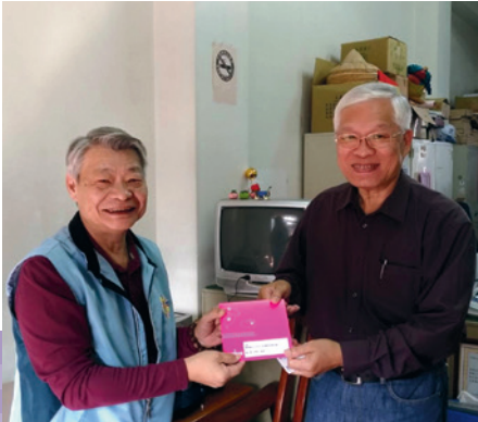
107年邵處長更新（左）致贈退將謝大霖將軍（右）賀卡。