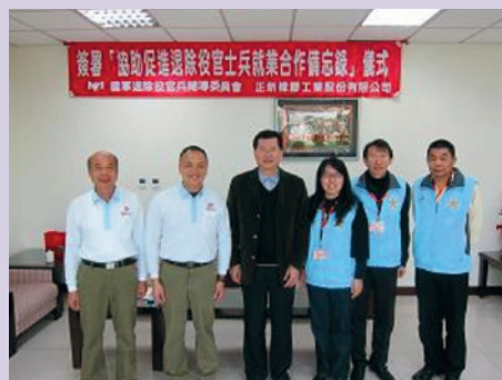
106年就業站與廠商簽署合作備忘錄。