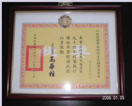
民國94年服務機構評比績優獎狀。

依本處史績資料及資深的服務人員轉述：自民國68年以來，服務處在全體同仁辛勤努力之下，陸續獲頒各項督考獎項，在當時服務機構丁級類型評比成效中，本服務處一直居於翹楚。更難能可貴的是，除了有員工獲得中央機關美展評比第1名外，更有榮譽亦得此殊榮；常於月會上，看到歷任首長滿意的微笑，這也無形中成為服務處光榮的史績紀錄。