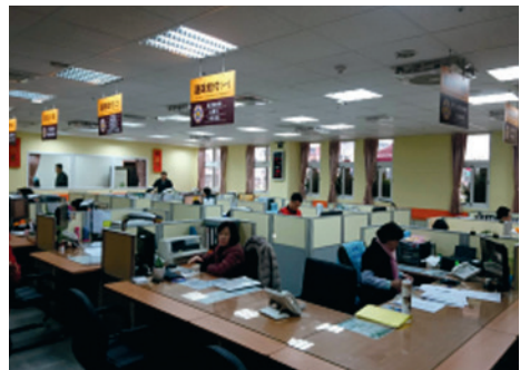
辦公室搬遷後內部現況（107年）。

當年隨著政府來臺的退伍軍人們已逐漸凋零老化，在臺灣出生成長的後輩們，相繼投身軍旅，在服役滿10年以上，退伍後取得榮民身分（稱為第一類退除役官兵）。另配合國軍募兵制之推展，自105年4月20日起，將志願服役4年以上、未滿10年者納入輔