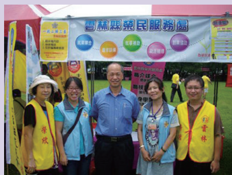
103年就業站舉辦就業媒合活動。

本處平時極積開發廠商簽署合作備忘錄，定期拜會地方企業廠商及大專院校，瞭解地方產業特性，依地方企業人才需求招開職訓班別，鼓勵未就業榮民(眷)參加職訓，培養一技之長或進入學校就讀培養專業知識取得證照及學歷，為本身加強求職之競爭能力。並與縣府勞工局合作每年辦理就業媒合活動，加強聯繫地方就業中心促進就業媒合，另於105年度起針對新退榮民，詢問求職需求並建立專業人才資料庫，定期將專業名單提供合作廠商，以解決廠商招募人才之即時需求，促進榮民就業以達雙贏局面。