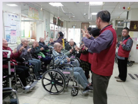
榮欣志工雲林榮家團康活動(102.8)。

本處榮欣志工定期訪視榮民(眷)，並結合青年學子對貧病榮民(眷)協助就醫、居家環境整理外，102-103年度起擴大至榮家服務內住榮民，與雲林榮家共同舉辦「榮欣情、志工愛」活動，由志工實施輪椅推送、陪伴就醫、團康活動及銀寶學苑教學活動等，使內住榮民能融入社會走入社區，發揮「社區意識」之核心價值。在偏遠鄉區(北港)設置關懷小站，每月定期與嘉義榮院護理人員前往為社區民眾實施健康諮詢、血壓血糖測量及骨質密度檢驗等服務。榮欣志工另於平日更發揮資源連結功能，與地方社福團體保持密切連繫，募得物資，轉贈縣內清寒榮民(眷)，使之脫離生計難以維持之困境。