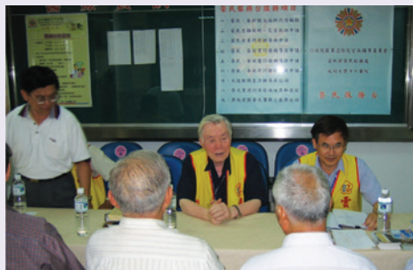
本處於成大醫院斗六分院設置之服務台（94.10）。

因應雲林地區狹長地形及遵奉高前主任委員服務理念，於臺西、四湖、東勢等鎮，設置服務點，除便利偏遠地區榮民洽辦事務外，更代表服務處服務工作深入基層的決心。再因本縣無會屬榮民醫院，使轄區榮民無法享受與其他縣市同等的醫療資源，經過本處不記名電話調查榮民就醫狀況，以前國軍斗六醫院（現為成大斗六分院）就醫人數最多，為能有效服務榮民，遂與該院協調並獲熱忱支持，於該院設置服務台，提供榮民即時之服務。