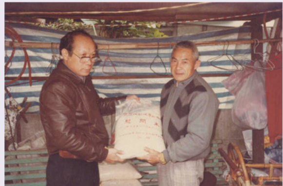
圖為賀先生為榮民（眷）爭取救濟物資，親自發送及與榮民合影留念（78.12）。

好景不常，賀先生晚年因身體狀況日漸衰退，89年更因操勞過度，中風臥病在床，家人原已不報任何痊癒的希望，但老天爺總會庇佑好人的！也許是不忍賀先生尚未享受天倫之樂及含飴弄孫的日子，加上妻賢子孝、積德庇蔭的緣故，在家人無微不至的照顧下，賀先生如同奇蹟般的復原。這證明了古人常講的一句話：「舉頭三尺有神明」，千萬不要「勿以惡小而為之，勿以善小而不為」，好心終究會得好報。