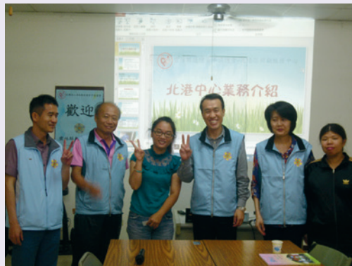
106年拜會北港復健青年協會。

運用，以及針對服務區內所有特較需照顧類別個案，以及85歲以上年長榮民暨遺眷，進行照顧類別調整清查、遠距系統及長照服務需求主動篩檢作業，依需求及意願實施服務及協助轉介，未來每年度將持續清查調整，並主動提供所需服務。