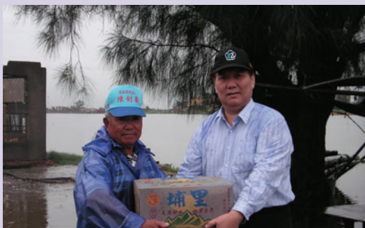
民國95年6月9日水災盧處長親自救災與賑災之一。