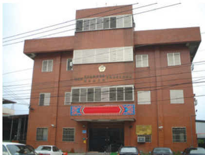
雲林縣榮民服務處－舊址（79-106年）。