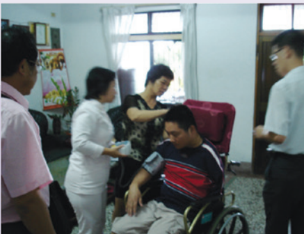
灣橋榮院實施居家護理實況之二(95.7)。

積極協調雲林縣老人福利保護協會、雲林縣長期照護協會及灣橋榮民醫院提供本轄特需及較需照顧榮民，「免費送餐」、「居家訪視」、「居家服務」、「居家護理」等服務照顧工作，並每周二、四於成大醫院斗六分院設置服務台，服務來院門診、就醫之榮民（眷），獲得榮民（眷）高度的肯定與嘉許。