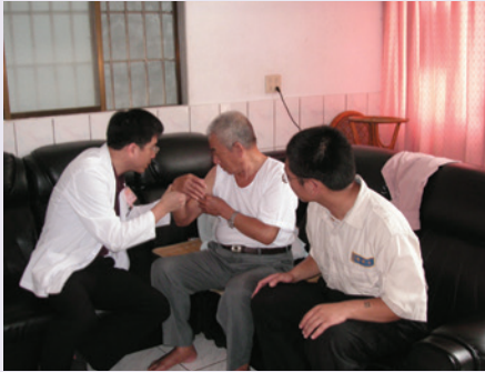
灣橋榮院實施居家護理實況之一(95.4)。