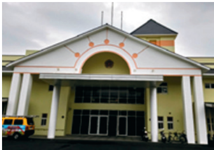
雲林縣榮民服務處－現址（107年）。

導服務對象，年齡層涵蓋了老、中、青三代，需求自不相同；而榮民服務處的目標即是使服務對象得到適切的服務與尊嚴自主的生活，建構「壯有所用、老有所終」之安定社會；為彰顯政府關懷照顧退除役官兵之德政及決心，將廣續推展就醫、就養、就學、就業與服務照顧等工作，以嘉惠雲林地區退除役官兵及眷屬。