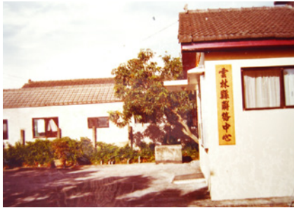
雲林縣聯絡中心－舊辦公室（75-79年）。