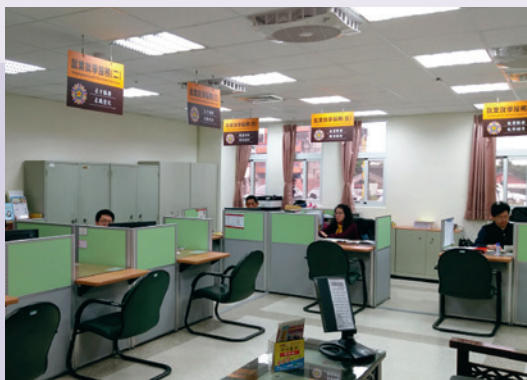
107年成立服務就業中心。

依輔導會政策，為加強輔導第二類退除役官兵及青壯榮民就學、就業及職訓等服務，本處於107年1月搬遷至雲林榮家新大樓，成立專責就業服務中心，增編服務人員辦理就學、職訓補助及創業諮詢等服務，另加強聯繫企業廠商爭取優質職缺，並規劃辦理「單一徵才暨職場參訪活動」，期能使退除役官兵先體驗職場，瞭解產業，進而提升就業媒合成功率。