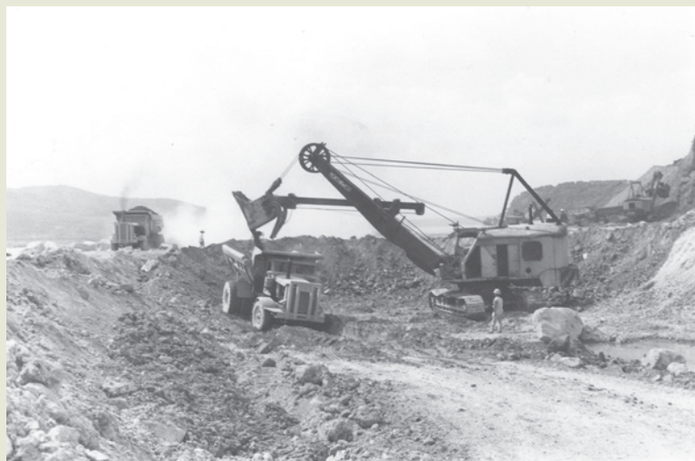
榮工早期以破舊機具，突圍關渡河口施工，備極艱辛。

榮工處早期爭取業務相當困難，因為大多數榮民缺乏技術，又缺乏設備及人才，業主對其工作能力缺乏瞭解，尤其東西橫貫公路工程於48年完工後，在工作銜接方面曾經發生過問題。榮工深知必須提升自己的技術層次，才能承接工程，並拓展工作範圍，榮工處嚴前故處長孝章先生在48年6月1日接掌榮工處時，提出「專業訓練與專業編組」計畫，鼓勵榮民弟兄依自己的志趣、體能，選擇學習一種或一種以上的專長技能，然後，依工程的需要，編組不同類型的專業工程隊，先後成立了橋樑、機械、建築、浚渫、路面、基礎等工程隊伍，分別承辦各類型工程。像橋樑工程隊在早期承辦的義里