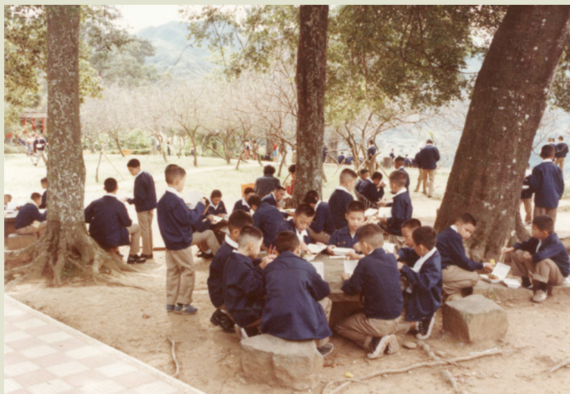
榮工設置「慈園」，收容榮工子女居住就學，圖為慈園小朋友郊遊活動。

在安定榮民員工工作與生活方面，榮工從49年開始實施「榮工互助制度」，這是參照「勞工保險」辦法，針對單位的特性而實施的一種榮工福利制度。因為榮工隊員的工作，流動性很大，工作地點大都在高山僻壤、交通不便的地區，工作的危險性又高，榮工處對於榮工隊員的傷病醫療因此格外重視，必須在工地設有醫療救護人員，對突發的意外事件即時急救處理，以保障工作人員的生命安全。如果按一般正常程序送勞保醫院救治，不但緩不濟急，而且可能耽誤救治時間，犧牲了隊員寶貴的生命。其他如對榮工眷屬的照顧、子女讀書的照顧等，都不是勞工保險辦法所能涵蓋的。尤其當時因業務承接困難，隊員的工作常常呈現青黃不接的狀況，沒有工作就沒有工資收入，但榮工處是一個安置單位，不能因為沒有工作就將榮民弟兄解僱，也不能