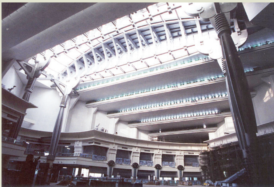
榮工公司參與聯合承攬施工的臺灣最高臺北101大樓購物中心內景。

為提高經營效益、平衡公共工程投標市場低價競標衍生之營運風險，榮工繼續朝多元化方向發展，強化工