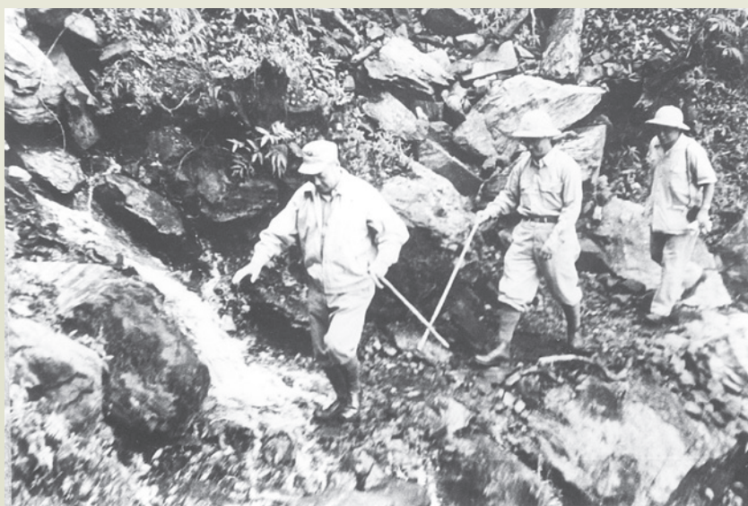
輔導會蔣前主任委員經國先生（左）履勘東西橫貫公路。

蔣前主任委員於53年7月奉調為國防部副部長，由趙故主任委員聚鈺繼任。趙故主任委員是在45年4月與蔣前主任委員同時到職，初任輔導會秘書