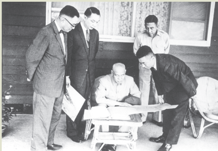
先總統 蔣公視察東西橫貫公路，圖左2為趙聚鈺先生，右1為榮工處嚴前故處長孝章先生，左1為林則彬先生。