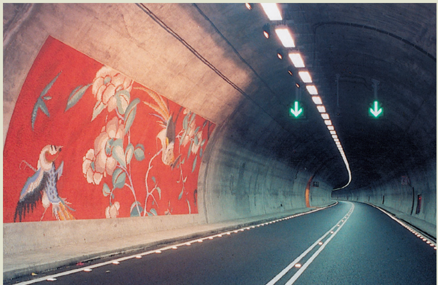
由榮工公司歷經14年艱苦施工完成的雪山隧道一景。

榮民工程事業朝上述方向歷經多年努力，已成功掌控了內在環境，全體同仁更秉持著優良傳統，以在艱彌厲、繼往開來的榮工精神，共同開創新企業的理念，在觀念及作為上，均朝民營的務實態度及作法而努力，終能在98年10月31日達成榮民工程事業的營造本業的民營化任務，成功地做到企業化永續經營目標，有效維繫累積數十年的工程實力，榮工「RSEA」金字招牌，也將繼續在全球發光、發亮！