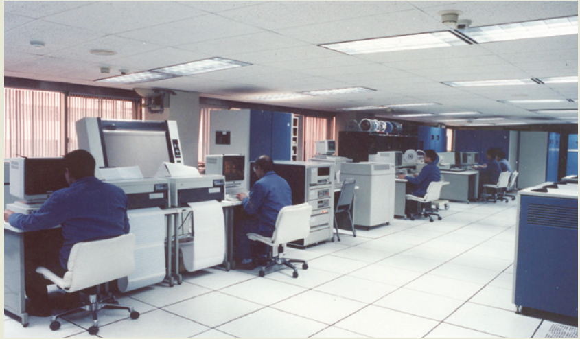
進步的管理使榮民工程事業快速成長，圖為營建業最早在國內啓用的電腦管理系統。

為了健全管理，增進效率，58年即開始使用電腦，進行業務電腦化。在當時，這也是一項在觀念上很不容易獲得認同的創舉。至65年開始推行「工程管理情報系統」，將有關財務