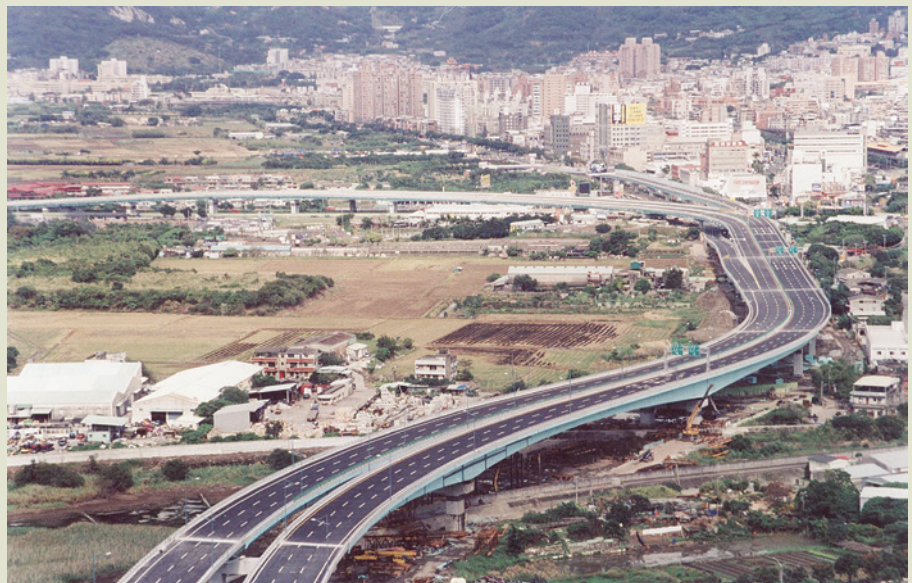
臺北市洲美快速道路磺港溪至大業路段，以一年時間完工，驗證了榮工公司的動員和施工能力，令民間公司刮目相看。

榮民工程數十餘年來承辦國家重大建設工程，拓展國外業務，是我國唯一被列入世界百大營建業的營建單位，其在國內創造的臺灣第一，實在不勝枚舉。如55年以一年時間施工完成的陽明山中山樓；獨力完成臺灣最大的曾文水庫；60年代的國家十大建設獨攬其中8項的全部或部分工程；全程參與隨後的十二項建設、十四項建設及六年國建的許多重大工程，其中如台電明湖及明潭抽蓄水力發電工程的規模，為當年全球最大；頭社溪過水橋載重超大，位於「921地震」之震央，震後絲毫未損，其品質頗受工程界及學術界稱讚；臺北翡翠水庫工程大壩為一座三心雙曲線變厚度混凝土拱壩，使用雙索吊車（Cable crane），澆置混凝土，工程完工後，經美國墾務局專家評定為世界「特優」級的水庫；用沉埋管工法完成的高雄港過港隧道工程，防水功能良好，頗受業主單位讚譽；十大建設的蘇澳港工程，自行研發浮塢製作巨型沉箱，為工程界留下典範；而自