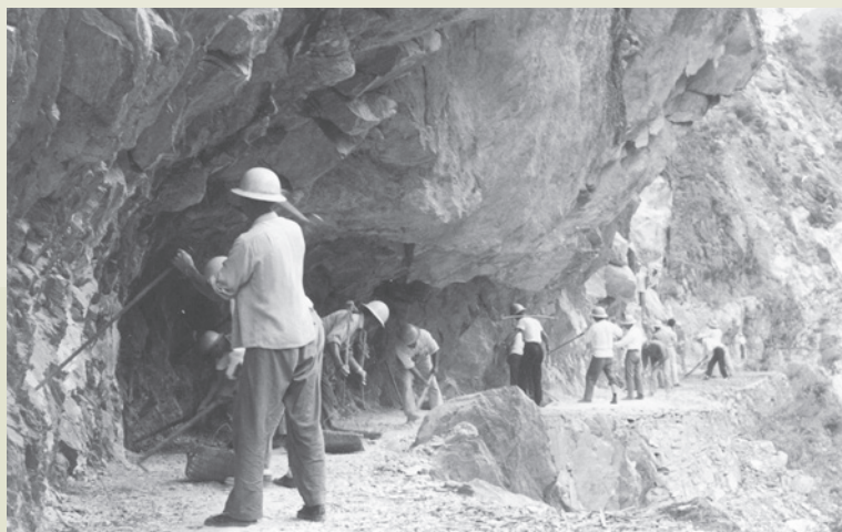
東西橫貫公路工程榮民弟兄施工。