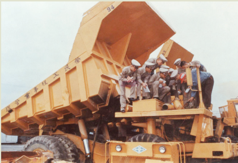
榮工創辦惇敘高工，培育基礎人才。圖為學生在榮工工地見習。

前往深造。在國內有臺大、臺灣工業技術學院、各工專，在國外有設在曼谷的亞洲理工學院，設在菲律賓的亞洲管理學院，設在荷蘭的水利工程學院，以培植中高級人才。另外選派高階主管及一般工地人員分別接受哈佛大學高級企業管理研究，以及出國觀摩新的施工方法與技術，都是著眼於提