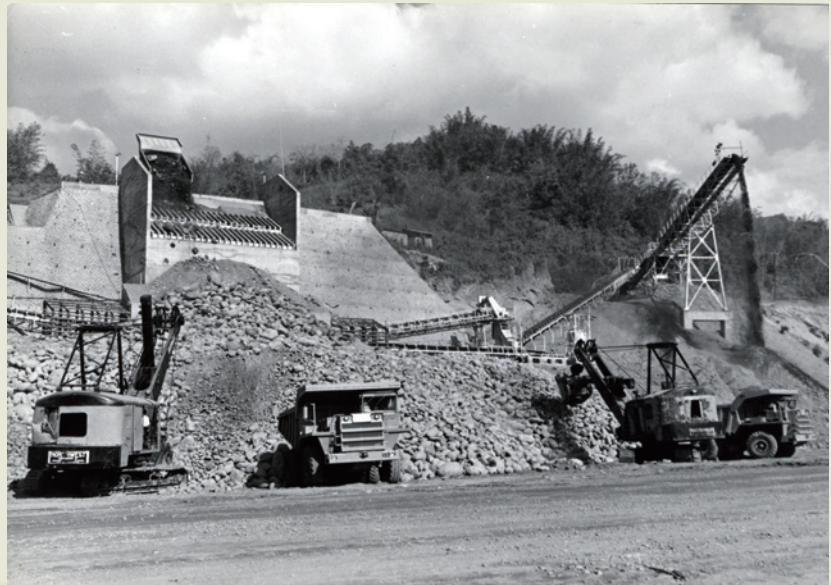
曾文水庫的施工，是榮工事業的轉捩點，榮工的施工技術和能力，備受肯定，也因此奠定了榮工事業的扎實根基。

不充足，而且後來購買挖泥船的計畫又有人反對，理由是後續工程並不樂觀，龐大投資將會積壓資金，增加負擔。但是在嚴故處長堅定的決心下購買了挖泥船，如期的完成基隆河改道工程，而後越南湄公河疏浚工程的承接，就是因為榮工有了挖泥設備與人才，才開啟國外工程的大門。