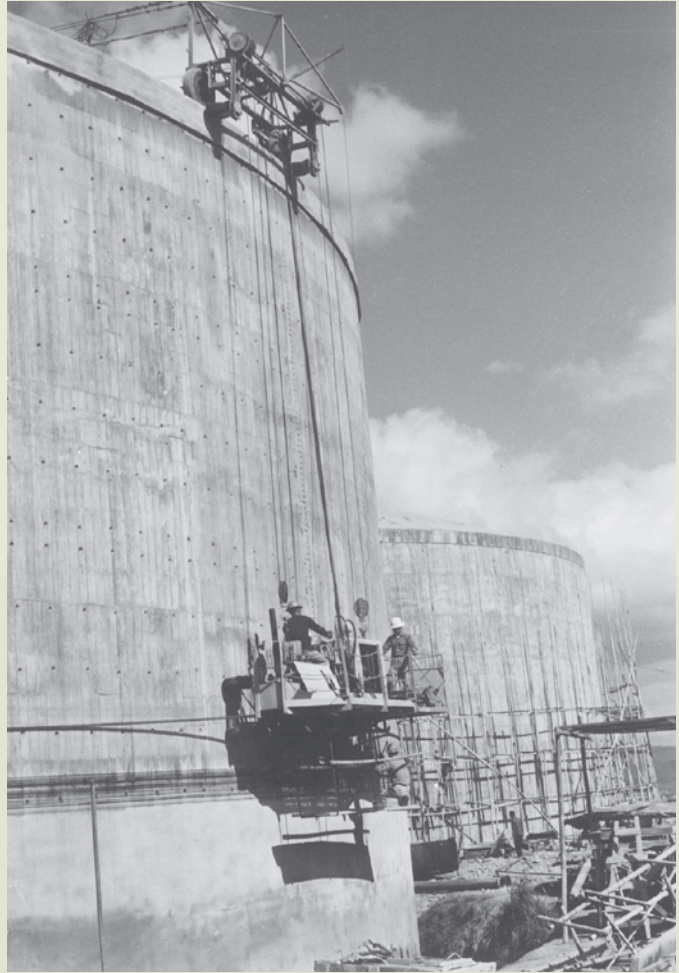
榮工早期半機械化施工，圖為臺北五分埔中油油槽工程。

曾文水庫工程原來準備招開國際標，它是遠東最大土石壩工程，由榮工處爭取承辦，開創了由國人獨力承辦如此大規模工程的先例。該一工程在62年提前完工後，榮工處經由這一工程所培育的3,000餘名技術與管理員工以及所購置的機具設備，使榮工處具備了承辦與管理大規模高技術工程的能力與經驗，所以才能在繼之而來的十大建設工程中，承擔起8項工程的施工任務，在中華