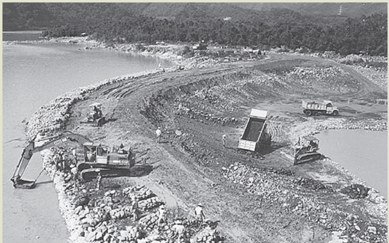
榮民工程是國家重大工程的救火隊，這是榮民員工長期在工作中樹立的企業形象，圖為臺北青潭堰風災搶救。

50餘年來，榮工無時不以達成政府交付之任何工作任務為努力目標，包括緊急災害搶救與復舊工作，不論限期如何緊迫，工作如何艱鉅，均能不計一切代價、不計一切犧牲，日夜不停，奮勇趕工，如期或提前達成任務。也因此，使榮民工程在社會大眾心目中，成為可資信賴的形象。