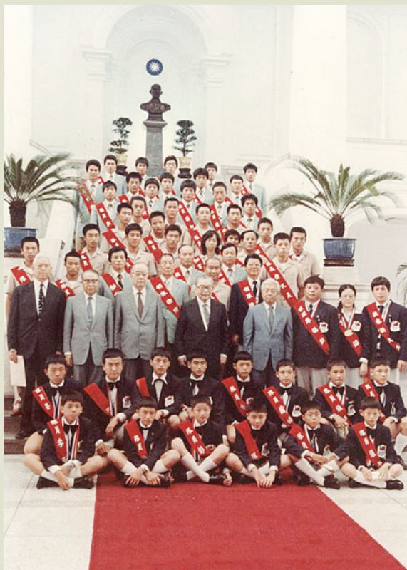
以榮工為主力的國家棒球隊凱旋歸國後，蒙蔣故總統經國召見合影。

榮工推展全民體育，52年成立榮工籃球隊，參加甲組比賽，其後並與南山商工建教合作，成立榮工乙組籃球隊，培育新人。59年成立榮工少棒隊，以後又陸續成立青少棒、青棒及成棒，為國內唯一1個擁有4級棒球隊，有計畫的培訓棒球選手的單位。另外也成立了榮工桌球隊，其中如女子桌球國手張秀玉就