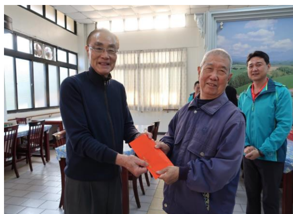
馮主任委員致贈春節加菜金