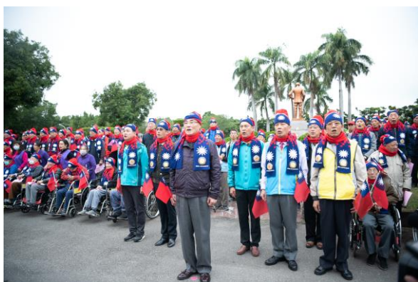
馮主任委員主持本家元旦升旗典禮

主任委員於 109 年元旦上午 7 時 30 分，主持本家中正堂前舉辦之升旗典禮及新春團拜活動，與長輩齊唱國歌、國旗歌及愛國歌曲。主任委員在致詞時表示，很榮幸在 109 年的第一天到榮家與長輩們一起升旗，並向長輩拜個早年，「榮民」不但為國家奉獻了青春歲月、生命，許多的善行義舉更為社會樹立了典範，照顧榮民輔導會更是責無旁貸。