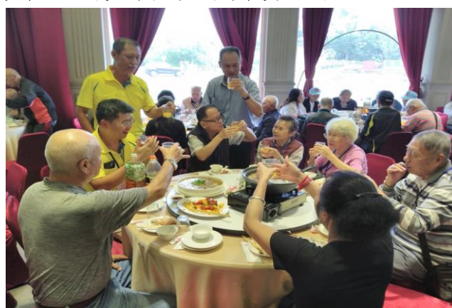
住民們享用豐盛午餐

榮家特別安排養護房住民們走出戶外，辦理輕旅遊活動，前往南彰化「萬景藝苑」觀賞奇花異木，中午至北斗鎮土雞城饗宴美食佳餚。餐後再帶至「台灣穀堡」讓伯伯們認識道地的「台灣米食」文化，也順便採購一些喜愛的米食食品，讓伯伯們滿心歡喜而歸。