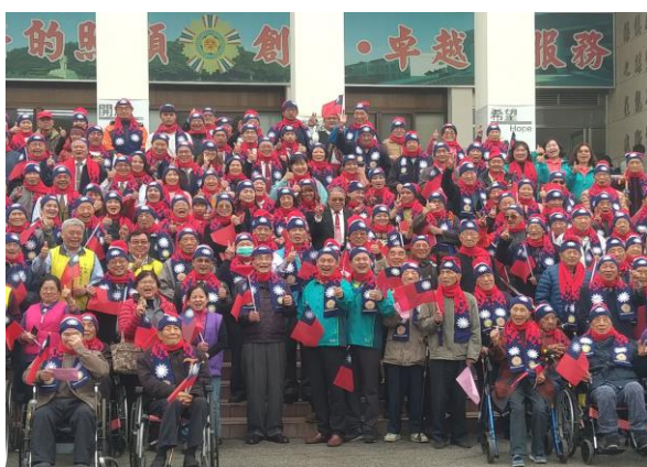
馮主任委員與參加升旗長輩們合影