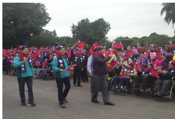
馮主任委員與長輩齊唱愛國歌曲