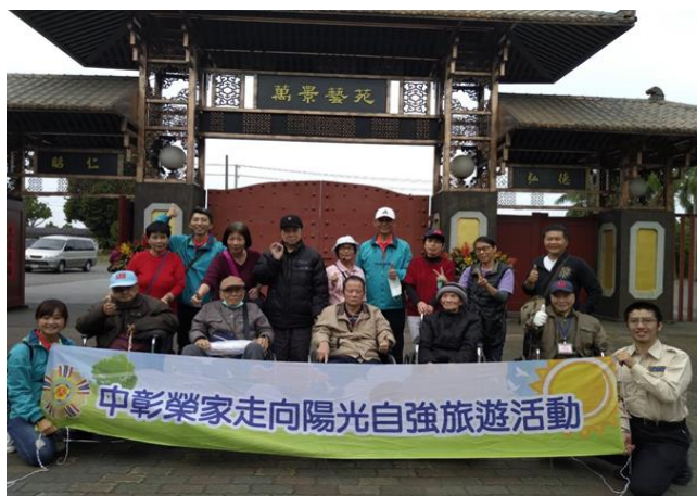
住民們參觀萬景藝苑

榮家特別安排養護房住民們走出戶外，辦理輕旅遊活動，前往南彰化「萬景藝苑」觀賞奇花異木，中午至北斗鎮土雞城饗宴美食佳餚。餐後再帶至「台灣穀堡」讓伯伯們認識道地的「台灣米食」文化，也順便採購一些喜愛的米食食品，讓伯伯們滿心歡喜而歸。