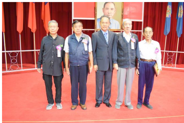
主任與榮民楷模合影