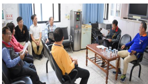
埔里分院蒞家訪視