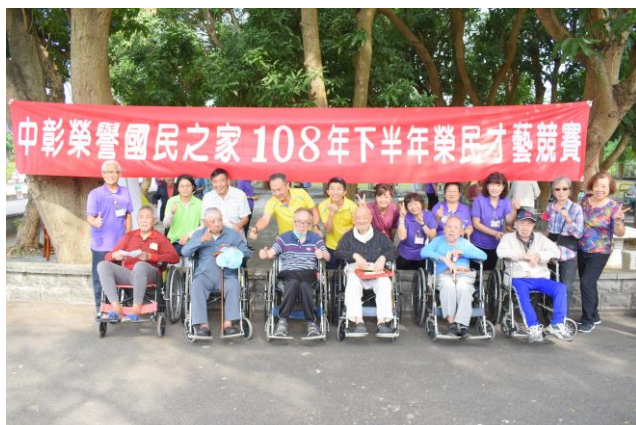
才藝競賽「闖關趣味活動」