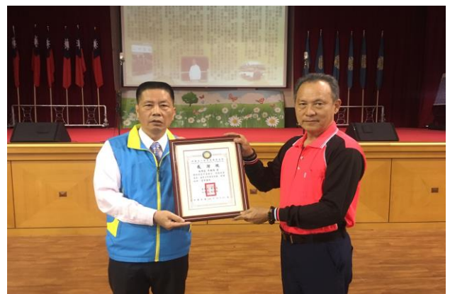
基金會尤秘書長頒贈感謝狀