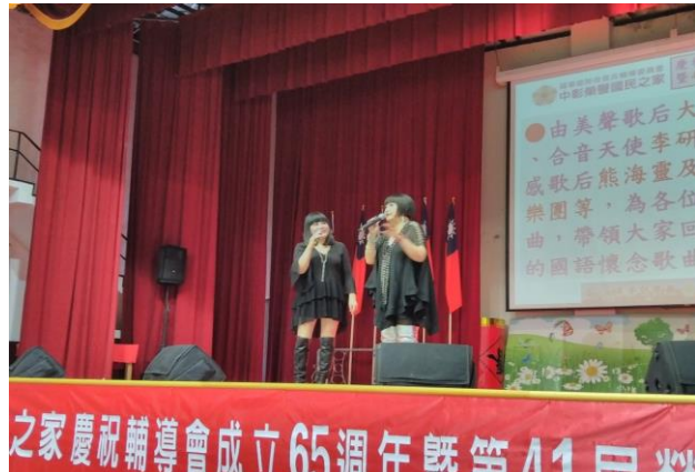
懷念流行歌曲演唱會