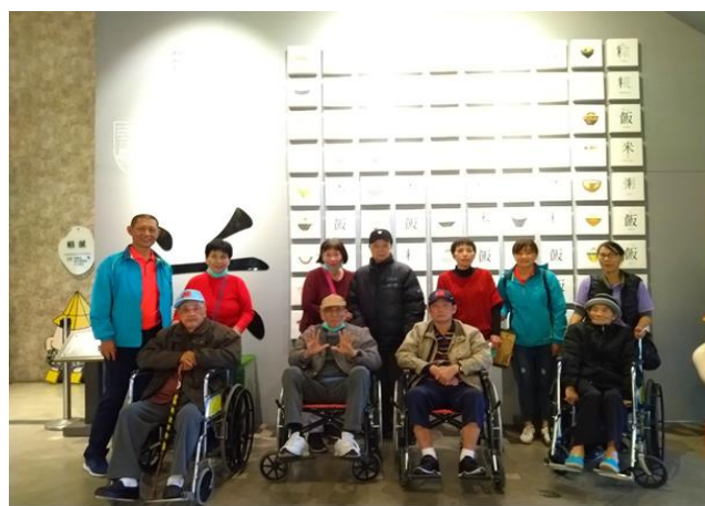
住民們參觀台灣穀堡