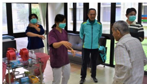
108 年度長者施打流感疫苗