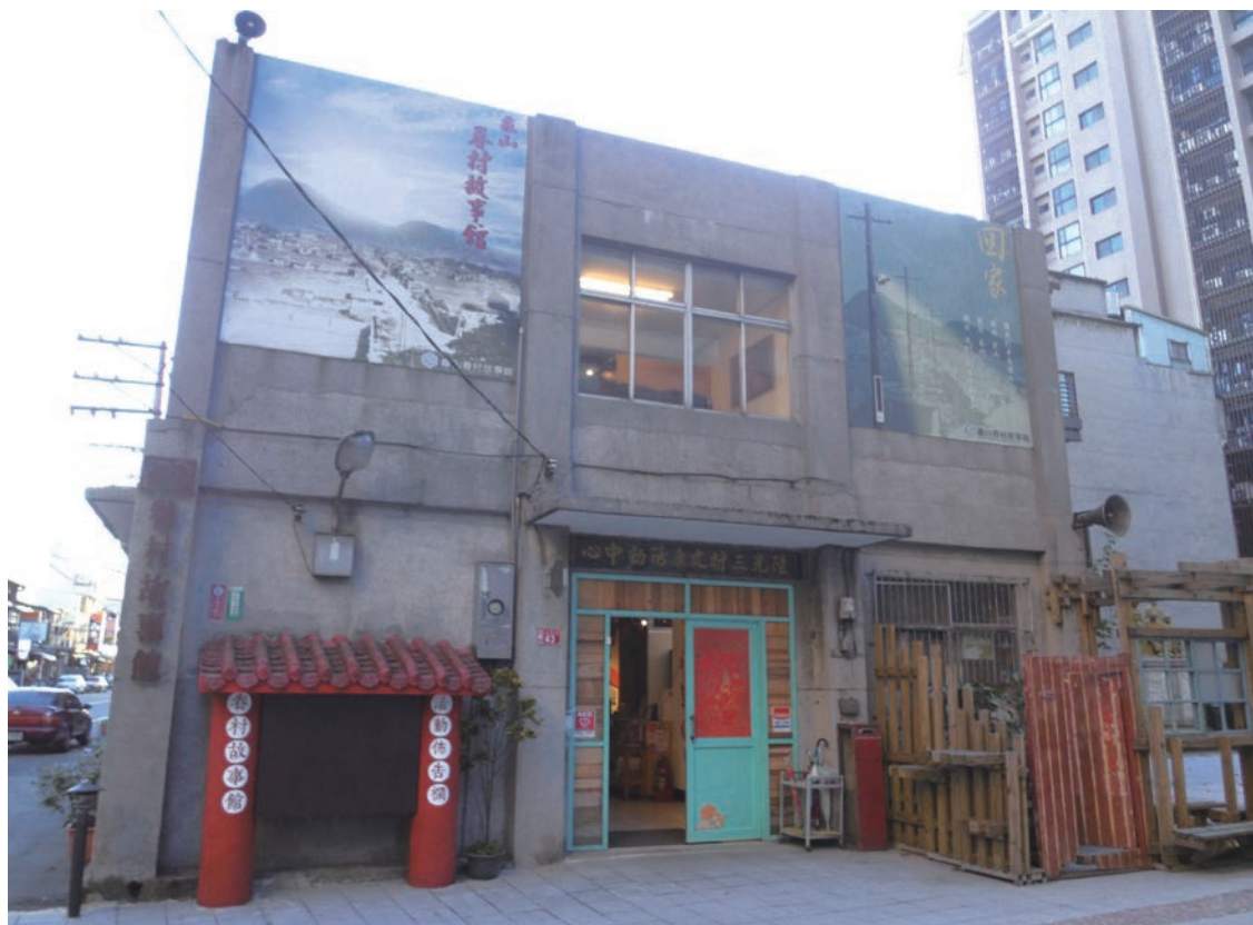
▲眷村故事館的前身是陸光三村文康活動中心。

陸光三村文康活動中心獲得保留後，經桃園縣政府文化局規劃改建成眷村故事館，介紹龜山區眷村的歷史文化，成為桃園最早活用的眷村建築遺址。民國