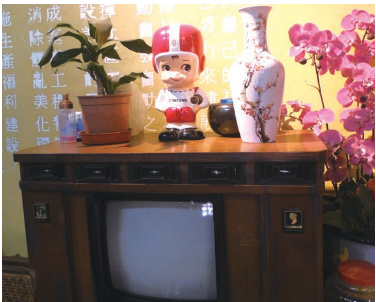
▲大同寶寶與拉門電視。