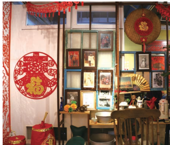
▲眷村故事館的剪春特展，用眷村常見的剪紙藝術，迎接新春的喜氣。