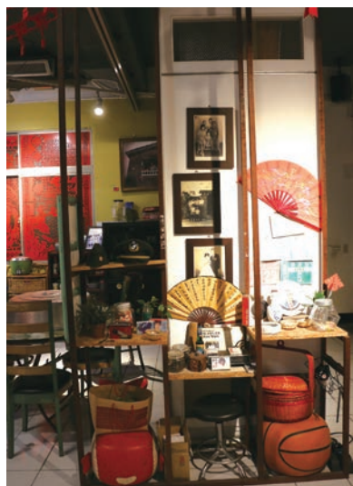
▲昔日眷戶的珍藏品。