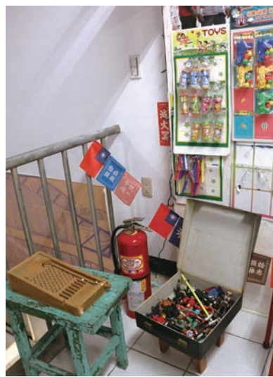
▲彈珠檯和機器人模型。