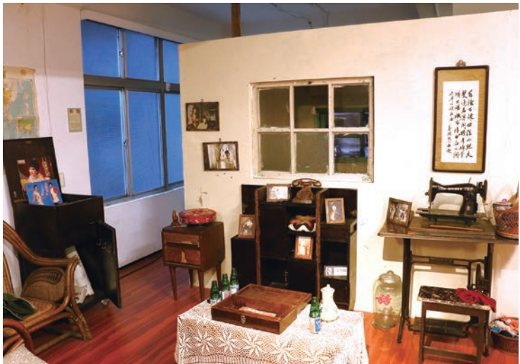
▲懷舊的空間設計與傢俱，彷彿重現過去眷村的生活場景。

除了桃園市政府文化局和民間社團的推動，陸光三村原居民也積極參與眷村故事館的經營，如：館內有紀錄片和聲音箱，以影像和聲音的方式，保留眷村民民的生活回憶，為逐漸凋零的眷村文化留下珍貴紀錄；部分展覽由館方和原居民共同企劃，一〇六年就曾為眷村媽媽拍攝沙龍照，展現眷村女性時尚的一面；另陸光三村原居民也常到這裡聚會，也使眷村故事館多了聯繫居民情感的功能。