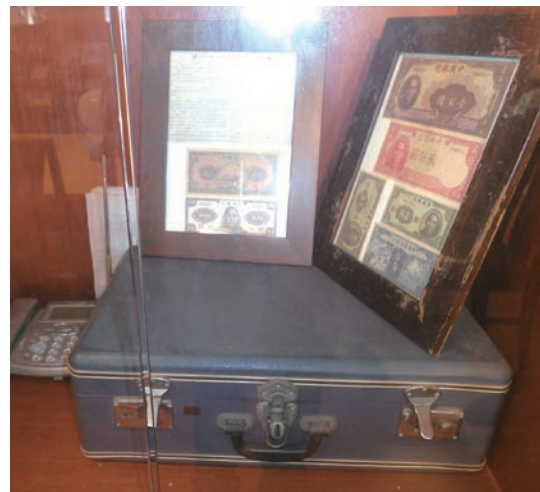
▲舊版新臺幣與行李箱。

眷村故事館在「養雞場藝術發展協會」的用心經營下，經常更新展覽內容，例如以「剪春」為主題，展示眷村的剪紙文化，一張張各種圖案的紅色剪紙，貼滿了眷村故事館一樓的牆壁和窗戶，也為館內帶來了濃濃的眷村情調。