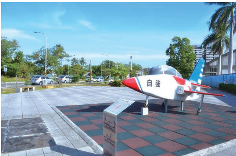
▲水交社路上的 AT-3 模型機說著雷虎故鄉的故事。