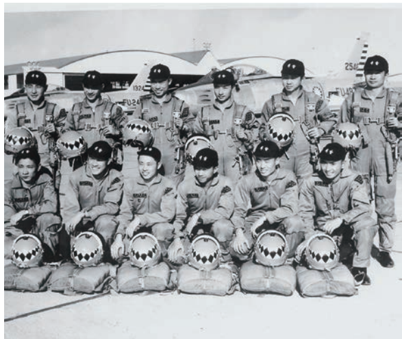
▲雷虎小組在美參加表演。

水交社文化園區分公園及古蹟宿舍群，公園已完工啟用，保留原自治會辦公室及十二棟中低階軍官宿舍。公園在綠意景觀生態中，結合舊建築遺址，保留原有舊巷道、樹木及眷舍的紋理地景；在舊巷弄磚牆上，設計套印雷虎小組戰技表演的玻璃裝飾，將眷村與空軍意象融入，留下過往眷村生活的痕跡。為活化公園區的空間，也成立「水交社工藝聚落」，徵選工藝創作團隊進駐，打造兼具「傳統工藝」與「城市生活」的休憩新場域。