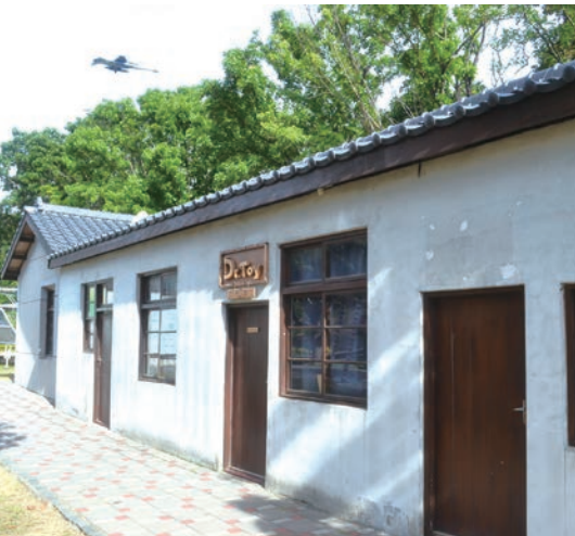
▲水交社就在臺南機場航道下，可觀看戰鬥機起降。