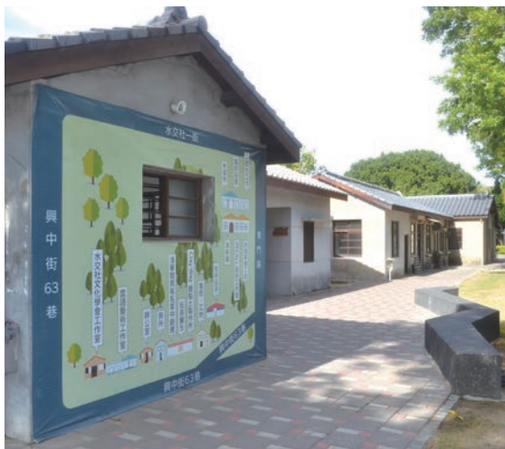
▲水交社眷村文化園區保存部分眷舍，留住眷村的記憶。

如今，水交社在政府與昔日居民的共同努力下展現生機，居民期盼水交社如同村子口依然挺立的老棗樹，傳承雷虎精神，也立下眷村風華再起的典範。