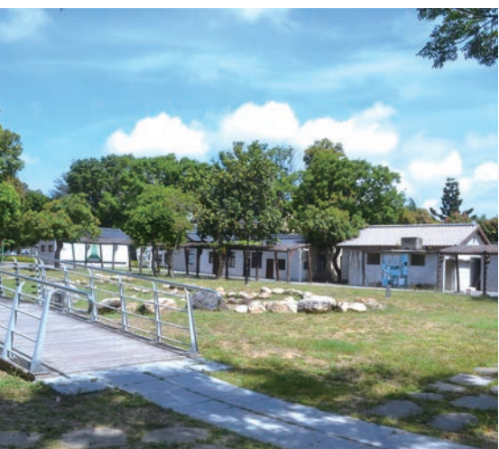
▲水交社文化園區著重文化與生態特色。