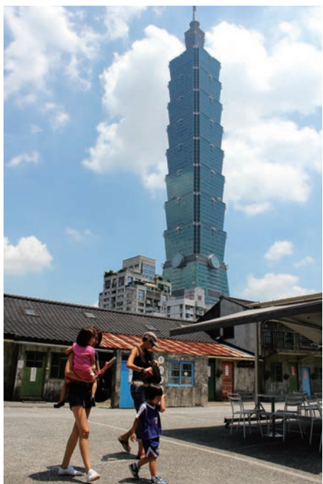
▲臺北 101 大樓旁的四四南村吸引許多民眾前往，遊客穿梭在現代都市和老眷村之間，畫面形成強烈對比。

「四四南村」的老宅就像「任意門」，讓人可以隨時穿越現代與過去，在饒富趣味與文化內涵的交錯空間裡，承繼前人的辛勤，開創眷村文化更美好的未來。