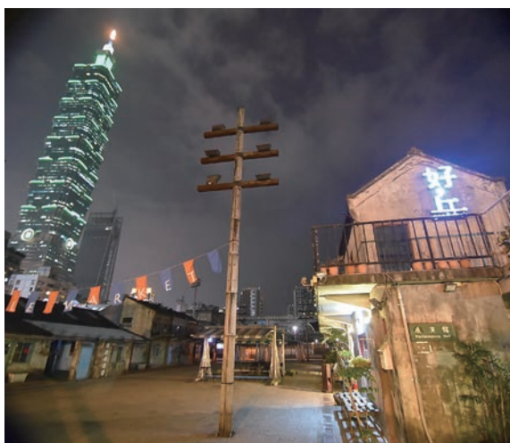
▲位在四四南村的「好丘」信義店。