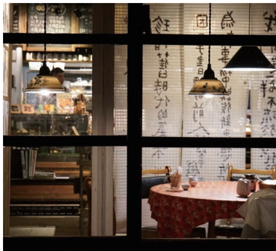
▲「好丘」信義店就位在昔日「四四南村」的舊房子內，在這裡享用眷村菜很有「克難感」。