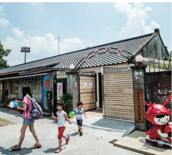
▲從前的「四四南村」，如今已改造成「臺北市信義公民會館」。