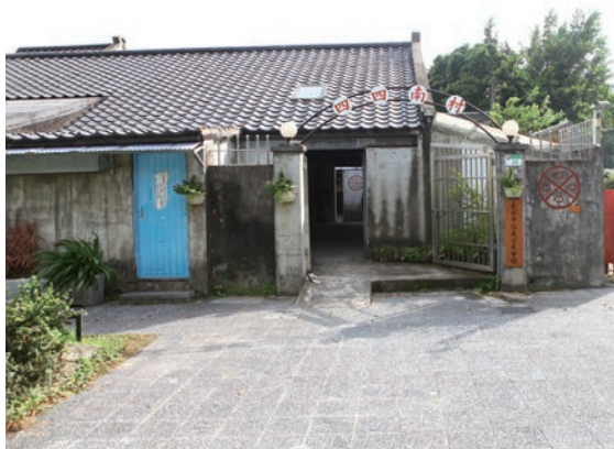
▲老宅牆壁上仍有「四四兵工廠」廠徽。