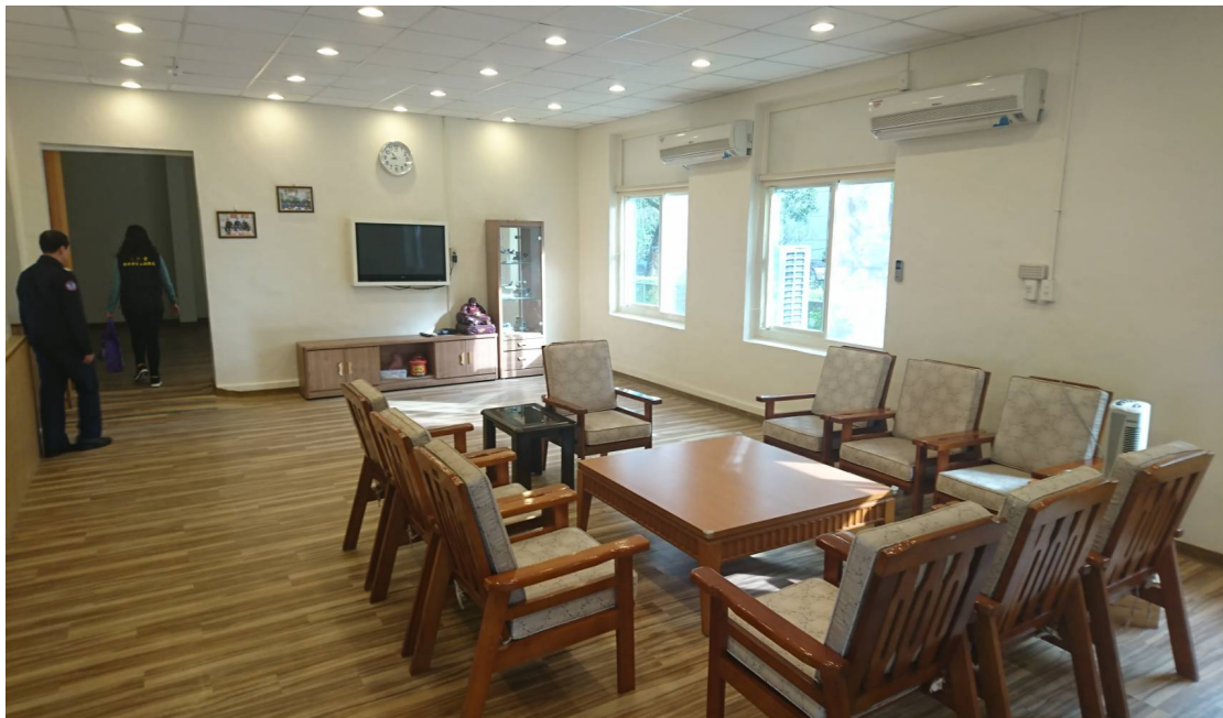
圖四 八德路退舍的室內空間經過整建，地板十分平整