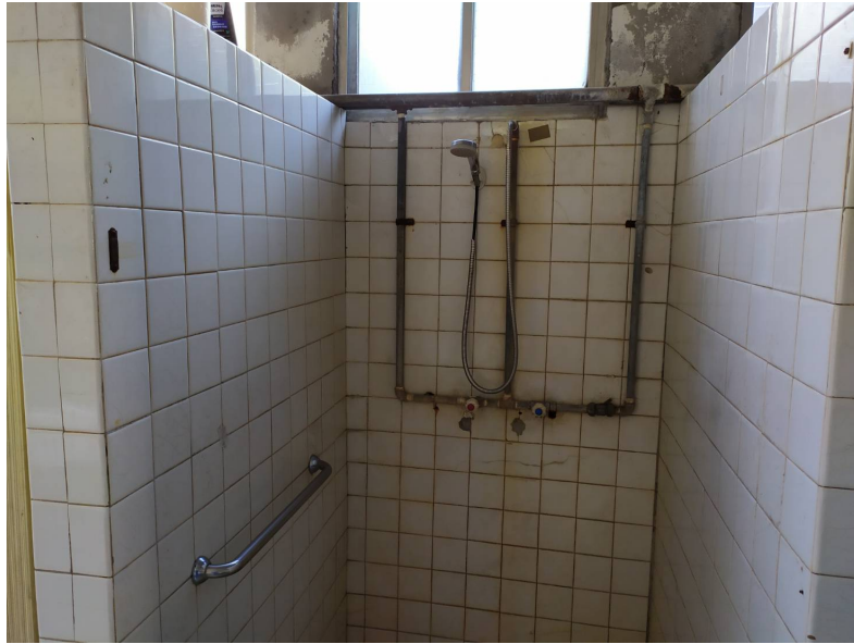
圖三 大我新舍的衛浴間設有扶手