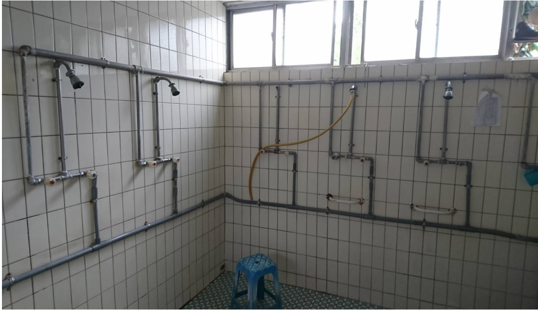
圖五 吳興街退舍的公共衛浴間