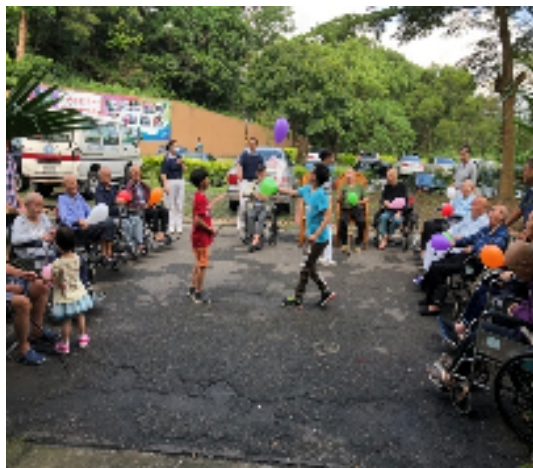
養護一堂 A 棟戶外活動廣場