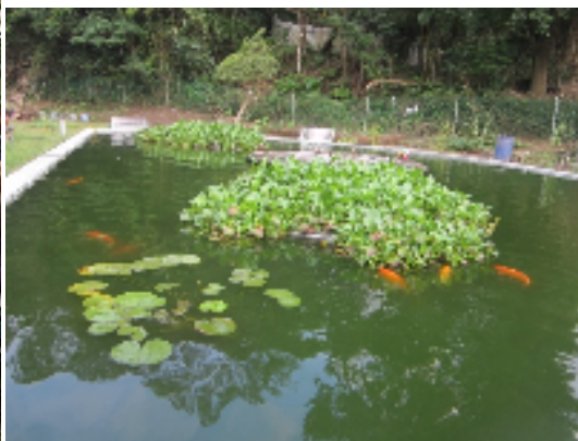
逸園自然生態錦鯉魚池