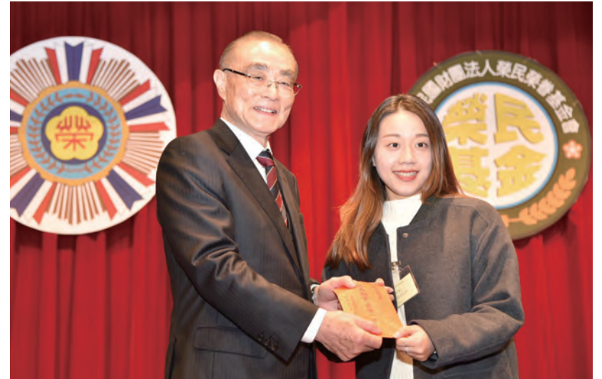
↑ 期勉同學們學習榮民的精神，由孝順父母做起。

2019年12月財團法人榮民榮眷基金會頒贈獎學金，此次頒獎典禮首次移師至臺中欣中天然氣公司舉辦，主任委員擔任頒獎人並勉勵學子莫忘榮民大愛。