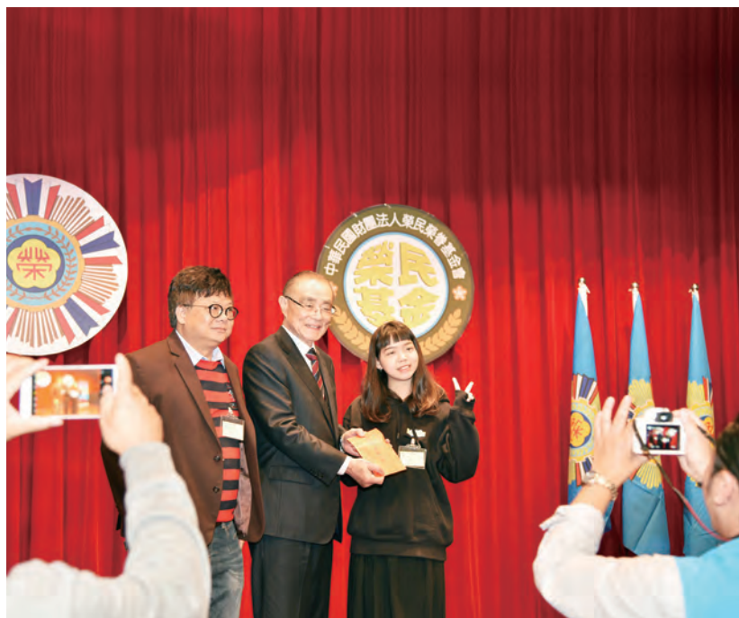
↑ 榮獲獎學金的學生相當開心。