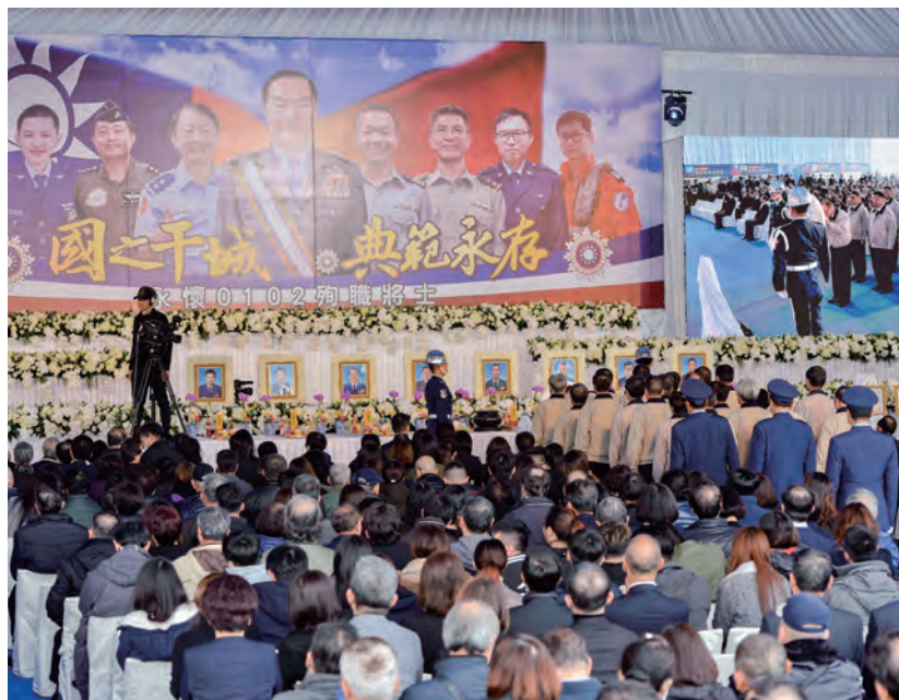
↑公祭現場肅穆而哀戚。