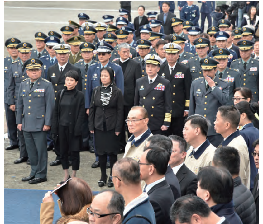
↑三軍將士一同送別八位弟兄。

2020年年初發生了一件令全體國人都相當哀慟的事情，1月2日時任參謀總長沈一鳴上將等八位軍官搭乘黑鷹直升機於烏來山區失事，造成國軍人才重大損失。主任委員聞訊後悲痛不已，隨即赴臺北追思會現場獻花致哀，並於公祭日率輔導會同仁前往致敬。