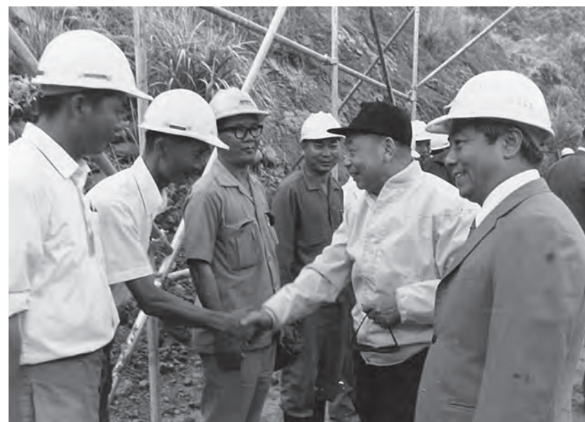
↑經國先生慰問榮民員工辛勞。

背著空軍降落傘，他與海、陸軍士官兵的合照，開關中橫時與工作人員同甘共苦相片，尤以「埋鍋造飯」，與同仁席地共寢，讓我感動不已，特與大家分享。我們永遠懷念他帶領著我們國家在七十年代建設臺灣、發展經濟，使我們成爲亞洲四小龍之首，對親民、愛民的偉大領袖，我們永遠懷念，也願經國先生的精神永遠與我們同在！