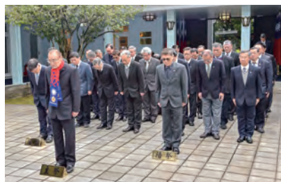
↑經國先生令後世永遠緬懷。