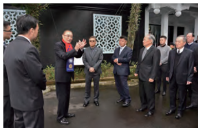
↑我向大家訴說當年往事。