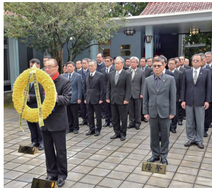
↑我率領輔導會同仁向經國先生獻花致意。

1月13日為蔣經國先生逝世紀念日，輔導會每年率員至大溪頭察經國先生靈寢謁陵。主任委員於謁陵後感念經國先生生前為國為民寫下此文。經國先生也是輔導會的大家長，自民國45年4月28日赴任、53年6月底卸任，八個年頭走遍臺灣關懷榮民，奠定輔導會照顧榮民（眷）的強大基礎。