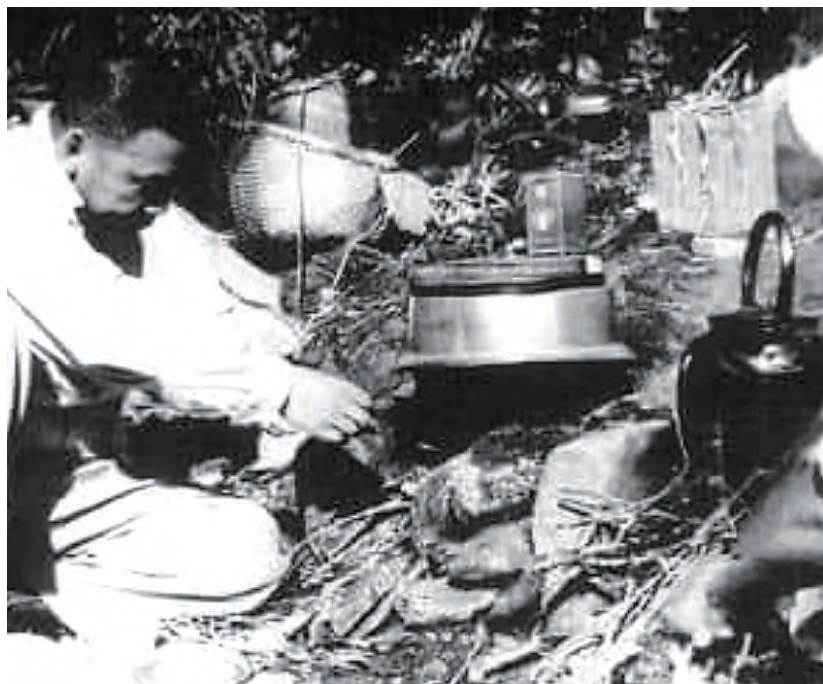
↑開墾公路期間，經國先生時常這樣就地而炊，與榮民弟兄一起吃飯。