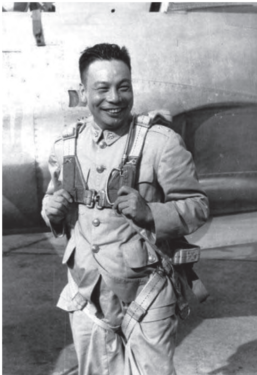
↑輔導會永遠的大家長經國先生。