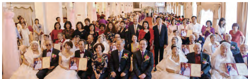
↑十對長輩預訂來生再續牽手情。

主任委員於輔導會辦公室長廊中放入榮民照片，讓長廊走起來就像看畫展般的優雅，也讓原本嚴肅的辦公室氣氛在溫暖照片的襯托下，溫暖了不少。他在此篇文章中特別提到輔導會新竹榮家與新竹榮服處為老榮民舉辦的步紅毯活動，讓主任委員看了特別感動。