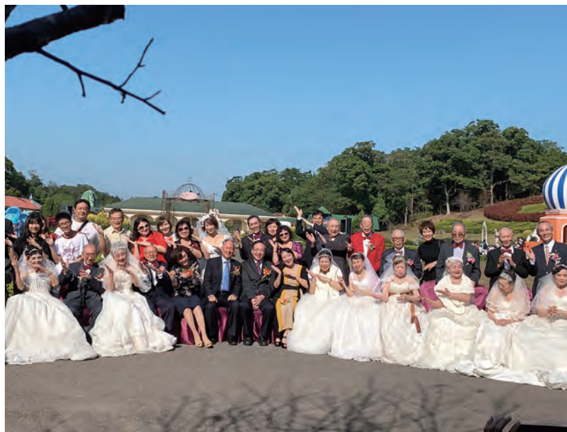
↑十對榮民長輩們在子女及親友祝福下，穿著白色婚紗再度攜手步上紅毯。