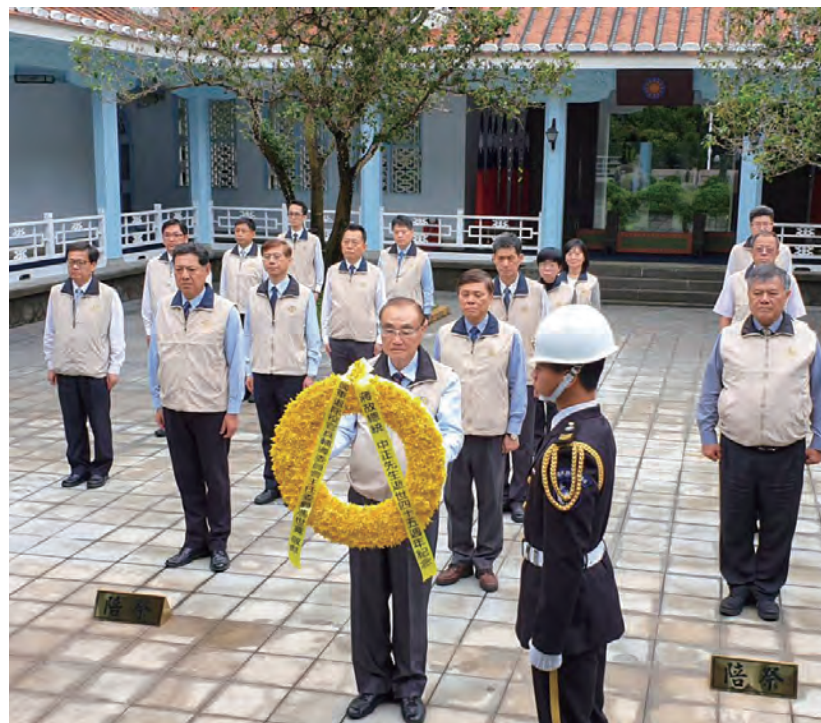
↑ 每年清明節期間，去慈湖謁陵是我們退輔會的年度計畫。

每年的清明節到慈湖謁陵，是輔導會必定執行的年度計畫，2020 年清明節主任委員按照往例率輔導會一級主管前往謁陵，並在謁陵結束後進行環境教育課程。他們參訪了後慈湖園區，在解說員的介紹下，主任委員一行人對於後慈湖園區的自然生態有了更進一步的認識。