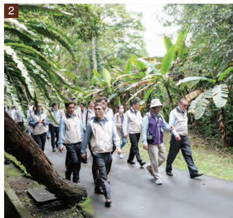
1. 主任委員手稿。 2. 後慈湖自然生態讓我們大開眼界。

溯到軒轅黃帝平定天下後，設祭壇拜后土聖母為國祈福。後堯、舜、禹、湯、夏、商、周到漢武帝，至宋真宗有九皇二十四次來此祭祀，據載宋真宗（趙恆）為祈子在后土祠長住一年得子（宋仁宗），（野史記載狸貓換太子的趣聞），內古文物之多難以計數，但我發現祠門石柱、壁雕等多處，細看皆非原物，乃私下以五十元人民幣予一年長者，問其原因，得知文革期間，不知從何而來之十多位青少年，打砸、搶燒連后土祠外圍寬廣精美之亭院亦不免，真令人心痛！因此想到故宮文物若非蔣公安排來臺，文革浩劫時此千年文化寶物下場如何？留給大家去想吧！就此例懷念蔣公何須華麗詞藻！