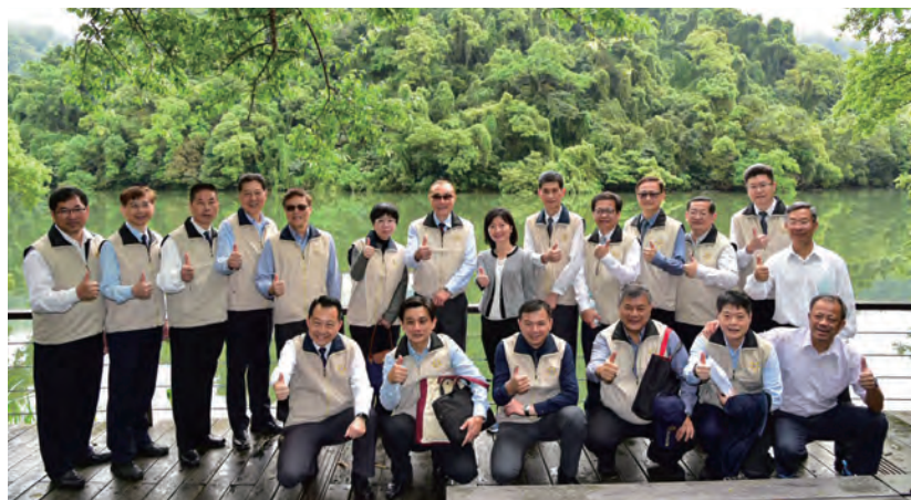
1. 輔導會同仁於後慈湖合影留念。