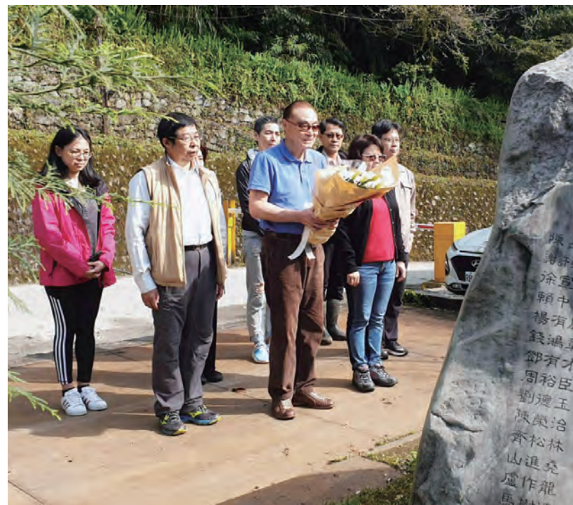
↑我於榮啓山林向亡故開發的榮民獻花致敬。

輔導會為宣揚榮民精神傳承榮民文化，將於宜蘭地區規劃建置榮民文化園區。主任委員將榮民文化園區規劃為輔導會未來五年跨年度重大施政計畫，建案將貫徹輔導會政策目標，結合宜蘭在地特色，融合當地環境及人文特質，將宜蘭未來二十年發展納入思考，整體規劃打造兼具未來性、藝術性及國際性之園區，期待能將榮民精神成功推向國際。