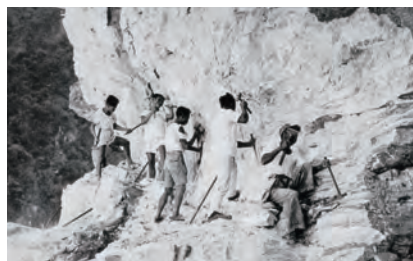
↑老兵不死，國家建設大功臣。