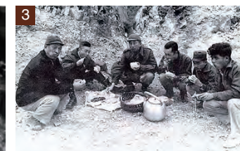
1. 在全民的努力下，我們創造了經濟奇蹟。 2. 輔我們國家曾走過「山上伐木、山下陪酒」賺取外匯的年代。 3. 辛勞的榮民前輩於路旁席地吃飯。

家曾走過「山上伐木、山下陪酒」賺取外匯的年代，今天在全民努力下，我們創造了經濟奇蹟、民主政體，我們有了人力、財力與物力，我們要為宜蘭這塊未開發的淨土及鄉親們留下他們將引以為榮的建案，要以紀念榮民文化、文物，傳承他們對國家由以生命保衛臺澎金馬到以血、汗、性命建設的臺灣的大愛精神為主軸，配合都市發展跟上現代化的腳步完成本案。