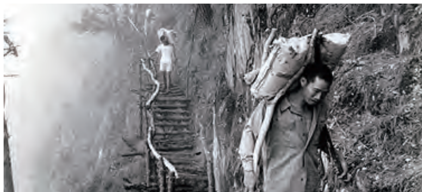
↑橫貫公路開闢時，榮民前輩不畏艱苦克難工作。