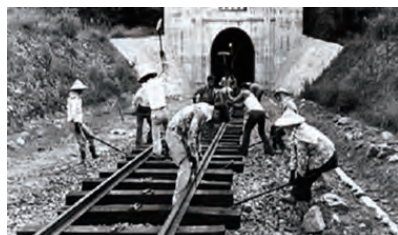
↑在全民努力下，我們創造了經濟奇蹟、民主政體。