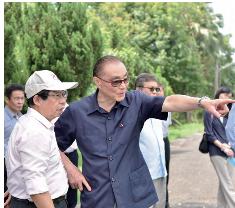
↑承先啓後，我們要為宜蘭這塊未開發的淨土及鄉親們留下他們將引以為榮的建案，以紀念榮民文化。

「森活計畫」正積極的推動當中，也舉辦過幾次研討會廣邀各界研商，主任委員會後之餘想到國家曾走過「山上伐木、山下陪酒」賺取外匯的年代，在全民努力下，創造了經濟奇蹟、民主政體等，因此主任委員殷殷期盼榮民文化園區能在全體榮民及各界人士之力共襄盛舉，如期完成。