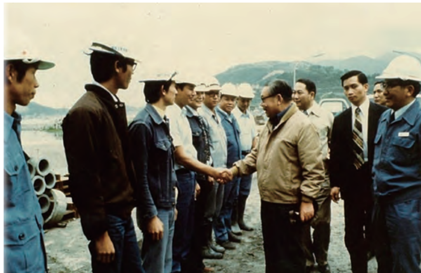
↑民國 64 年 10 月 26 日行政院長經國先生視察「十大建設」之「臺中港」建港工地，與港區施工的榮民工程處員工握手致意。

「榮民工程股份有限公司」在 109 年 5 月 1 日起解散，勾起主任委員於 70 年代派駐沙烏地阿拉伯時的回憶。榮民工程股份有限公司前身為「榮工處」。榮民工程事業管理處於民國 45 年創立，為臺灣經濟建設、援外機密任務，立下無數汗馬功勞。初期因技術貧乏，資源短缺，僅憑人力及簡陋的手工具，完成了許多重大國內工程。其後配合政府「公營事業民營化」政策，榮民工程事業管理處於民國 87 年正式改制為「榮民工程股份有限公司」。伴隨臺灣經濟成長起飛，走過長達六十餘年的歲月，於 109 年功成身退，正式走入歷史。