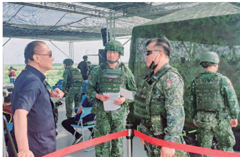
↑ 參演官兵不畏艱難，使命必達。

2020年7月國防部舉行「漢光三十六號三軍聯合反登陸作戰」實兵操演，輔導會受邀參觀。主任委員回憶起國防部長任內的漢光演習點滴，也向演習中辛勞的官兵以及不幸犧牲的官兵致上最敬意。