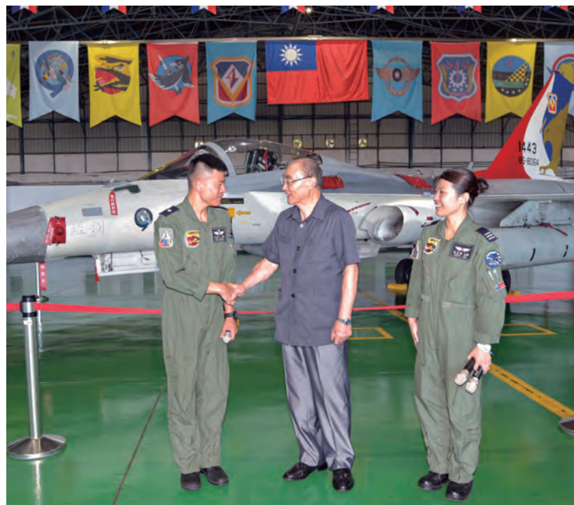
↑我鼓勵年輕軍官繼續為守護國家努力。

2020年9月3日是九三軍人節65周年，空軍上將退役的主任委員寫下文章紀念軍人節，並回憶抗戰勝利至今，國軍默默守護國家的功績。主任委員認為慶祝九三軍人節最重要的意義在於承平時應盡一切努力來推動全民國防，首先應運用各種機會與方式讓全民認識國防，進而增強全民保家衛國的愛國意識，這才是我們當今慶祝「九三軍人節」最重要的意涵。